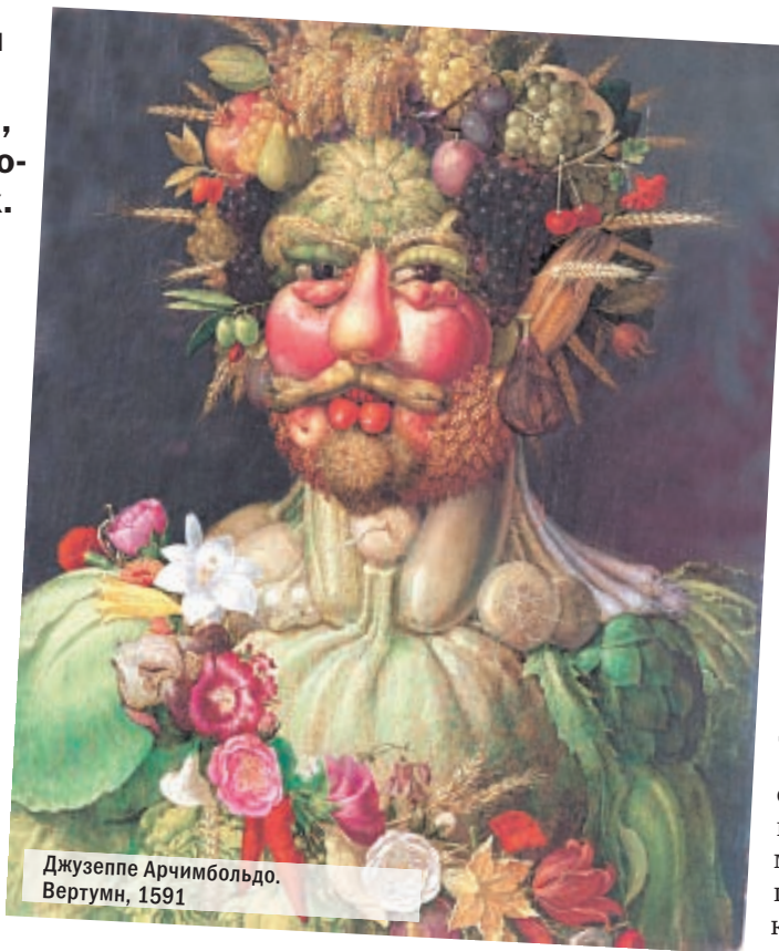
Джузеппе Арчимбольдо. Вертумен, 1591