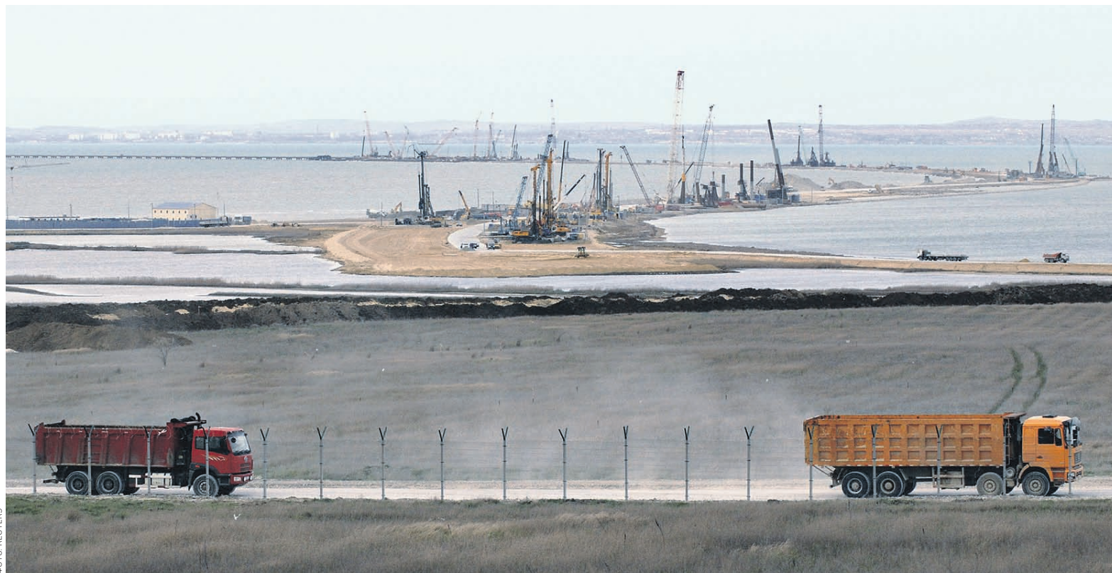
Мост через Керченский пролив — самый дорогой, большой и технически сложный в России

Мост через Керченский пролив — самый дорогой, большой и технически сложный в России. Например, на строительство моста на остров Русский во Владивостоке длиной более 3 км потратили 35,4 млрд руб., стоимость моста через Лену оценивали в 54,9 млрд