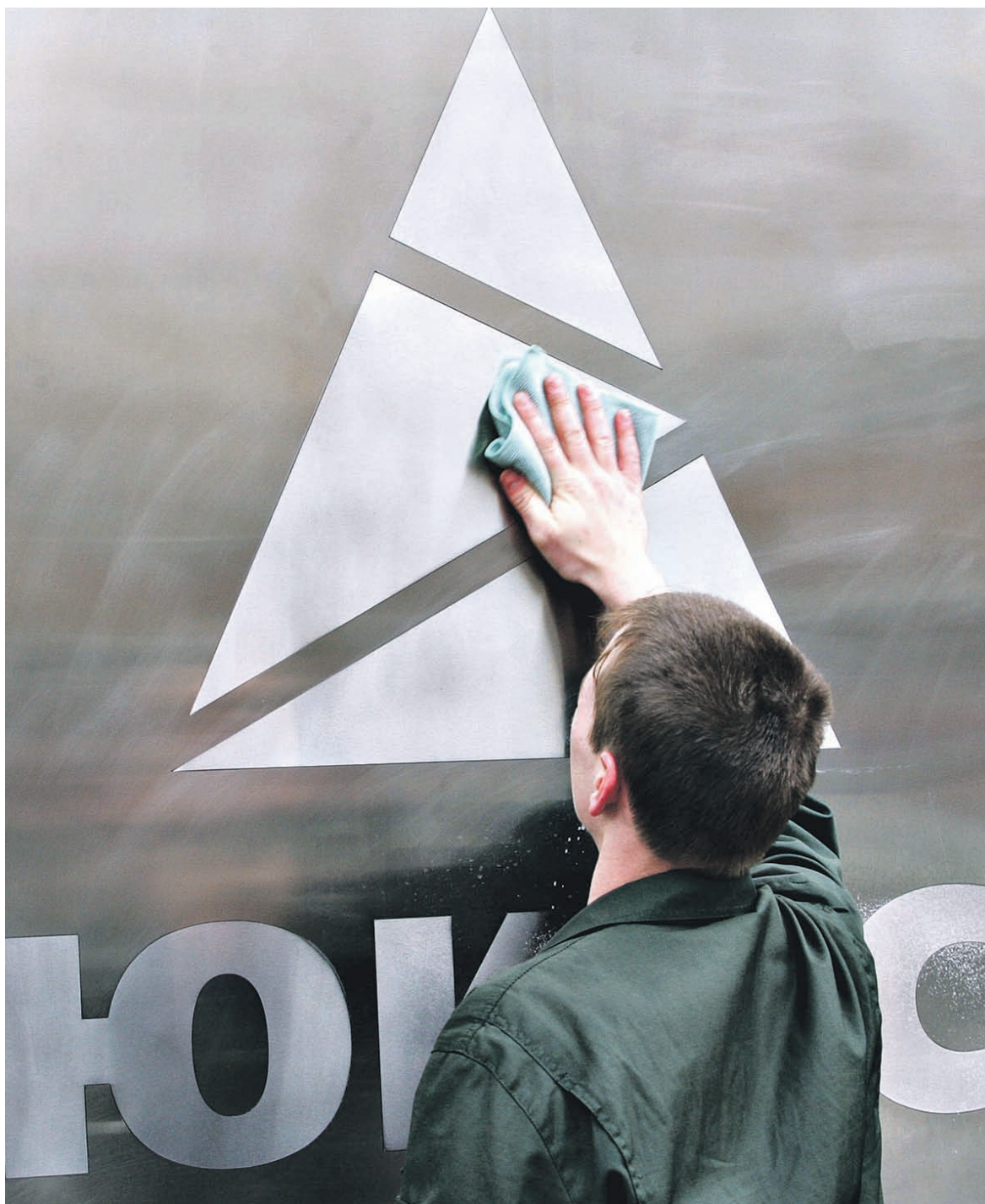
Само по себе решение голландского суда не снимает аресты с недвижимого имущества и счетов России за рубежом, но повышает шансы на их удачное оспаривание

Однако адвокаты акционеров ЮКОСа указывают: в самой Конвенции указывается, что исполнительное производство «может», но не «должно» прекращаться из-за решений третьих стран. «Автоматического прекращения исполнительного производства не будет. Самый экстремальный случай — это Франция, где в правоприменительной практике не смотрят на процесс по аннулированию арбитражного решения в стране, где базируется арбитраж. Проще говоря, каждый суд в каждой