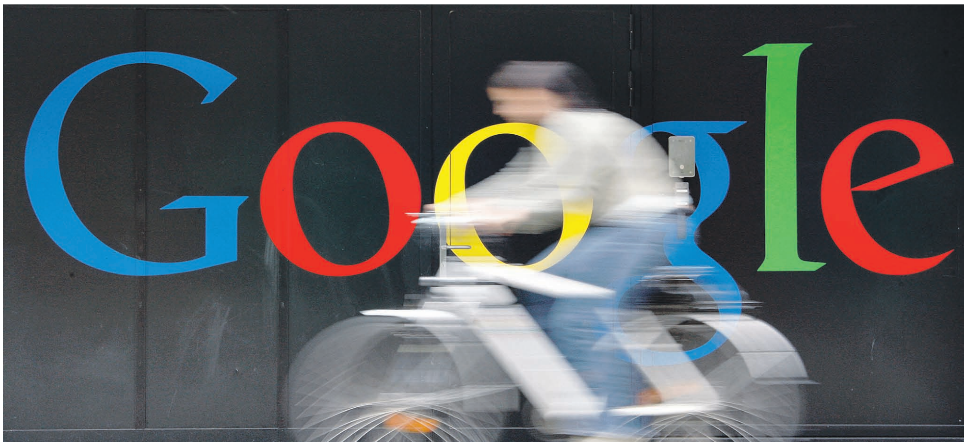
«Уведомление о претензиях» Европейской комиссии в адрес Google стало продолжением трехлетнего антимонопольного разбирательства