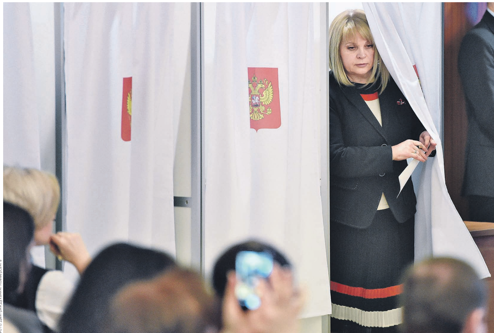
Накануне выборов в Госдуму Элла Памфилова (на фото) хочет показать, что она не Владимир Чуров

Данное решение не связано с шумихой, которую подняли в соцсетях сторонники оппозиционера Алексея Навального, подчеркнула Памфилова. Всего в ЦИК поступи-