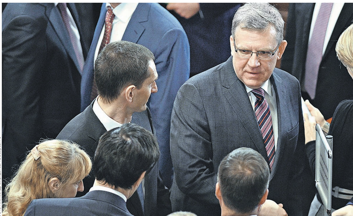
По словам президента Путина, экс-глава Минфина (на фото) «хочет вносить свой вклад в решение проблем, перед которыми стоит страна»

14 апреля тему назначения Кудрина в ЦСР во время прямой линии затронул Владимир Путин, который назвал его одним из «крепких и полезных экспертов». «Мы договорились, что он более активно будет работать в экспертном совете при президенте, может быть, будет одним из заместителей этого экспертного совета», — говорил глава государства. Он уточнял при этом, что Кудрин может работать не только в прези-