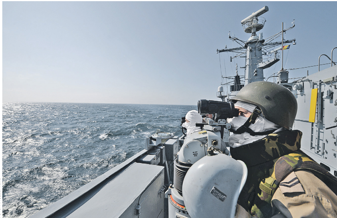
В состав военно-морской группы номер два, отвечающей в НАТО за регион Средиземного и Черного морей, сейчас входят девять кораблей из семи стран альянса. На фото: румынский фрегат «Королева Мария», относящийся к группе, во время военных учений

«Зачет тоннажа, согласно конвенции, идет по национальному признаку, а не блоковому, поэтому для создания серьезной группировки достаточно, чтобы каждая из 28 стран НАТО послала в Черное море по одному кораблю», — пояснил РБК ведущий эксперт