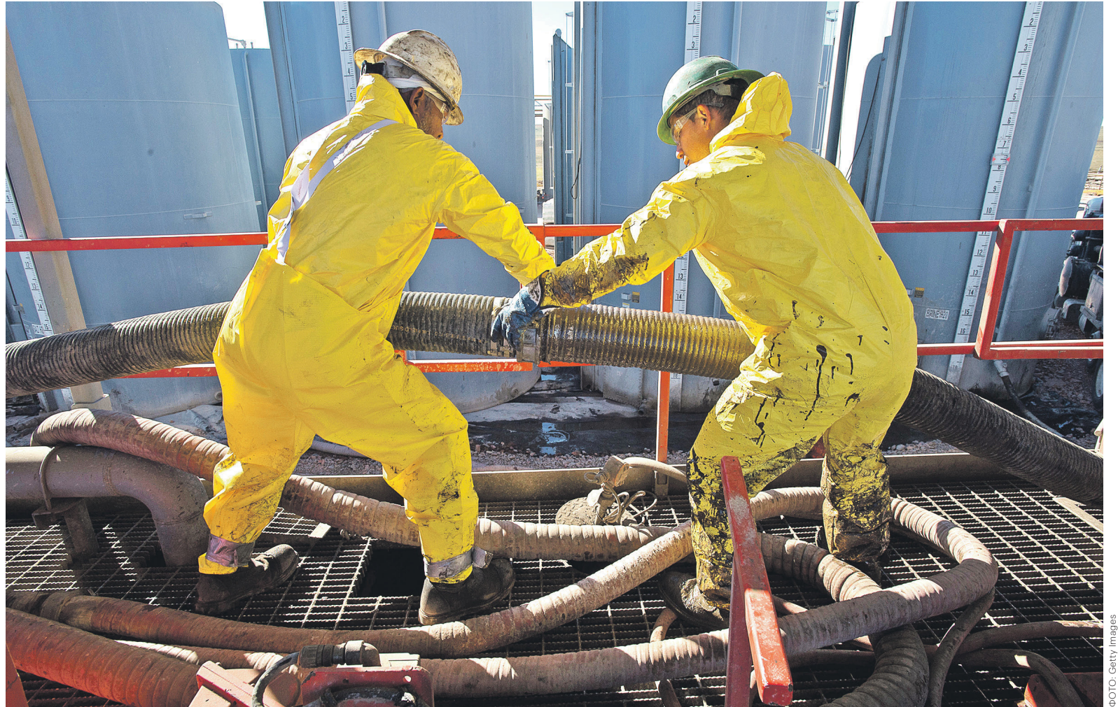
Американские сланцевые мейджоры восстанавливаются от двухлетней ценовой войны с ОПЕК и анонсируют планы по наращиванию добычи в Северной Дакоте, Оклахоме и других нефтеносных бассейнах страны

Американские сланцевые мейджоры восстанавливаются от двухлетней ценовой войны с ОПЕК и анонсируют планы по наращиванию добычи в Северной Дакоте, Оклахоме и других нефтеносных бассейнах страны. Добыча в крупнейшем в Америке Пермском бассейне растет уже последние полгода. Заявления об активизации деятельности прозвучали на этой неделе от таких компаний, как Hess, Chesapeake Energy, Continental Resources и англо-голландской Royal Dutch Shell. Объявленные