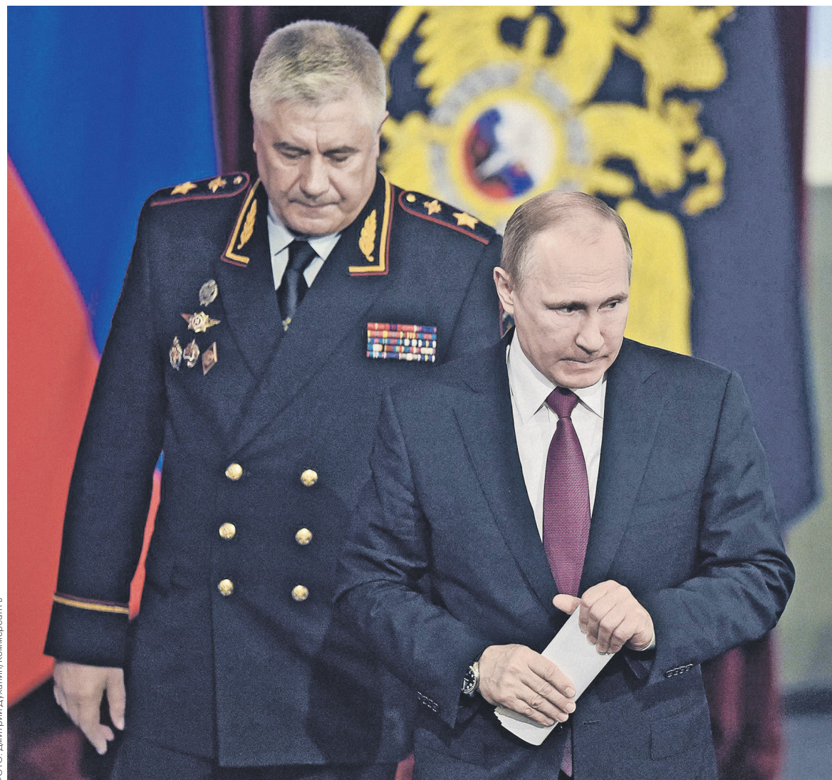
«В прошлом году по подозрению в серьезных преступлениях был задержан целый ряд высокопоставленных должностных лиц ведомства. Эти факты... бросили тень на тех, кто честно и профессионально исполняет свой долг», — заявил Владимир Путин на коллегии МВД (глава министерства Владимир Колокольцев — на фото слева)

Коррупционные преступления в прошлом году нанесли российскому бюджету ущерб свыше 19 млрд руб., из которых вернуть удалось