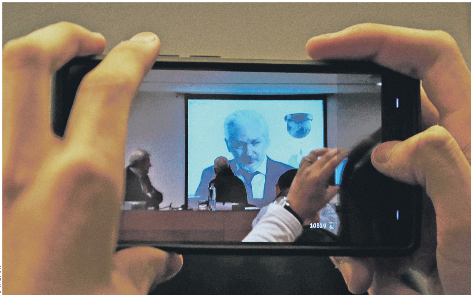
По данным WikiLeaks (на фото — основатель организации Джулиан Ассанж), ЦРУ и MI5 взломали телевизоры: вирусное ПО создавало эффект выключения устройства, когда его владелец нажимал на соответствующую кнопку, но телевизор продолжал работать с включенным микрофоном

На следующий день после публикации Белый дом заявил, что президент США Дональд Трамп был «крайне обеспокоен» нарушением правил безопасности ЦРУ. Пресс-секретарь Белого Дома Шон Спайсер заявил, что «любой, кто причастен к утечке секретной информации, будет привлечен к ответственности по всей строгости закона». Тем не менее ЦРУ так и не подтвердило подлинность опубликованных WikiLeaks документов, якобы подготовленных Центром кибернетической разведки ЦРУ и датированных в основном 2013–2016 годами. «Мы не комментируем подлинность или содержание предполагаемых разведывательных документов», — передает The New York Times заявление официального представителя ЦРУ Дина Бойда. В опубликованном ЦРУ заявлении говорится, что «американская общественность должна быть глубоко обеспокоена любым «раскрытием» WikiLeaks, направленным на нанесение ущерба способности интеллектуального сообщ-