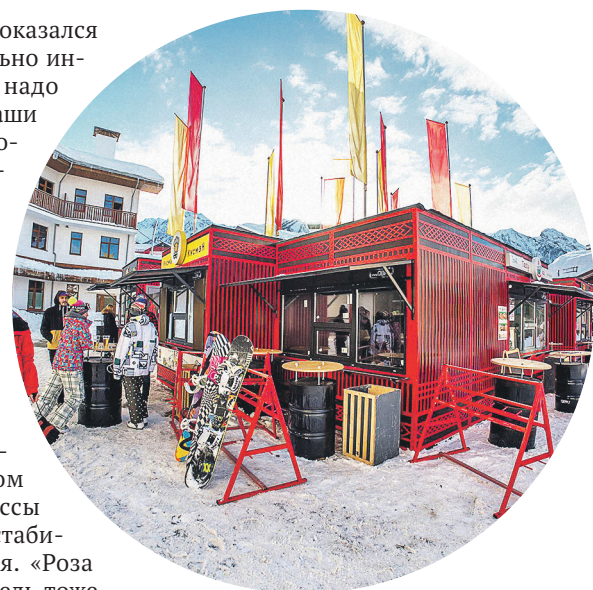
Гастродеревня в Сочи