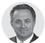
Виталий Мутко Правительство РФ