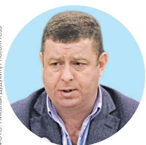
Президент Конфедерации труда России, профсоюза, инициировавшего петицию против повышения пенсионного возраста, которая

набрала миллион подписей, пообещал «более активную фазу» кампании против пенсионной реформы.