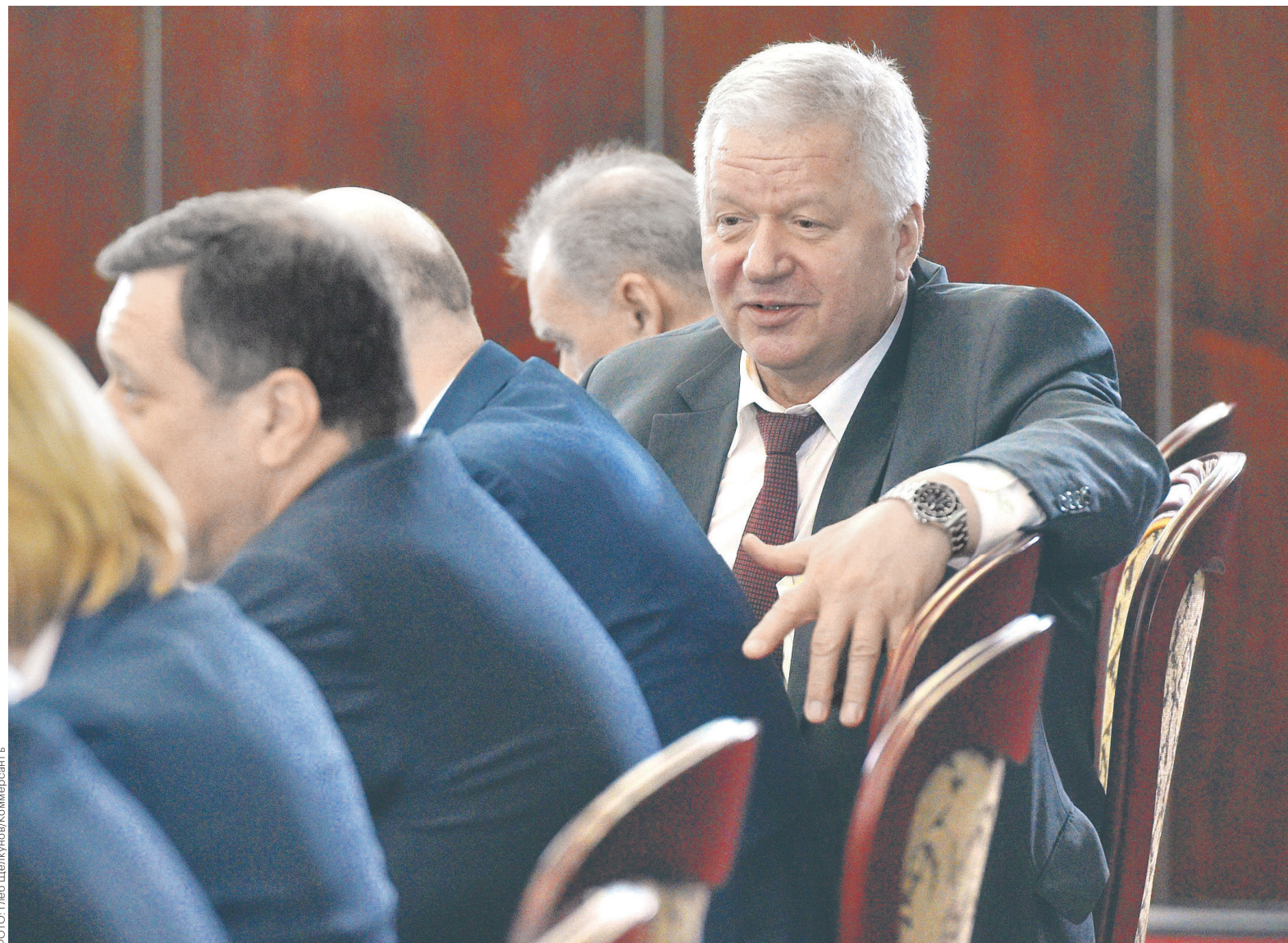
Федерация независимых профсоюзов России, возглавляемая Михаилом Шмаковым, предложила смягчить повышение пенсионного возраста для женщин — это первая официальная инициатива по изменению сценария правительства

Работодатели были менее категоричны. Бизнес «концептуально» поддерживает повышение пенсионного возраста, сказано в решении РТК, однако считает необходимым дополнительные разъяснения по этому вопросу. Нужно «провести детальную оценку» этой меры на экономику, проанализировать риски для рынка труда и систему защиты от безработицы, в частности пособия по безработице для лиц старших возрастов и их профессиональную переподготовку. Кроме того, необходимо предоставить расчеты и детальные показатели, которые подтвердят сбалансированность пенсионной системы при нынешнем варианте повышения пенсионного возраста, оценить расходы на минимизацию рисков и описать направленные на это меры. Бизнес также просит активизировать реформирование института досрочных пенсий — этот вопрос поднимался еще в Стратегии долгосрочного развития пенсионной системы, которую правительство утвердило в 2012 году. Действующая система для досрочников, как сказано в доку-