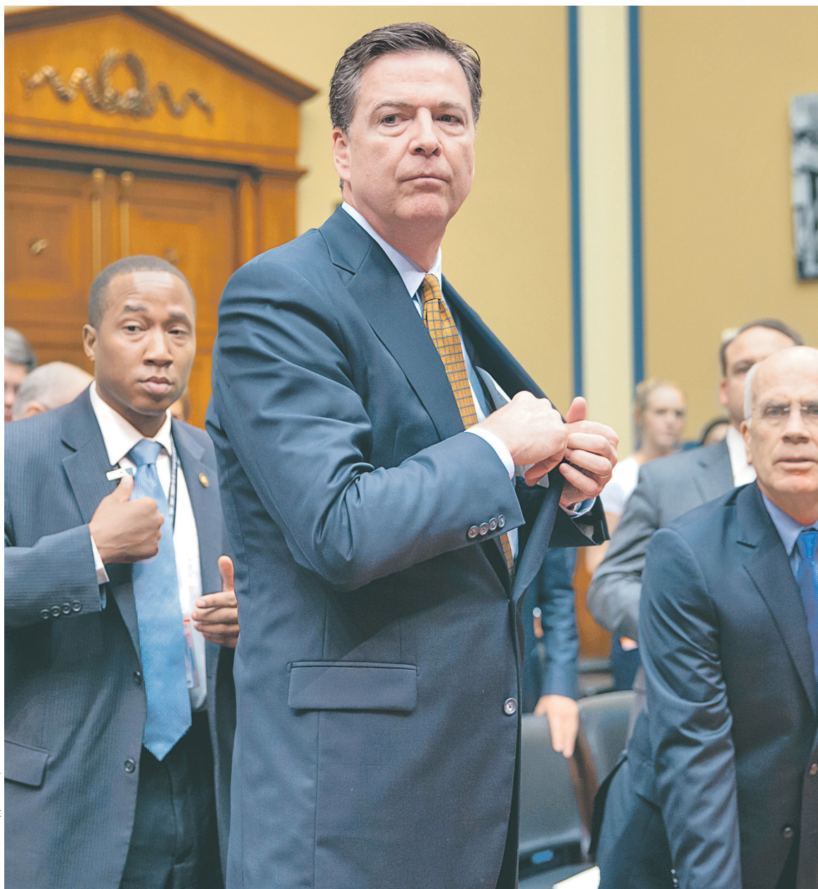
Опубликование доклада о нарушениях ФБР стало «абсолютной катастрофой» для бывшего главы ведомства Джеймса Коми (на фото), считает президент США Дональд Трамп

Кроме того, согласно докладу Коми нарушил субординацию в Минюсте: не посоветовавшись