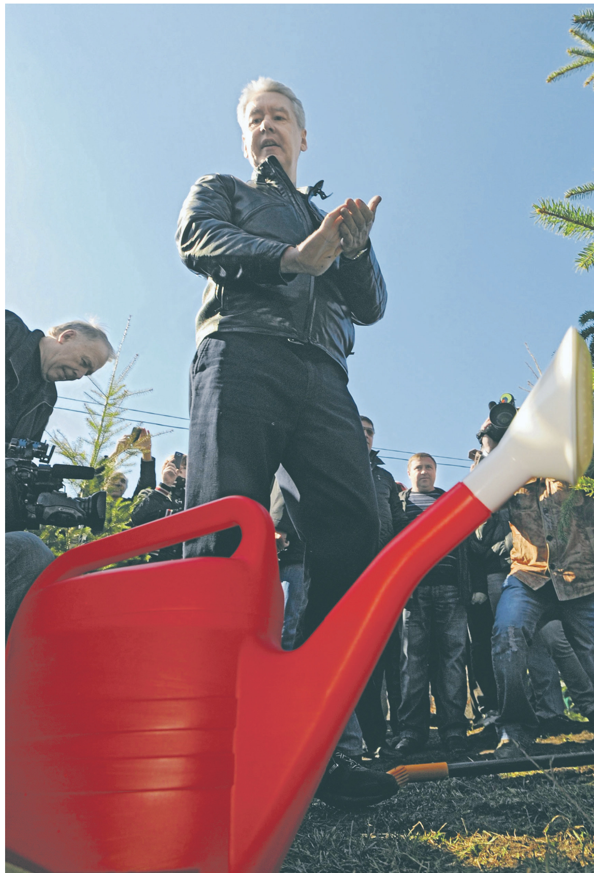
14 мая мэр столицы Сергей Собянин внес в Мосгордуму поправки в городской избирательный кодекс, которые позволяют организовать участки за пределами города. Закон был принят через три дня

«Надо понимать, как это можно реализовать. Звучали возможные критерии для формирования избирательных участков. Это могут быть либо транспортные узлы, либо центры сельских поселений