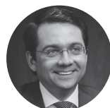
Андрей Чибис Минстрой РФ