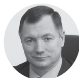
Марат Хуснуллин Правительство Москвы