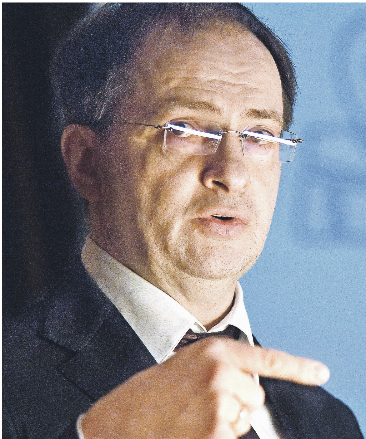
Министерство культуры (на фото — глава ведомства Владимир Мединский), признанное потерпевшим в деле «Седьмой студии», предоставило спецслужбе всю сохранившуюся отчетность организации Кирилла Серебренникова

Минкультуры действительно 8 апреля 2016 года направило в ФСБ такое письмо, подтвердили РБК в пресс-службе ведомства; исходящий номер послания