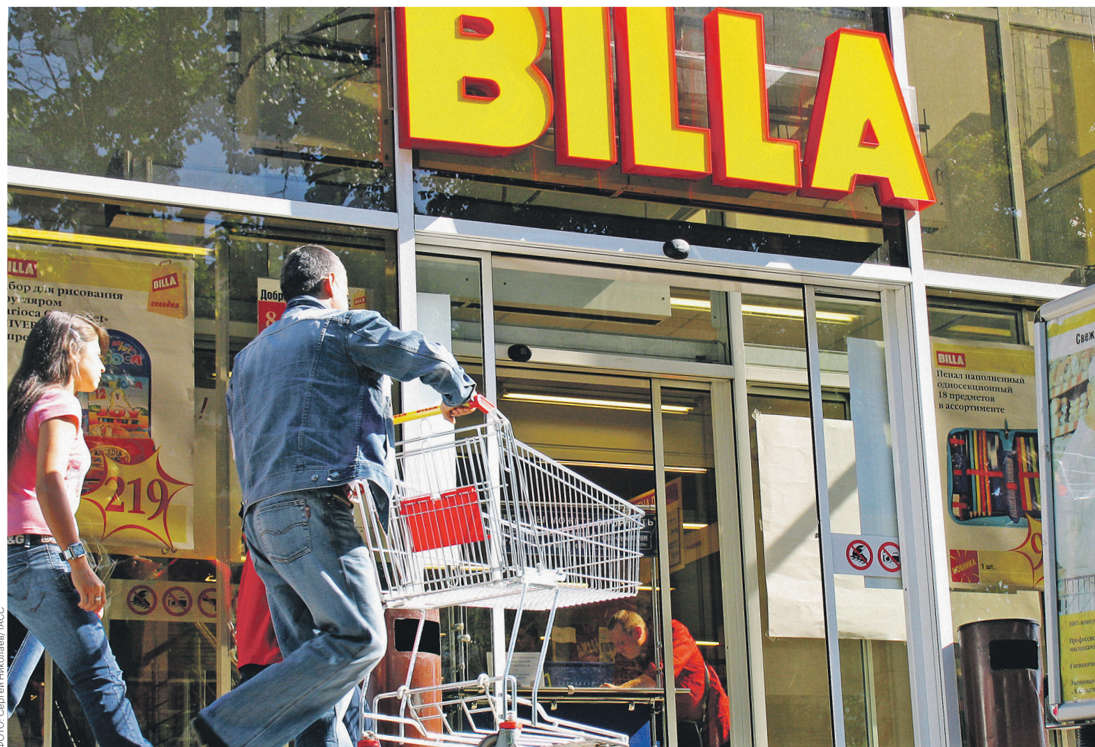
К своему 131 супермаркету Billa присоединит еще 26 площадок, которые перейдут от сети «Я любимый»

Billa — немецкая сеть супермаркетов, принадлежащая Rewe International AG, которая в Европе также управляет сетями Merkur, Penny, Vira и Adeg. На российском рынке Billa работает с 2004 года. Rewe вывела ее в партнерстве с холдингом «Марта». В 2010 году немецкий холдинг выкупил