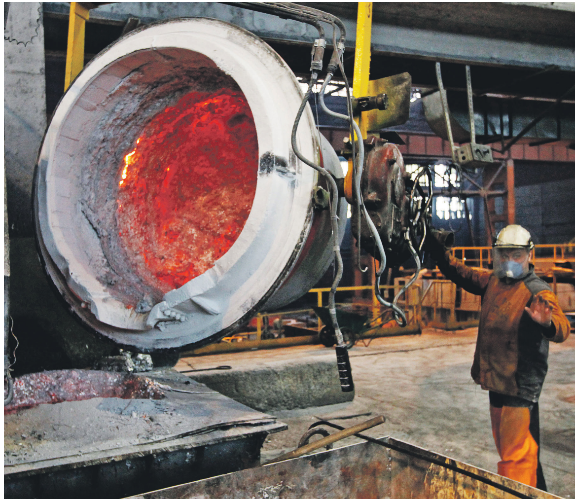
Перед руководством UC Rusal поставлена задача не сокращать производство, которое приведет к сокращению персонала. К тому же возобновление работы электролизных установок после остановки — дорогостоящее мероприятие