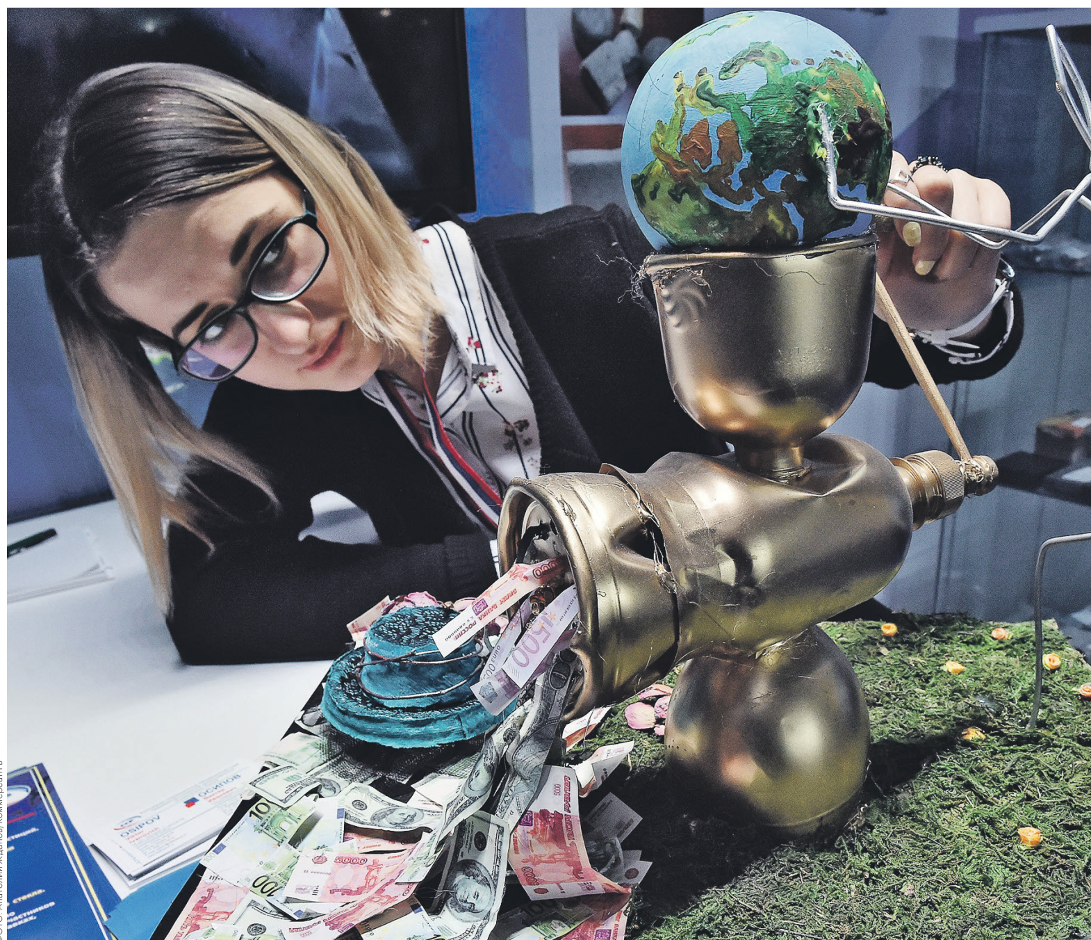
Закупка валюты Минфином сейчас практически не оказывает влияния на колебания курса и носит скорее символический характер

В среду, когда ЦБ закупал доллары для Минфина, рубль укреплялся: поддержку ему, как и валютам других развивающихся стран, оказали растущие цены на нефть, а также снижение опасений по поводу начала полномасштаб-