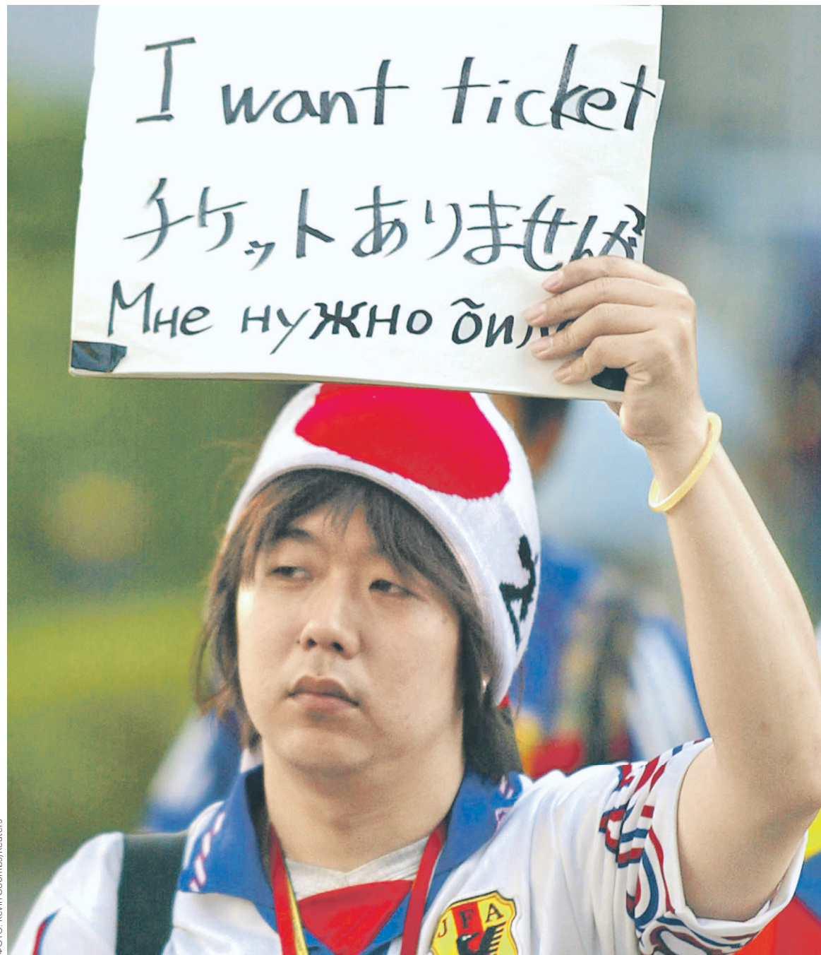
Среди тех, кто покупает у спекулянтов билеты на ЧМ-2018, преобладают иностранцы, утверждают билетные брокеры — для россиян это слишком дорого

«Есть два основных источника получения билетов», — рассказывает РБК Иван, профессиональный билетный брокер из Санкт-Петербурга. — Официальный, через би-