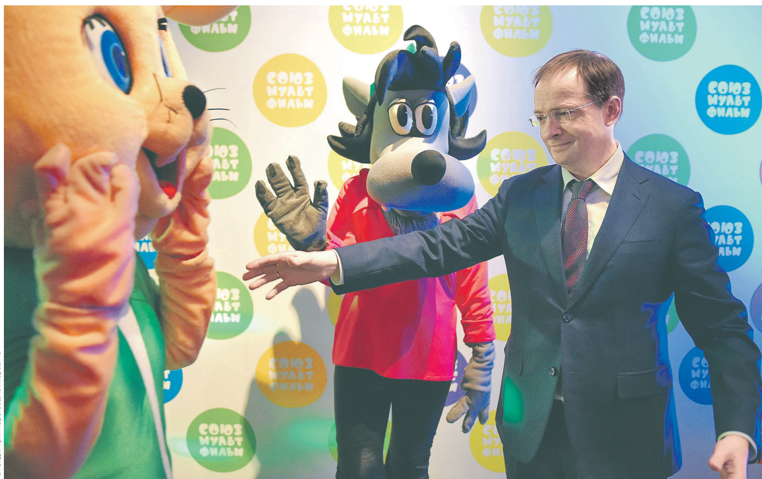
Глава Министерства культуры Владимир Мединский объясняет решения ведомства о переносе премьер зарубежных фильмов действиями в интересах российского кино

Под угрозой оказались минимум пять зарубежных фильмов, выход которых намечен на вторую половину декабря — начало января. Это, в частности, фантастический