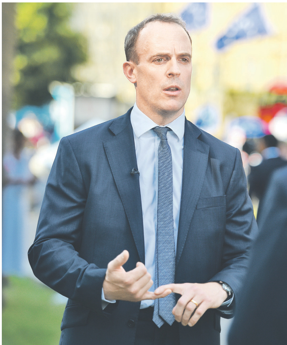
Новый глава МИД Британии Доминик Рааб известен тем, что в свое время инициировал принятие британского «Акта Магнитского», критиковал феминизм, а до начала политической карьеры работал в Гаагском трибунале