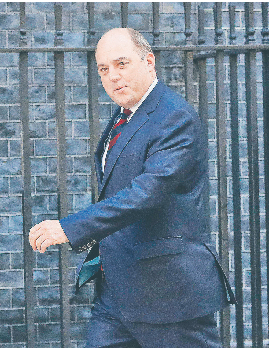
Не менее ожидаемым стало и назначение на должность министра обороны Великобритании Бэна Уоллеса, давнего соратника Бориса Джонсона и главу его избирательной кампании в 2016 году

и на какие вызовы министрам предстоит ответить — в материале РБК.