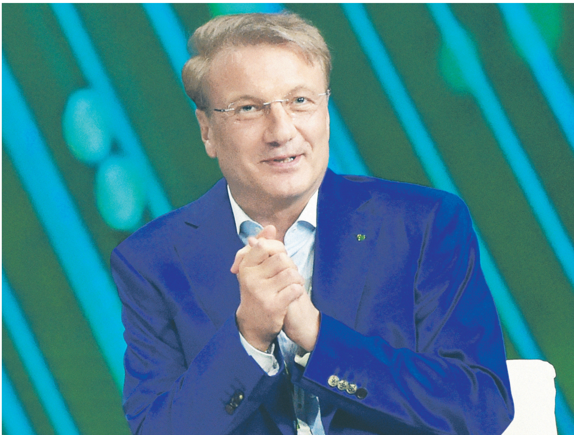
По словам главы Сбербанка Германа Грефа, в активе будущего СП быстрорастущие компании с высоким потенциалом, сильными управленческими командами и беспрецедентным охватом клиентов