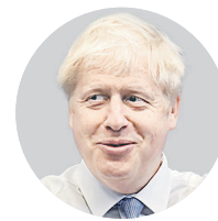
БОРИС ДЖОНСОН, премьер-министр Великобритании

Как масштабная перекройка кабинета министров новым премьером скажется на политике Великобритании