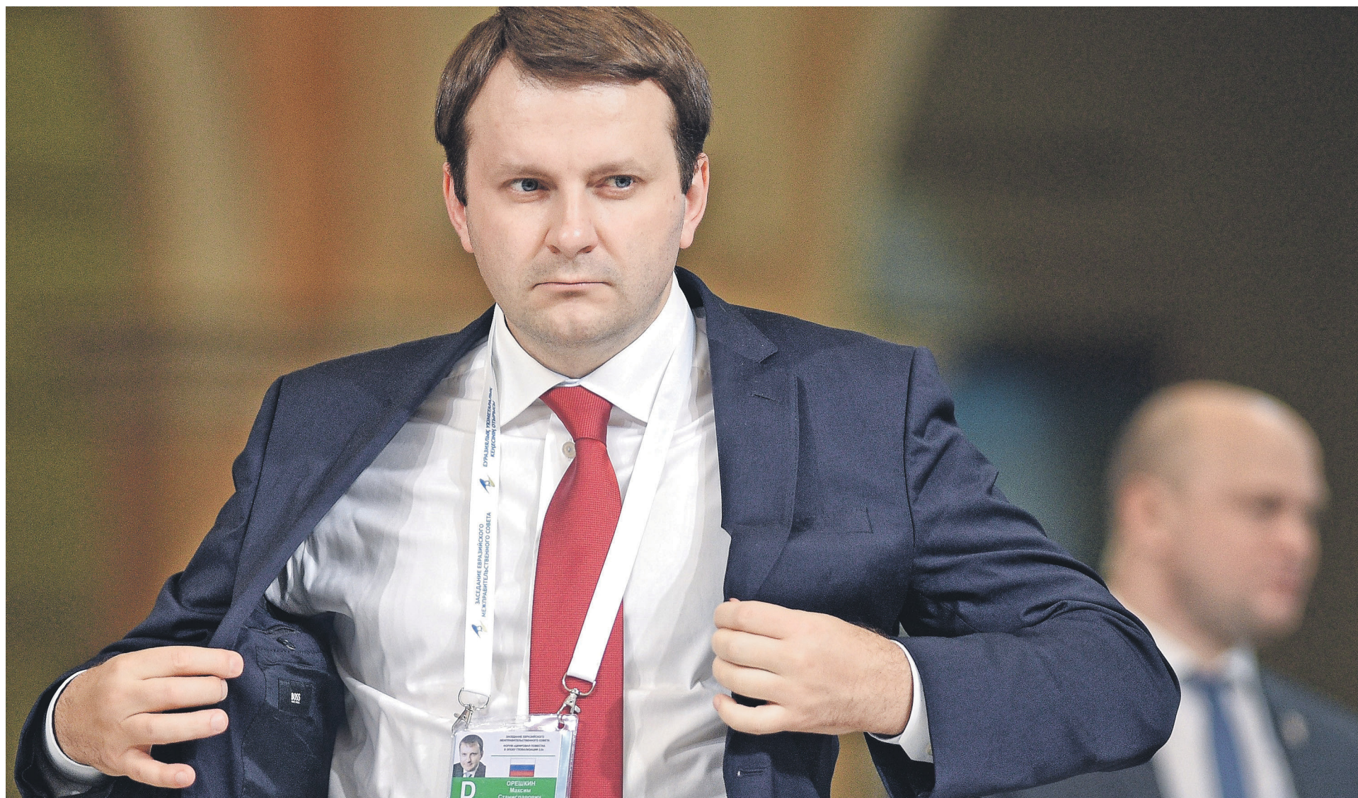
Глава Минэкономразвития Максим Орешкин заявил, что новые меры по улучшению делового климата упростят предприятиям «отстаивание своего честного имени»