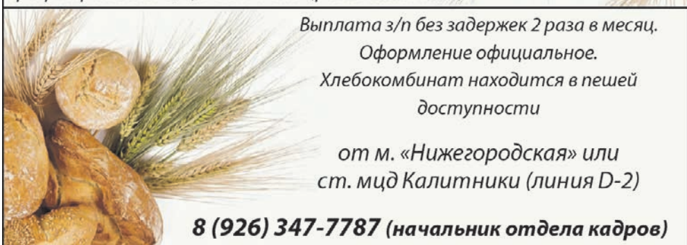
График работы 6/1, 03.00-11.00 (развозка хлеба)

в/у РФ кат. «В». З/п 70000 руб. на руки.