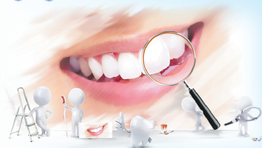
График работы с 9 до 21 ч.