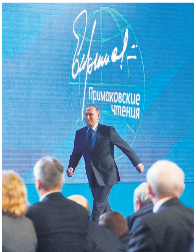
Владимир Путин прошел долгий путь в понимании личности Евгения Примакова

Выступил бывший генеральный секретарь НАТО, министр иностранных дел ЕС Хавьер Солана, по понятным причинам сосредоточившийся на международном аспекте деятельности Евгения Примакова, о котором рассказывал так же дотошно, как Владимир Фортов — о научном. Евгений Примаков, по признанию Хавьера Соланы, оставил в его сердце неизгладимый след (прежде всего это был,