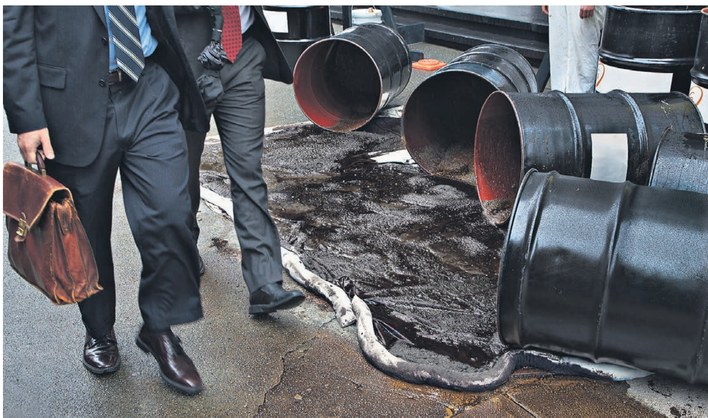
Решение ОПЕК о сокращении добычи может опустошить запасы нефти, накопленные за несколько лет

Члены картеля смогли серьезно удивить рынок, не только согласившись — впервые за восемь лет — сократить добычу нефти на максимальный предполагавшийся объем (на 1,17 млн баррелей, до 32,5 млн баррелей в сутки), но и пообещав сокращение еще на 0,6 млн баррелей в сутки со стороны стран, не входящих в ОПЕК. В итоге общее снижение может составить 1,8 млн баррелей в сутки, что значительно больше текущего профицита на рынке. Это значит, что должны начаться расхищения огромных запасов нефти, накопленные в 2015–2016 годах.