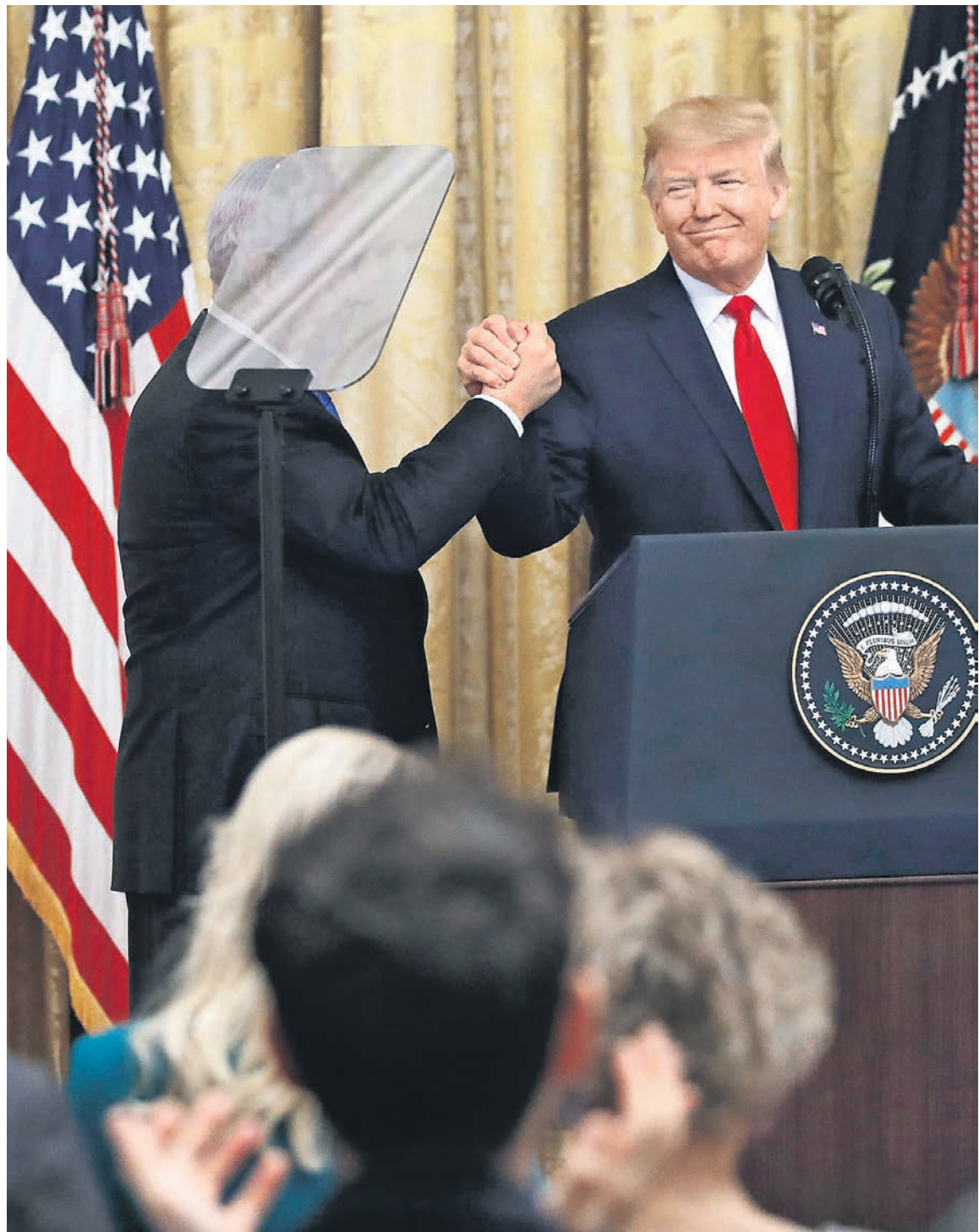
Предложив свое решение палестино-израильского конфликта, президент США Дональд Трамп проявил себя как «величайший друг Израиля»

Вчера президент США Дональд Трамп сделал решающий шаг к выполнению своего ключевого предвыборного обещания — войти в историю как миротворец, урегулировавший один из наиболее застарелых конфликтов на планете — между Израилем и Палестиной. Стоя плечом к плечу с израильским премьером Биньямином Нетаньяху, он раскрыл подробности «сделки века», сказав, что она выгодна как израильтянам, так и палестинцам. Биньямин Нетаньяху, назвавший главу Белого дома «величайшим другом Израиля», в четверг прилетит в Москву. Он расскажет об американском плане президенту РФ Владимиру Путину, рассчитывая, видимо, если не на его поддержку, то хотя бы на понимание. Впрочем, до сих пор Россия воспринимала инициативу с изрядной долей скепсиса. А палестинские лидеры вчера договорились совместно противодействовать «сделке века».