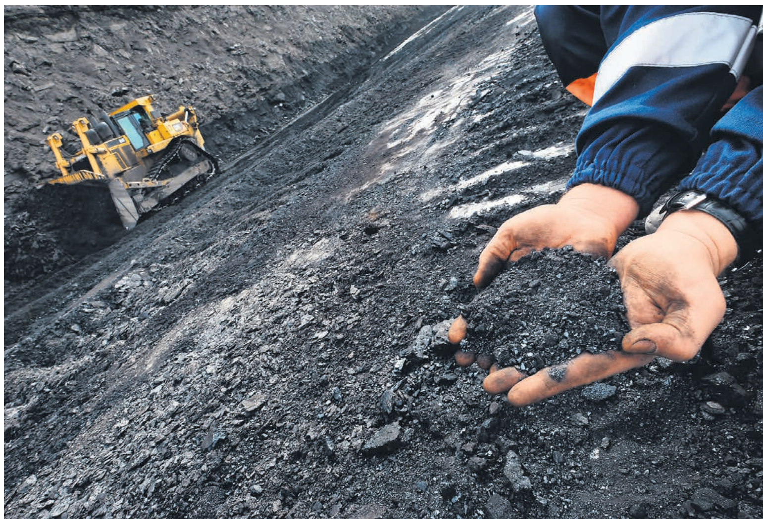
Тема наращивания экспорта угля на восток предстала в новом разрезе

В письме господин Сечин просит президента «обратить внимание руководства ответственных ведомств и транспортных монополий на важность безусловного выполнения решений», принятых комиссией по ТЭКу в августе 2018 года на совещании в Кемерово (см. «Ъ» от 26 июля и 28 августа 2018 года). Тогда, пишет господин Сечин, было поручено расширить Восточный полигон так, чтобы он пропускал на восток 195 млн тонн российского угля к 2025 году, из них не менее 100 млн тонн в направлении портов Приморского края и не менее 85 млн тонн на Ванино-Совгаванский узел. Отметим, что в других документах настолько амбициозные цифры не содержатся: