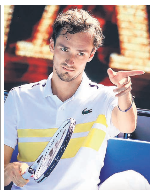
Даниил Медведев: «Десять титулов в 25 лет — очень хорошее достижение, о котором в детстве я мог только мечтать»

— Насколько мячи и покрытие в Марселе отличались от тех, которые использовались в Роттердаме и вызвали там вашу критику?