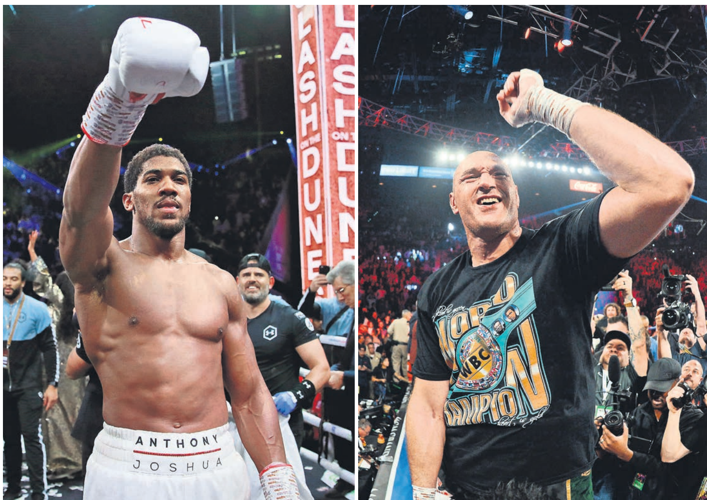
Бой между Энтони Джошуа (слева) и Тайсоном Фьюри станет первым в истории супертяжелого веса, на кону в котором будут все четыре значимых чемпионских пояса.

Энтони Джошуа и Тайсон Фьюри договорились о двух поединках за звание абсолютного чемпиона в супертяжелом весе