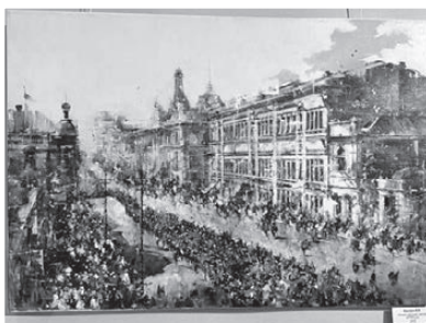
Работы посвящены борьбе с фашизмом и Сталинградской битве.

Организаторами стали администрация Владивостока, правительство Приморья, общественная организация «Сильная Россия» и советы почетных жителей столицы Приморья и края. - А мы, Приморское отделение