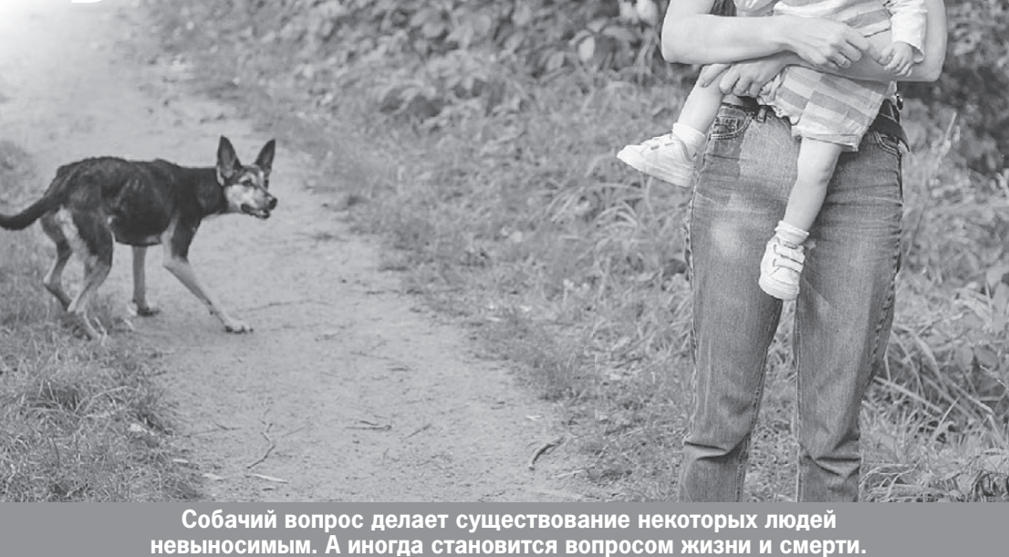
Собачий вопрос делает существование некоторых людей невыносимым. А иногда становится вопросом жизни и смерти.

потому что один человек может ошибаться.