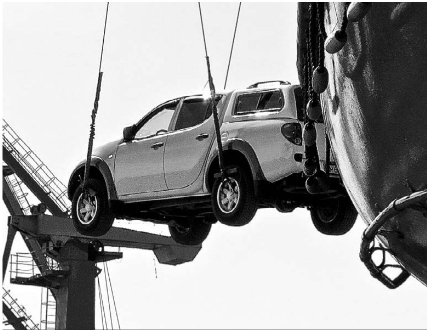
Дальневосточник без подержанной иномарки как без рук.

Мы спросили продавцов о том, какие машины сейчас в почете у дальневосточника со средним бюджетом. Публикуем срез цен на популярные модели на б/у рынке.