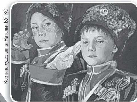
Картина художника Натальи БУТКО