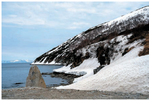
Телеграмканал Сергея НОСОВА