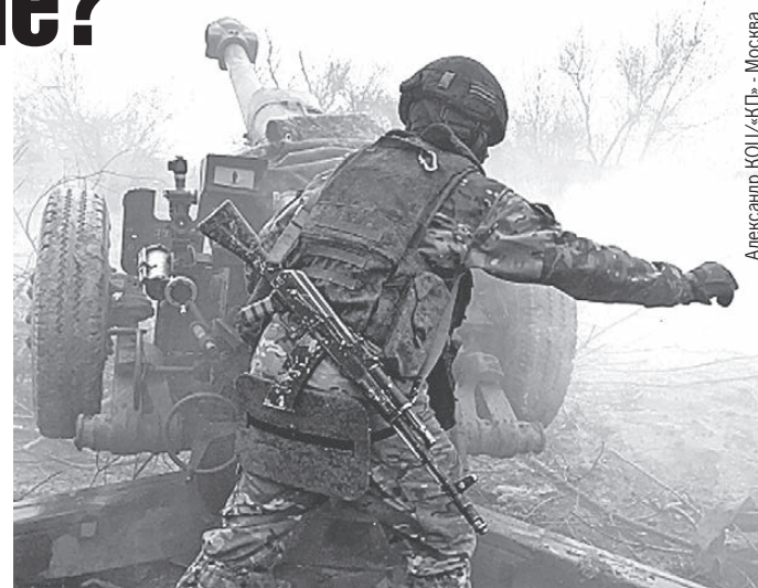
Интенсивность артогня в Артемовске была невероятной.

А пока, в день освобождения Мариуполя, Бахмут опять стал Артемовском.