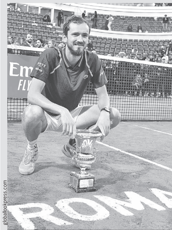
Даниил Медведев выиграл 20-й титул в карьере и заработал в Риме 1,1 млн евро.

28 мая стартует «Ролан Гаррос». Король грунтовых кортов 36-летний Рафаэль Надаль из-за травмы снялся со своего любимого турнира, где он победил 14 раз (!), а значит, трон свободен. Учитывая, что Медведев наконец-то заиграл на грунте, у него есть хорошие шансы повторить свой римский успех в Париже.