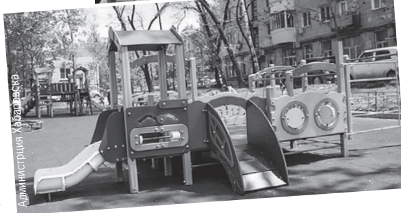
Жители домов 117, 119 и 121 по Фрунзе высоко оценили качество покрытия и установленные объекты для детей.

с учетом ливневых лотков. В этом году будет произведен текущий ямочный ремонт, который позволит дачникам эксплуатировать спуск, - поделился планами мэр.