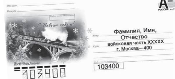
Как правильно подписывать конверт.

- Писать личное письмо бойцу проще от руки, а не печатать в телефоне. Да и другой связи с родными у военнослужащих нет. Близкие люди обязательно напишут в ответ. И чем длиннее будет письмо из дома, тем спокойней бойцу, - прокомментировали в пресс-службе ВВО.