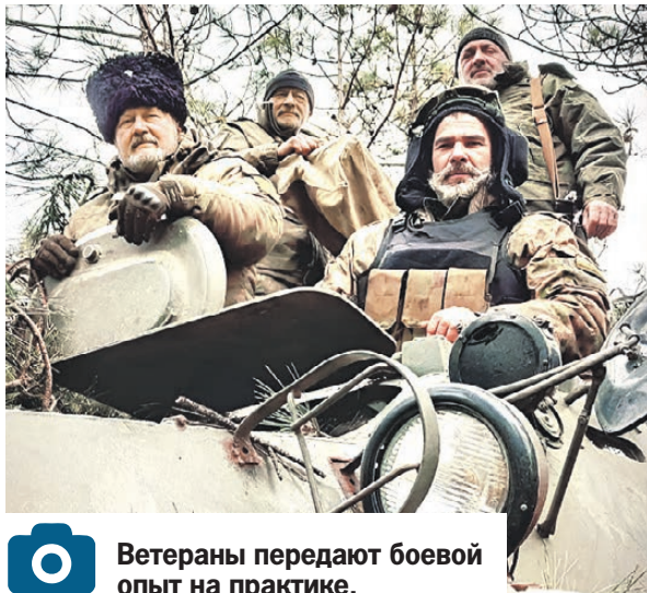
Ветераны передают боевой опыт на практике.

- Претерпели изменение и дополняются в основном пункты Стратегии, связанные с несением казаками государственной и иной службы и патриотическим воспитанием под-