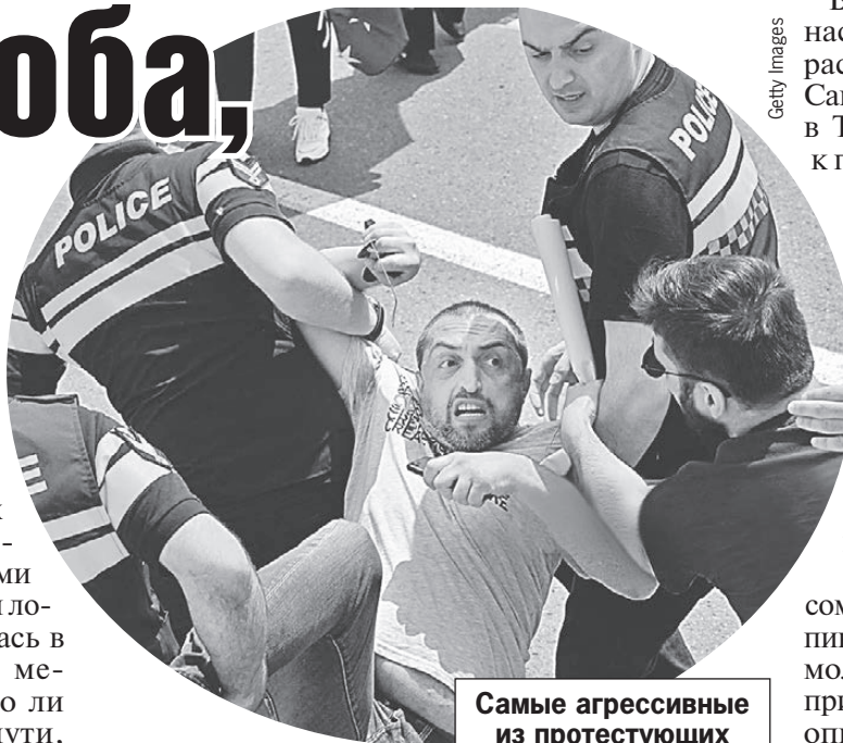
Самые агрессивные из протестующих до аэропорта им. Руставели не добрались.

Те, кто приветствует изменения, тоже были в аэропорту. Но вели себя тихо. А вот противники устроили шоу: хотя автоколонна не доехала, но пешеходы, завернувшие в украинские и грузинские флаги, с транспарантами и свистками прибыли аккурат к посадке самолета. Полиция эту группу человека в 200 остановила. Но свист и антирос-