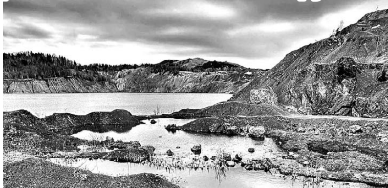
Бирюзовое озеро стоит того, чтобы идти до него пешком восемь километров.

- Снимите видео про свое прохождение маршрута и станьте участником