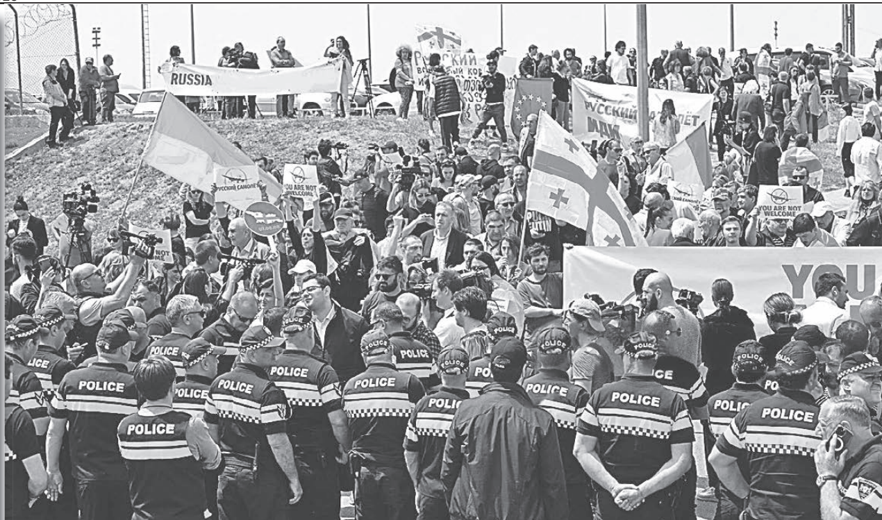
Не более 200 - 300 человек с флагами Грузии, Украины и антироссийскими лозунгами добрались пешком из Тбилиси до аэропорта, в здание которого их не пустила полиция.

Как Грузия встретила первый после 4-летнего перерыва самолет из России. Спецкор «КП» с трудом просочилась в аэропорт Тбилиси, где порадовалась спокойствию полицейских, порадовалась за пассажиров и нарвалась на хамство местных журналистов.