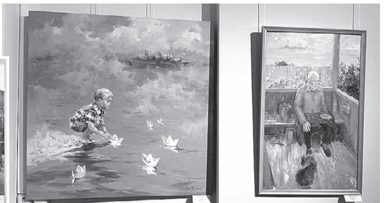
Мероприятие поддержало Приморское отделение Союза художников.

Союза художников России, разумеется, поддержали столь благородную и важную иници-