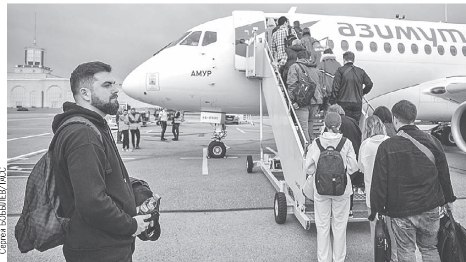
Пассажиры самолета Super Jet 100-95B «Амур» российской компании «Азимут» в Москве не ждали, что в аэропорту Тбилиси не все будут им рады.