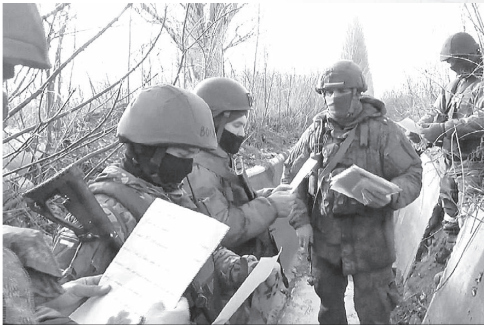
Бойцы читают послания сразу и делятся друг с другом самыми трогательными строчками.

Дальше отправления сдаются в обменные пункты ФПС группировок