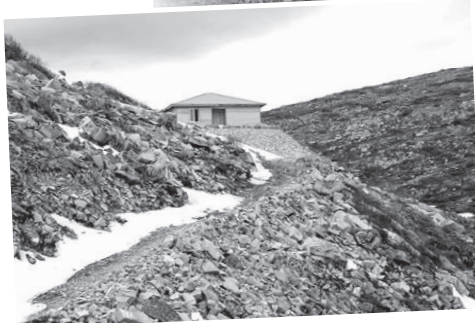
Курорт на острове Завьялова - очень перспективный проект.

бы, чтобы такие инициативы были успешными. Этот пример послужит стимулом, чтобы в туризм вкладывались и другие инвесторы, - сказал Юрий Трутнев.