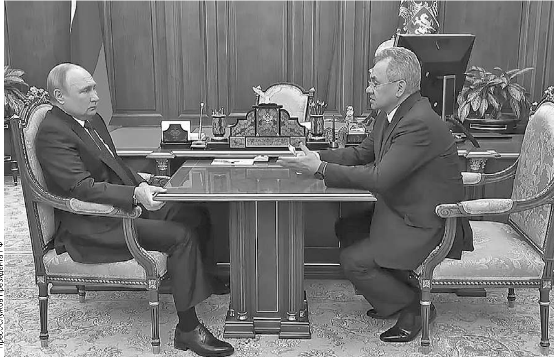
Владимир Путин попросил министра обороны передать благодарность войскам и подумать, как увековечить память героев спецоперации на Украине.

Сейчас Мариуполь под полным контролем Российской армии, а завод «надежно за-