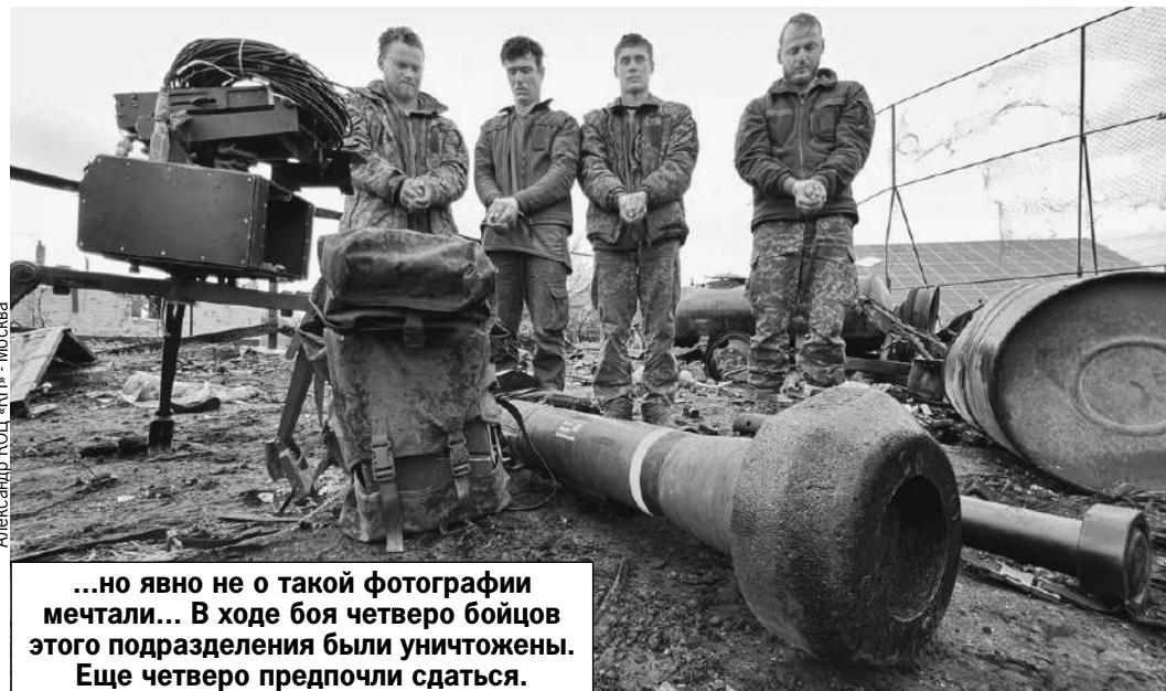
Александр КОЦ/«КП» - Москва