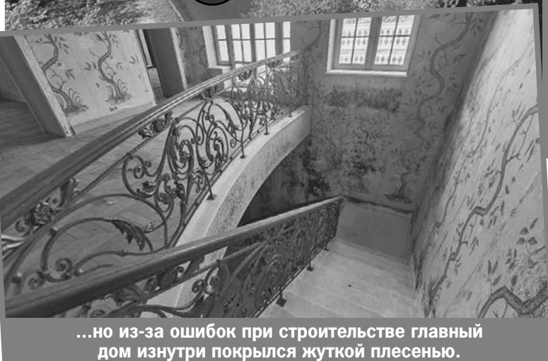
...но из-за ошибок при строительстве главный дом изнутри покрылся жуткой плесенью.

можно пройти к участку. Там, правда, упираешься в глухой пятиметровый каменный забор, обвешанный камерами. Перед тобой ворота и стоящий окнами на улицу дом прислуги (400 квадратных метров + гараж на четыре машины).