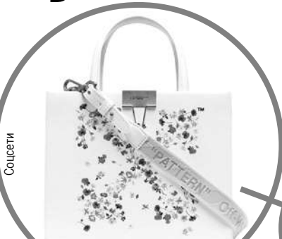
Эта итальянская сумочка стоит по гламурным меркам не так уж и дорого - примерно 100 тысяч рублей.

деоролик, на котором запечатлена та самая вилла. По самым скромным оценкам, площадь жилища составляет около 1000 квадратных. По некоторым данным, за недельную аренду подобного дома придется выложить сумму, эквивалентную примерно двум миллионам рублей.