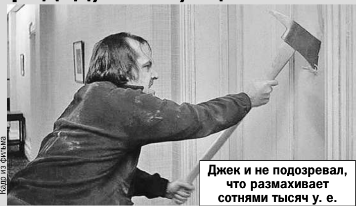
Джек и не подозревал, что размахивает сотнями тысяч у. е.