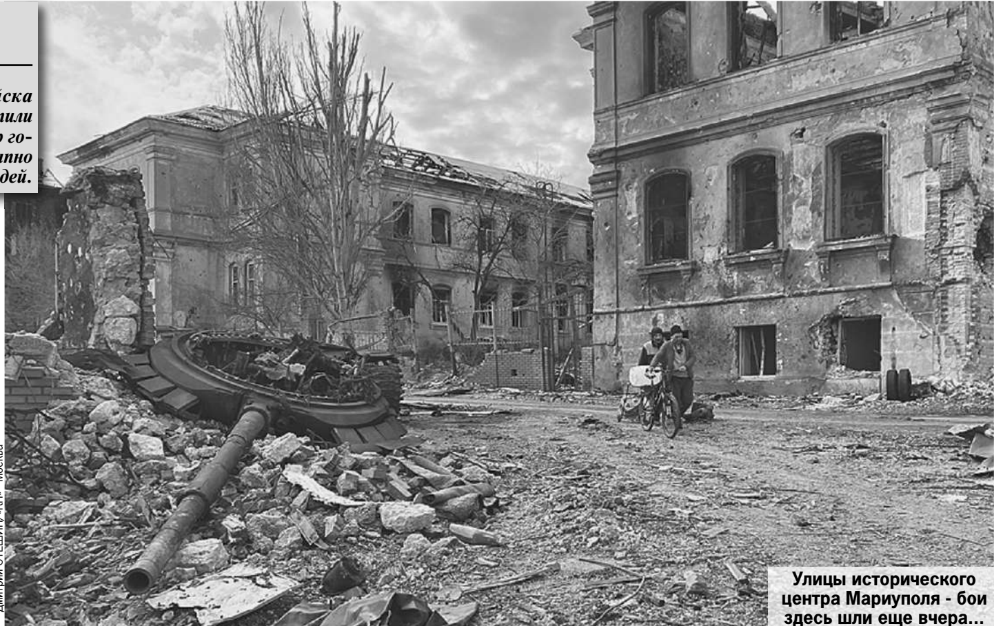
Улицы исторического центра Мариуполя - бои здесь шли еще вчера...

Спрашиваю, что за люди. Татьяна показывает: этот чиновник, тот -