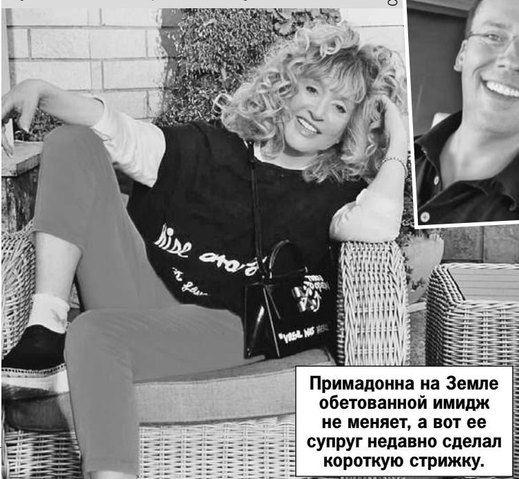
Примадонна на Земле обетованной имидж не меняет, а вот ее супруг недавно сделал короткую стрижку.