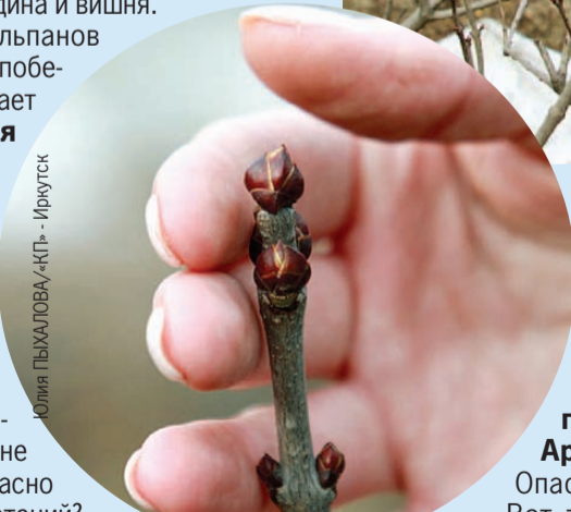
Юлия ПЫХАЛОВА, «КП» - Иркутск