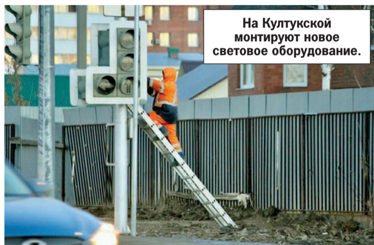
На Култукской монтируют новое световое оборудование.

Напомним, что капитальный ремонт улицы Култукской выполняется в рамках национального проекта «Безопасные и качественные автомобильные дороги». Он включает строительство сети ливневой канализации, станции очистных сооружений, перекладку всех подземных сетей, укладку нового асфальта и благоустройство территории.