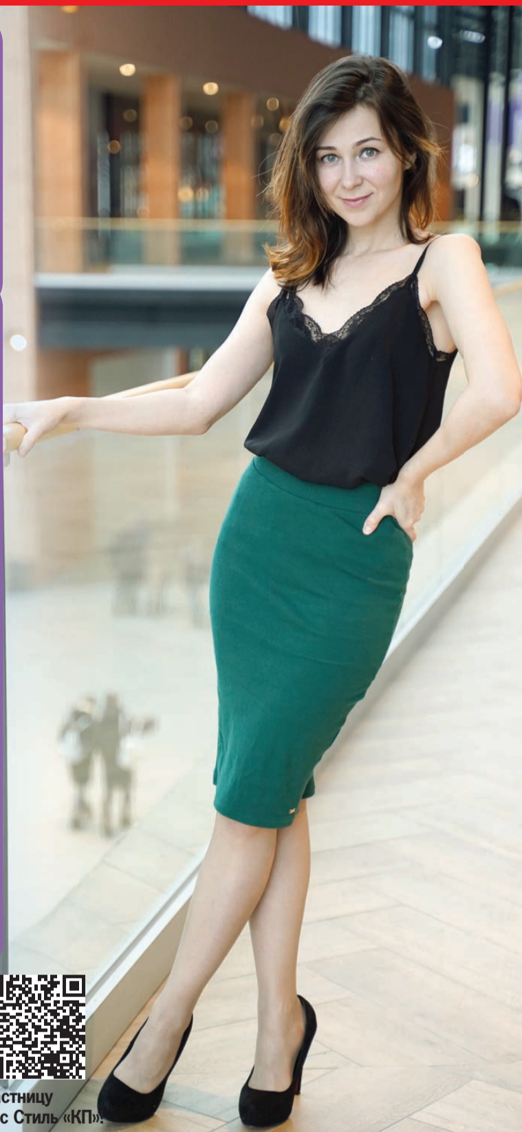
Светлана МАКОВЕЕВА/«КП» - Самара