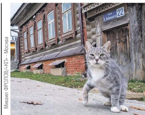
Михаил ФРОЛОВ «КП» - Москва

Квартиры сибиряки используют как способ вложения денег. Читайте на стр. 2 ▶