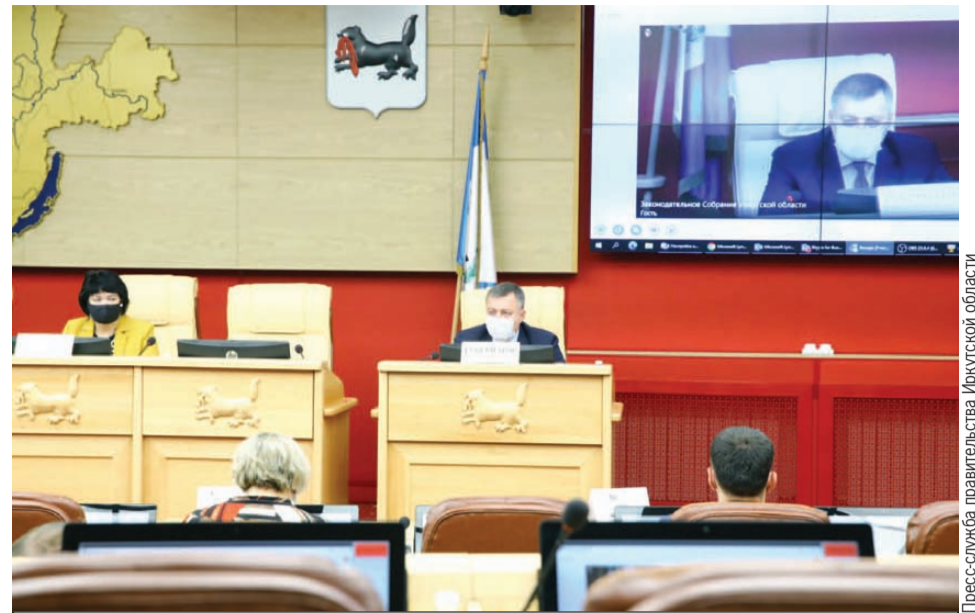
Глава региона подчеркнул, что в больницах не хватает коек для больных коронавирусной инфекцией.

В настоящее время особое внимание уделяется обеспечению бесплатными лекарствами больных, которые лечатся на дому. По поручению Президента России Владимира Путина регионам на эти цели выделены средства из федерального бюджета. Иркутской области перечислено почти