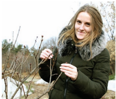
Юлия ПЫХАЛОВА «КП» - Иркутск