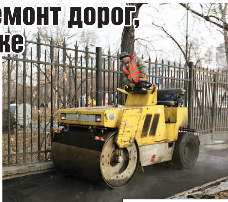
Пресс-служба администрации Иркутска

кали в сточные колодцы. - На Ядринцева, как и на улице Култукской, проводилась замена подземных коммуникаций. В связи с этим сместились сроки сдачи объекта. Подрядчик обещает закончить все работы в течение 3 - 5 дней, в зависимости от погодных условий. После этого начнется процедура приемки улицы. Однако открыть сквозной проезд между Советской и Ядринцева планируется уже 16 ноября, - сообщил исполняющий обязанности заместителя мэра - председателя комитета город-