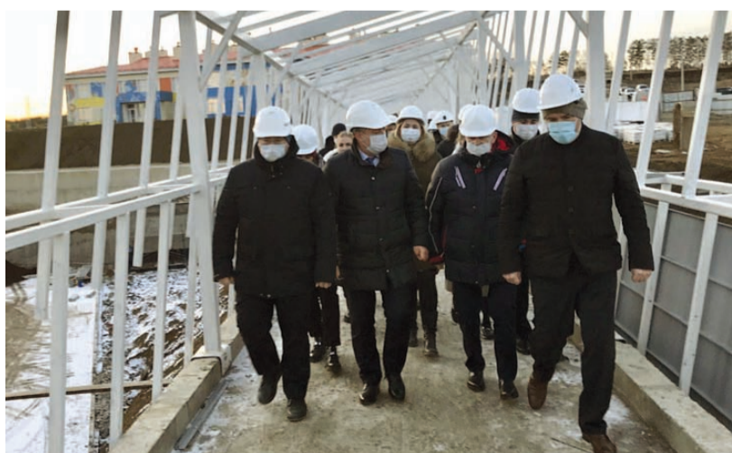
Игорь Кобзев заявил, что в следующем году в новом учреждении образования начнется учебный процесс.

На этот раз во время инспекционной поездки губернатор осмотрел актовый и спортивный залы, два бассейна, столовую. Здесь идут отделочные работы. Они выполнены на 80%. Также специалисты завершают отделку фасада, занимаются благоустройством территории. Каждый день на объекте трудится 280 человек. В течение недели количество работников планируют увеличить до 320. Специалистам помогают 54 бойца студенческих строительных отрядов.