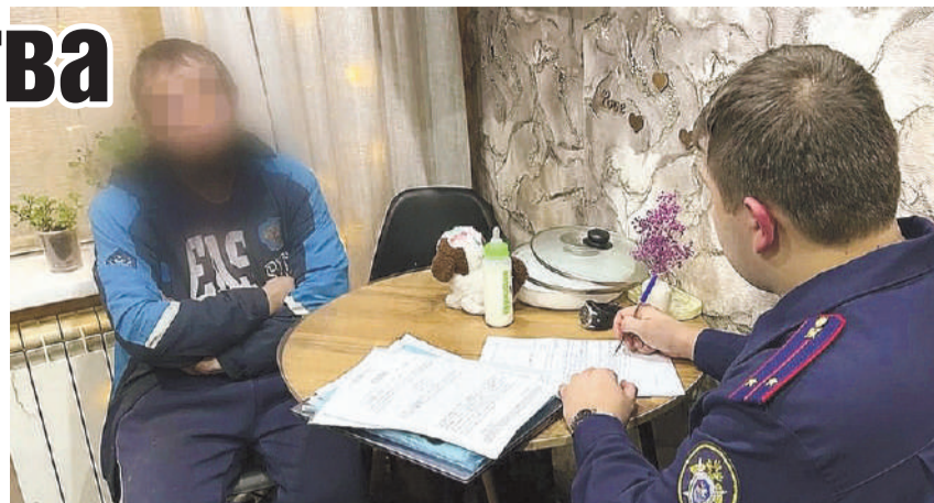
Узнав, что жертва намеревается продать недвижимость, подозреваемые неделю держали ее в заложницах.

Обратив внимание, что женщина в неадекватном и болезненном состоянии, фермер привез ее в