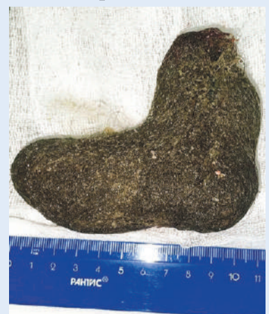
Вот такой «валенок» извлекли доктора.

Трихобезоары обычно обнаруживают в желудке, а у 10% больных - в тонком кишечнике. Как говорят врачи, появление безоаров - проблема обычно психоло-