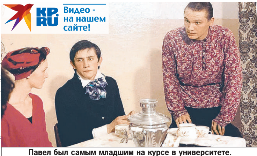
Павел был самым младшим на курсе в университете.