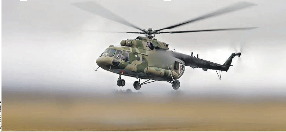
Вертолет, который пытались угнать украинские спецслужбы, - уникальный. Он и глушит все сигналы врага, и ретранслирует нашу связь, а еще и ведет разведку.

жена с детьми, должна была переехать за границу. Далее их должны были переправить в Кишинев, а оттуда забирать бы машинами».