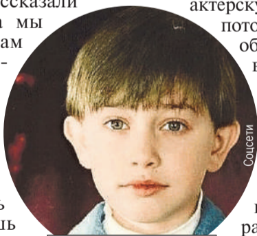
Будущий актер учился в бердской школе.