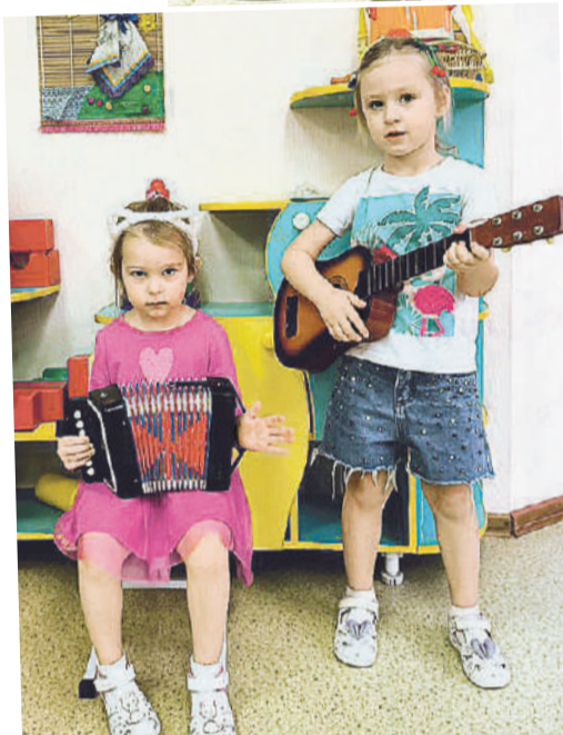
Наставник старается развивать таланты каждого ребенка.

Но в целом все прошло благоприятно. Мы договорились. Думаю, все довольны друг другом.