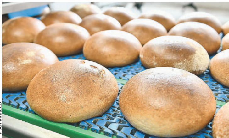
Продукт очень полезен, способствует укреплению иммунитета.

Омского ГАУ. В 2021 году университет выиграл грант Правительства РФ в размере 90 миллионов рублей для поддержки научных исследований по повышению пищевой ценности этой культуры. Ученые задались целью вернуть зерну полезные свойства, утраченные в процессе «окультуривания».