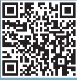
Фото присылайте в «Комсомольскую правду», e-mail: miss@kp.ru

Голосуйте за понравившуюся вам участницу на нашем сайте KP.RU в разделе «Будь стильной с «КП»!