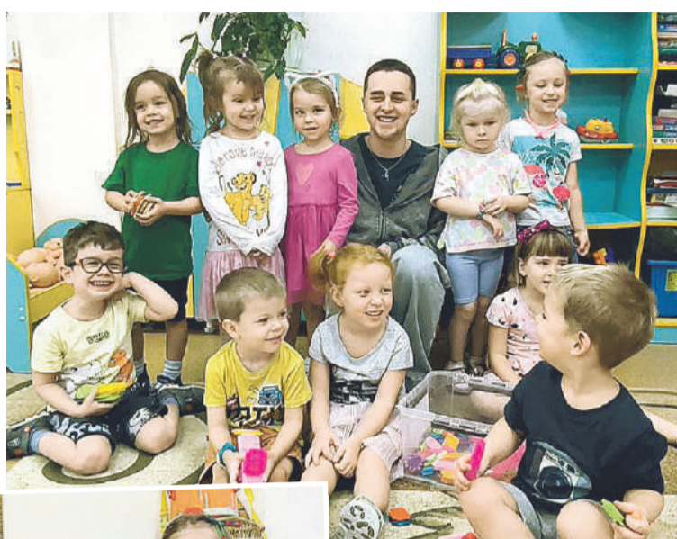
С детьми проводит семь часов в день, у него в группе больше двадцати ребят.