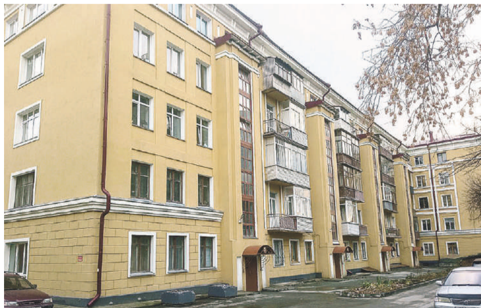
Дом артистов на улице Романова, где жил Мессинг.

Однако факт есть факт: Константин Ковалев на подаренном самолете сбил 33 немецких аса. Говорят, немцы приходили в ужас от одного только имени Мессинга, которое алыми буквами было выведено на фюзеляже.