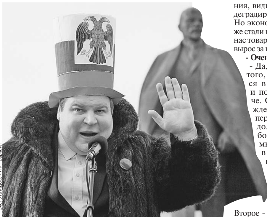
На выборы в России идут и коммунисты, и капиталисты, причем иногда сложно разделить одних от других... Но как будет жить народ - зависит от новой экономической стратегии страны.

- Мы создаем условия для роста, а дальше ждем - будет он или нет. Он может быть большим, как в Китае. А может оказаться умеренным, как сейчас. И вот тогда, если рост будет слабым, если мы не рванем, мы отстанем навсегда.