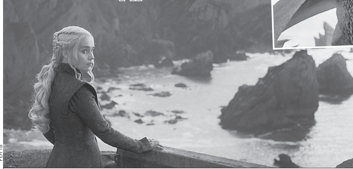
Дейенерис ждут как новые союзники, так и новые потери.

о себе знать конфликты, назревавшие шесть лет - все это заставит героев сериала двигаться и действовать намного быстрее.