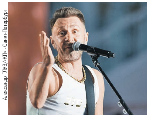
Александр ГЛУЗ/«КП» - Санкт-Петербург

Ударники новогоднего труда: Больше всех заработали Шнур и Светлана Лобода