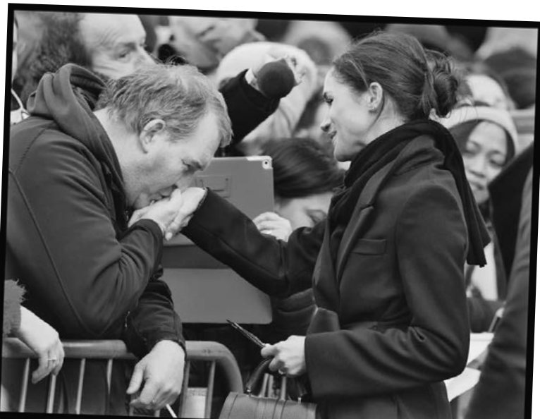
В Кардиффе поклонники будущей принцессы целуют ей руку. Это, конечно, целомудреннее, чем селфи, но вдруг тоже попрание всех приличий?

Сила солому ломит, похоже. И в гардеробе у звезды сериала «Форс-мажоры» стала появляться строгая классика, Меган начала внимательнее относиться к предложениям режиссеров и продюсеров - например, отказалась стать новой девушкой Джеймса Бонда.