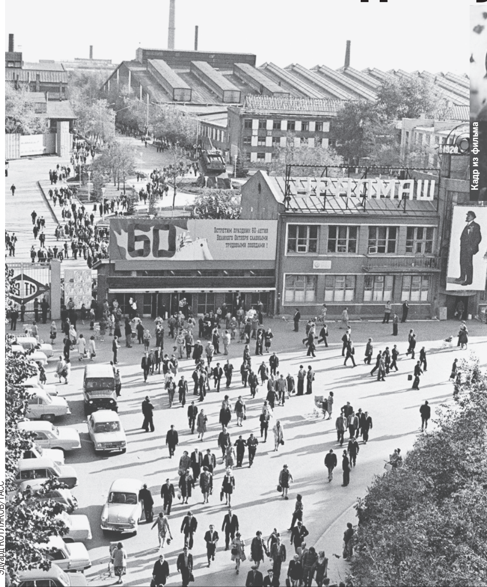
Три раза в сутки через главную проходную «Уралмашзавода» проходят тысячи людей: огромное предприятие работало безостановочно.