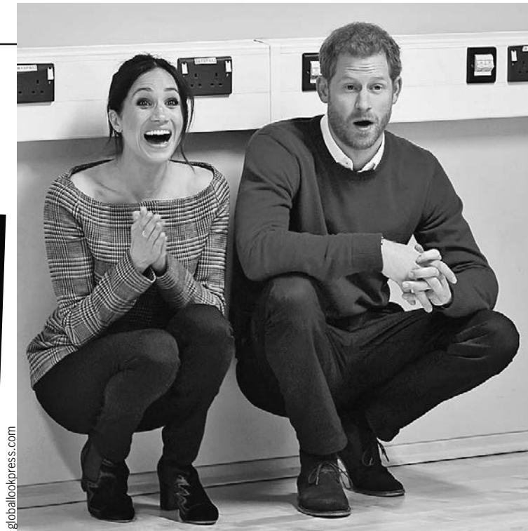
А это Гарри и Меган посетили танцевальный класс. Со стороны все казалось весьма демократичным. До сих пор.

Но вот по голливудской привычке нарушила один из королевских запретов: на мероприятии Welsh Culture Festival дала автограф маленькой девочке. Казалось бы, что здесь плохого? Но нет, по протоколу мисс Маркл должна была бы ответить вежливым отказом.