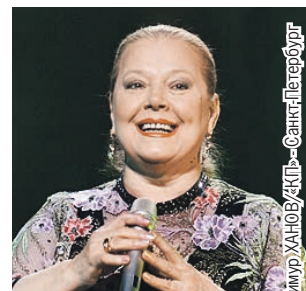
Тимур ХАНОВ/«КП» - Санкт-Петербург

Певица жила в большом доме под Петербургом в поселке Солнечное. Вокруг сосновый лес, рядом два больших озера. Цена этого двухэтажного дома в элитном поселке в Курортном районе Петербурга вместе с шестью сотками земли - до 20 млн. рублей. В Питере у Сенчиной осталась