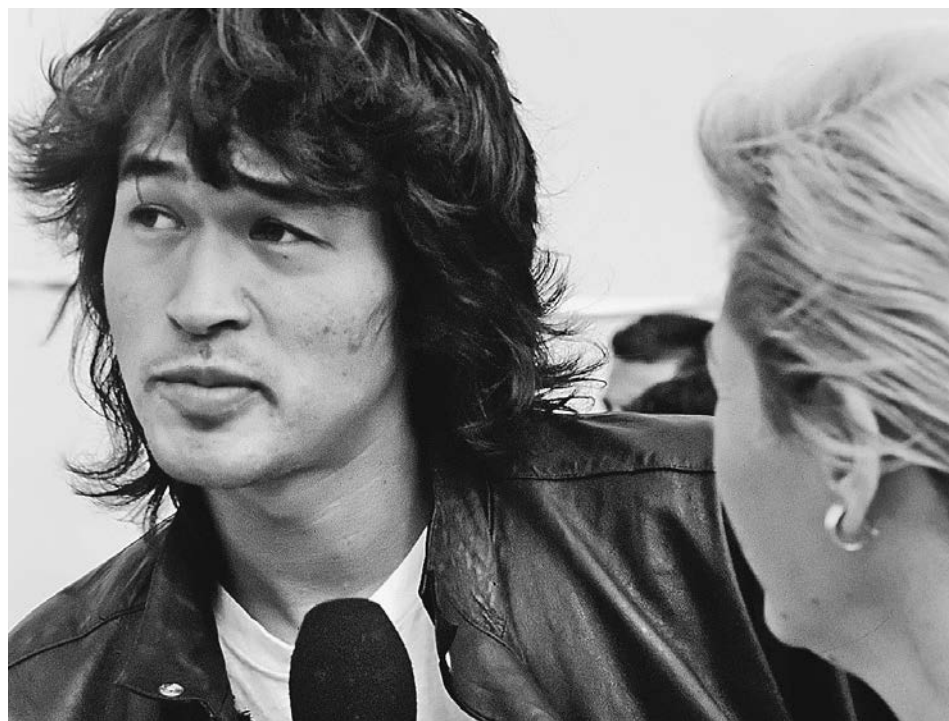
А когда-то Виктор Цой был желанным гостем на Украине. Это он на кинофестивале «Золотой Дюк» в Одессе в 1988 году.

У товарищей с майдана, когда они слушают Высоцкого, начинаются фантомные боли. 19 февраля 2014 года «Беркут» с молодыми везниками согнали на майдан «революционеров», которые до этого сжигали, уничтожали, провоцировали. Я помню эту ночь. Когда эти товарищи с майдана жгли костры и танцевали свои ритуальные танцы, они были