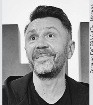
Евгения ГУСЕВА/«КП» - Москва

Толкую сны, читаю между строчек, Плюю, естественно, в ответственные лица: Когда нет своего, чужой шнурочек Мешает кушать, спать или молиться. Им волю дай, они всем оторвут, Чтобы повсюду царствовали попы. Отвечу я и не сочту за труд, - Ты не пророк, чувак, мы не холопы.