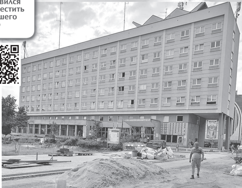
Некогда процветающая и, не побоюсь этого слова, великая Легница превратилась в депрессивный, забытый Богом и властями городишко, где пытаются лишь латать дыры, чтобы он не умер совсем.

Город был поделен на две части: советскую и польскую. В апреле 1946 года в Легнице проживало 16 700 поляков, 12 800 немцев и 60 000 совет-