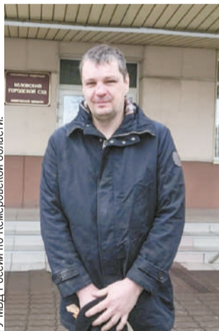
ГУ МВД России по Кемеровской области.

И тогда мужчина начал выражаться нецензурной бранью, бить ногами и головой по дверям и кузову городского транспорта, угрожать избиением, требуя немедленного отправления. В результате дебошир нанес повреждение двум автобусам. Люди, к счастью, не стали