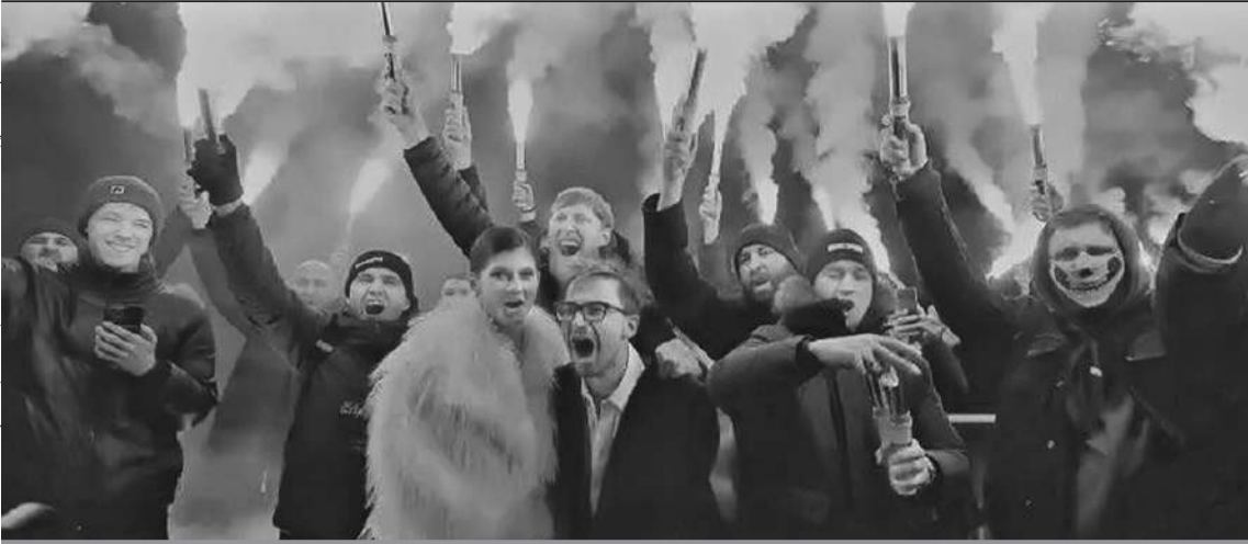
Фанаты «Спартака» высыпали из автобуса и зажгли фейеры, что сделало праздник еще больше похожим на кино.