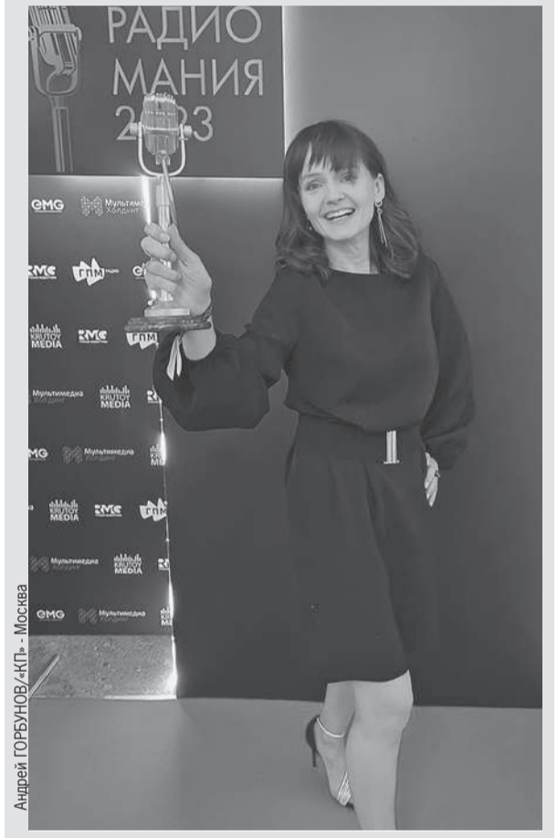
Андрей ГОРБУНОВ/«КП» - Москва

Если вы вдруг еще не слушаете новости на Радио «КП», то самое время настроить свои приемники или слушать на сайте FM.KP.RU и лично убедиться, за что профессионалы так ценят наши новости.