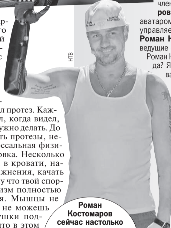
Роман Костомаров сейчас настолько популярен, что его быстро узнали под аватаркой Железного Дровосека.