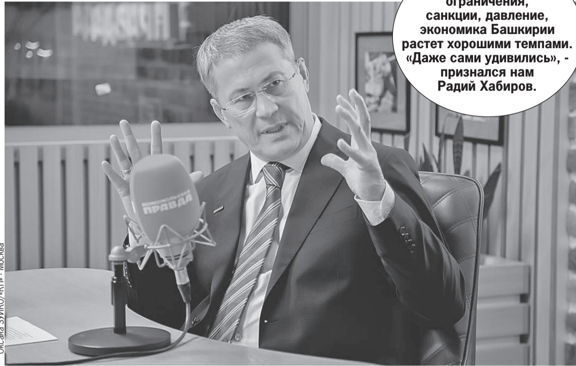
Оксана ЗУЙКО/«КП» - Москва

- Я сформировал для команды три направления. Это поддержка вооруженных сил в СВО (призыв, мобилизация, формирование помощи Минобороны, выполнение гособоронзаказа). Это поддержка участников СВО и их семей - мы делаем все, для того чтобы наши ребята вернулись живыми и здоровыми - поставляем им пилот-материалы, чтобы они укрепили свои оборонительные сооружения, беспилотники, строительную технику, медицину. Я, провожая ребят,