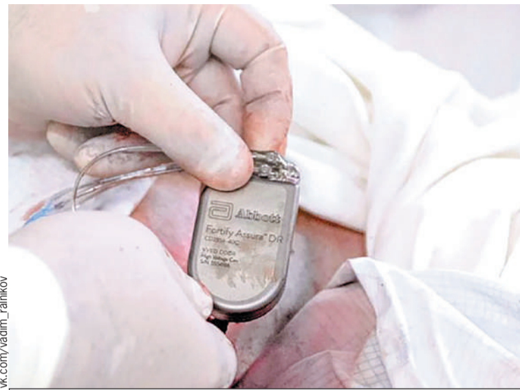
Процесс установки ИКД – ювелирная работа.