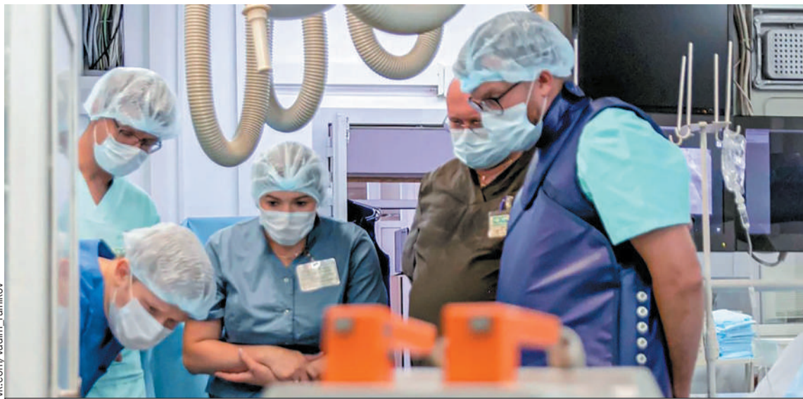
Операция прошла успешно, пациент сможет вернуться к полноценной жизни.