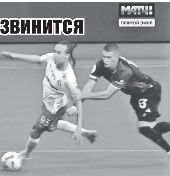
МТЧ! ПРЯМОЙ ЭФИР

- Переживаю, что придется обидеть «Оренбург».