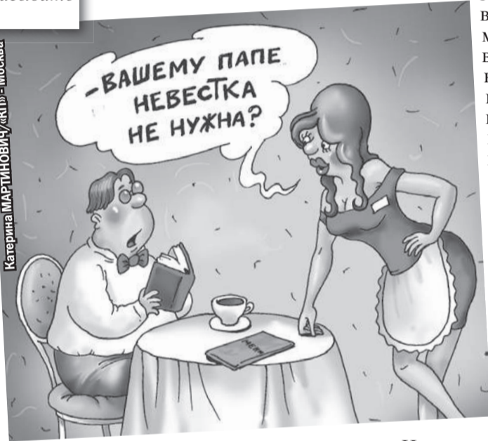
Катерина МАРТИНОВИЧ/«КП» - Москва

4 На работе временно зайтишь, зависаю в соцсетях. Стучится в друзья какой-