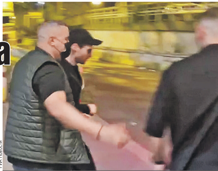
Выйдя из-под ареста, Павел Дуров (на фото он в черной кепке) на вопросы журналистов отвечать отказался и быстро прошел в поджидавшую его машину.

Руководство мессенджера, написало Politico, якобы «отказалось сотрудничать» с