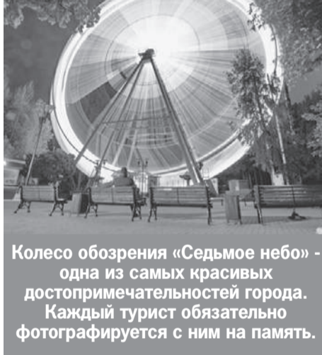
Колесо обозрения «Седьмое небо» - одна из самых красивых достопримечательностей города. Каждый турист обязательно фотографируется с ним на память.

«В республике сильные традиции борьбы, это связано и с национальной борьбой курэш, - рассказывал в одном из интервью Радий Хабиров. - И поскольку я сам из этой среды вырос, лукавить не буду, она является частью моей жизни, буду пропагандировать борьбу. Давать дополнительные возможности заниматься спортом».