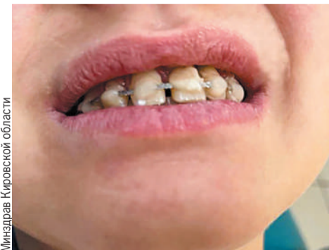
Могло показаться, что зубы сломаны. Но только на первый взгляд.