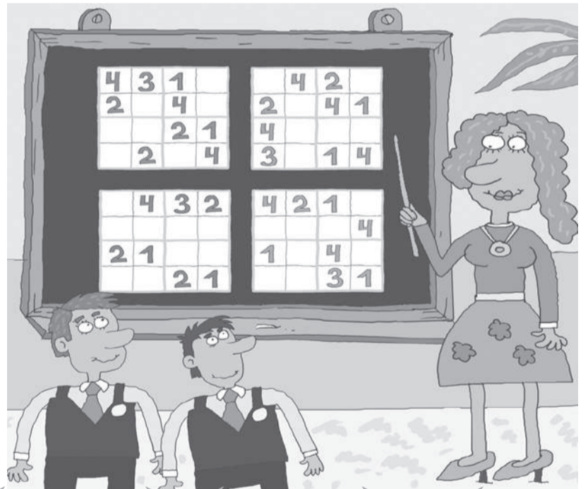
Рисовал Сергей БЕЛОЗЁРОВ.

Артём Неостроумов и Кирилл Тугодумов летом дополнительно занимались в математическом кружке. Реши с приятелями sudoku: впиши в свободные клетки числа от 1 до 4 так, чтобы в каждом горизонтальном и вертикальном рядах, а также в маленьких квадратах эти числа не повторялись.