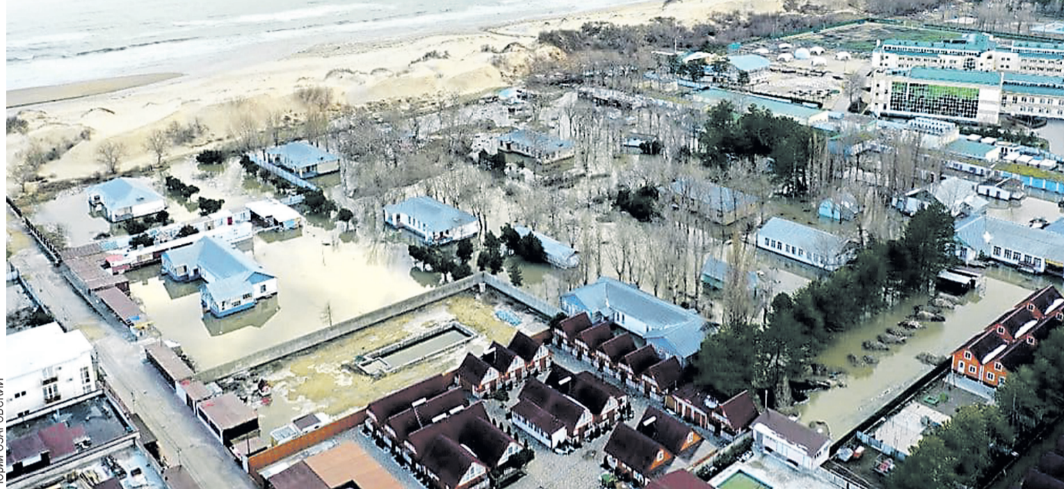
В Анапе из-за таяния снега подтопило несколько улиц.

Активно тает снег и в Краснодаре. Гигантские лужи, больше похожие на мини-водоемы, образовались там,