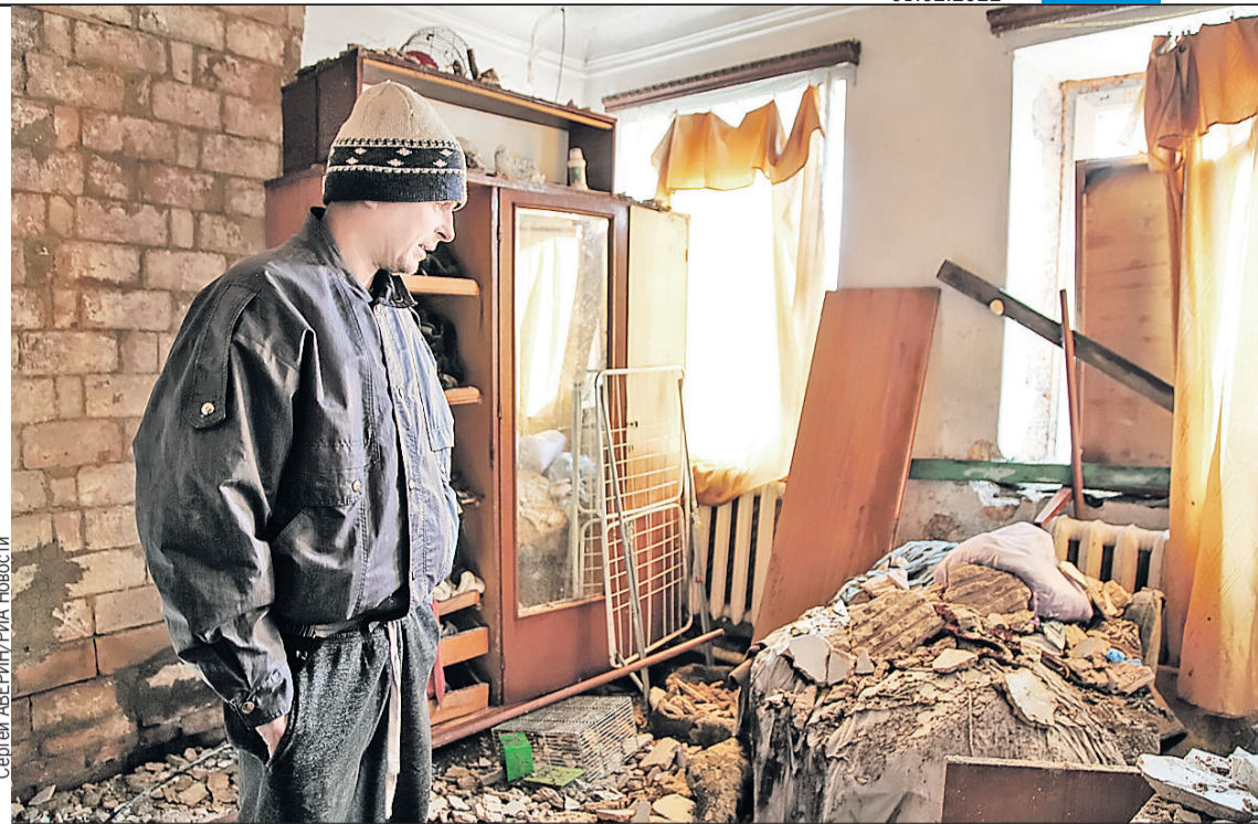
На Украине сейчас из каждого утюга вещают о грядущем «российском вторжении», а ВСУ между тем продолжают методично обстреливать города и поселки ДНР и ЛНР. Диалог с республиками Киев вести не желает. На фото: житель Донецка в своем доме на улице Дружбы, в крышу которого попал снаряд.

Сергей Лавров: - Президент отвечал на этот вопрос: если Зеленский хочет обсуждать нормализацию двусторонних отношений, страдающих от действий его режима, мы готовы - пожалуйста, пусть приезжает в Москву, в Сочи, в Петербург. Но если он хочет обсуждать Донбасс, идите, пожалуйста, в контактную группу, в которой должны напрямую рассматриваться все вопросы урегулирования между Киевом и Донецком, Киевом и Луганском. А когда он заявляет, что не будет с ними разговаривать, это плохо для внутриукраинского кризиса.