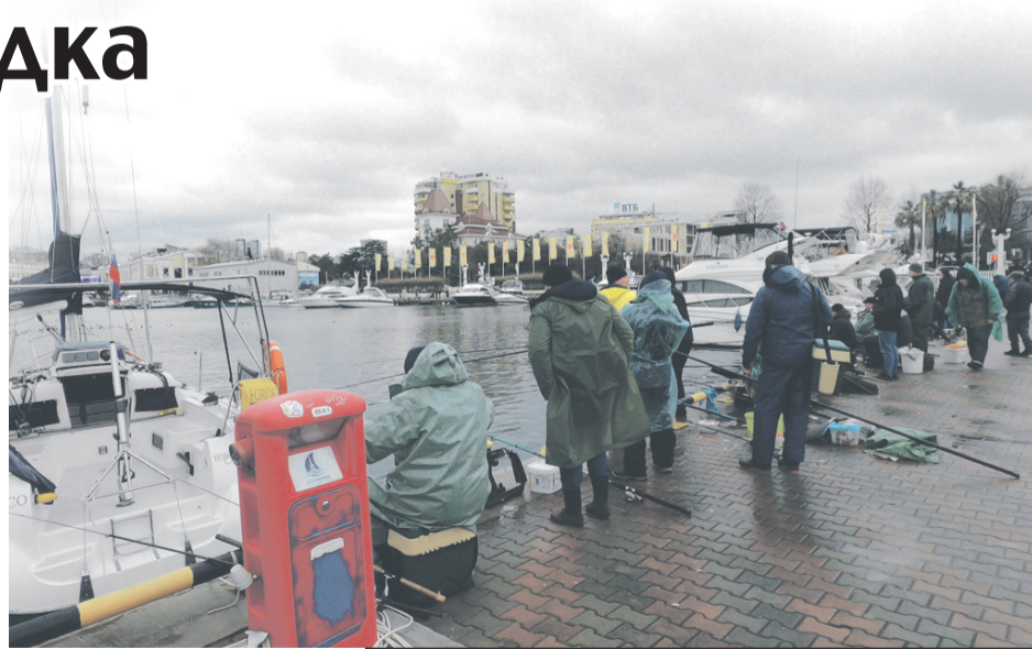
В морпорту Сочи рыбаки таскают удочками форель одну за другой.