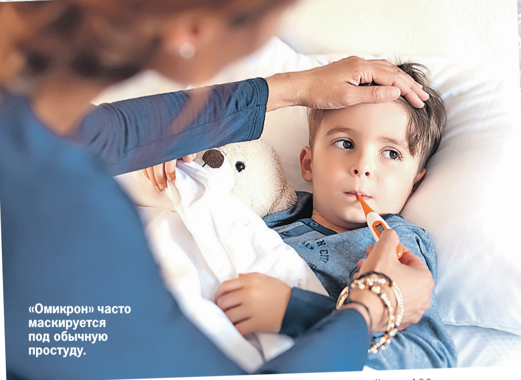
«Омикрон» часто маскируется под обычную простуду.