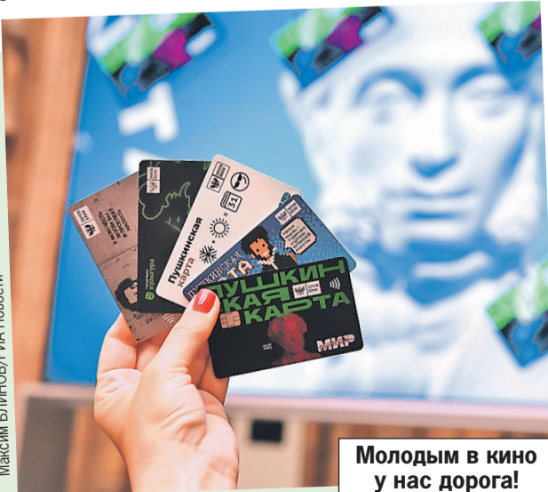
Молодым в кино у нас дорога!

С 1 февраля Пушкинской картой для молодежи можно оплачивать билеты в кино. Правда, не на любые фильмы. В списке - те, что созданы при поддержке Минкультуры, Фонда кино и региональных органов власти, а также из золотой коллекции отечественного кинематографа. Что именно посмотреть за госсчет, можно выбрать в приложении «Госуслуги Культура» или на сайте культуры.рф.