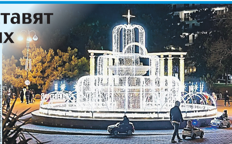
Фонтан на курорте станет сиять лампочками до самого лета.

ся до начала курортного сезона. На весь год оставят светящиеся ракушки на набережной, освещение балюстрады, Платановой аллеи и Первомайского сквера. Такое решение было принято после того, как в администрацию стали поступать положительные отзывы о новом укра-