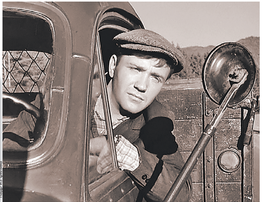
Роль шофера Паши Колокольникова актер называл любимой и лучшей («Живет такой парень», 1964, режиссер - Василий Шукшин).