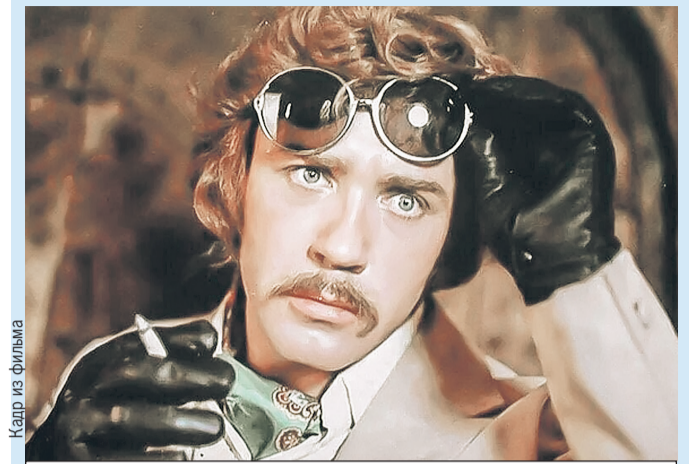
Артист сыграл более 200 ролей в кино (кадр из комедии «Иван Васильевич меняет профессию»).