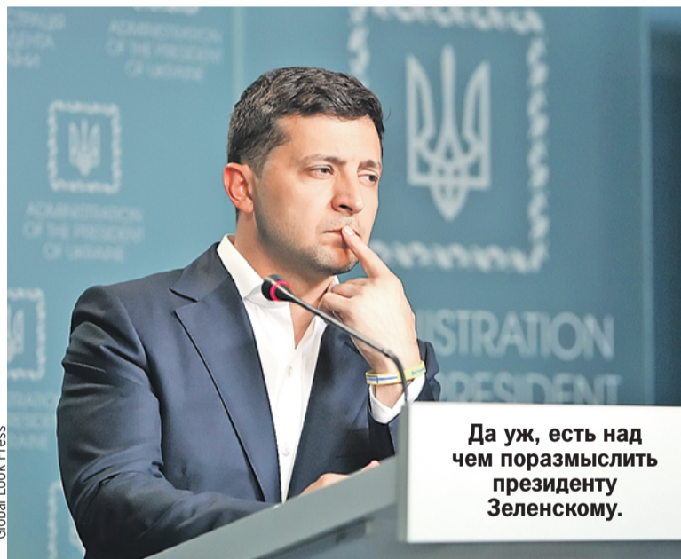
Да уж, есть над чем поразмыслить президенту Зеленскому.

На месте ЦРУ я бы так уж сильно не рассчитывал на необандеровцев. Нагадить они, конечно, могут. Но переломить ситуацию, взять власть - нет. Разумеется, если остальные граждане Украины не захотят еще раз наступить на бандеровские грабли русофобской самостоятельности. Но что такое, неуловимо разлитое в воздухе подсказывает, что второй серии у этой бандеровской истории не будет.