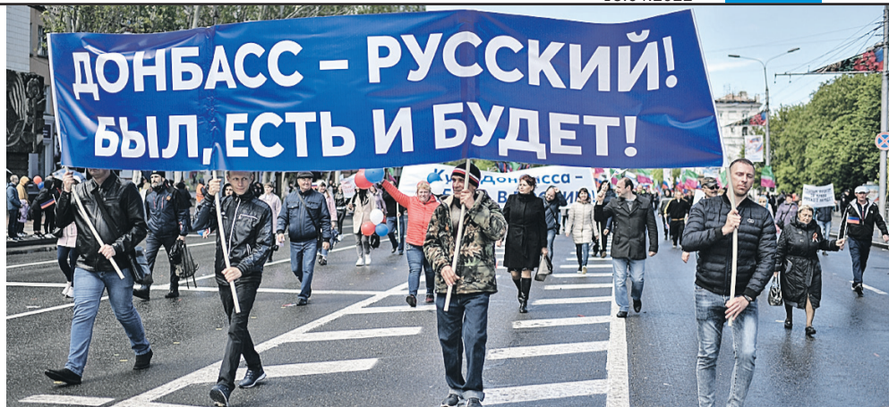
К какой стране «прислониться» после обретения независимости - в Донбассе давно уже для себя решили.