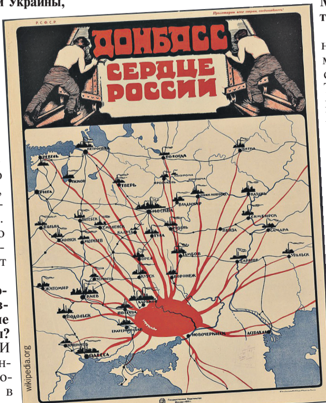
Плакат 1921 года. Тогда никто не сомневался, что Донбасс не просто Россия, а сердце ее промышленности.

Понимаешь, что давило больше всего на Донбасс? Неопределенность будущего. Того, что дети и внуки будут жить с Россией. И то, что здесь сейчас происходит, - это