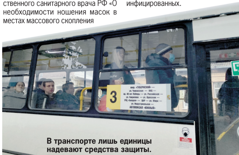
В транспорте лишь единицы надевают средства защиты.

На территории Краснодарского края продолжают регистрировать новые случаи заражения COVID-19. За последнюю неделю статистика суточных заражений в крае варьировалась от 96 до 360 инфицированных.