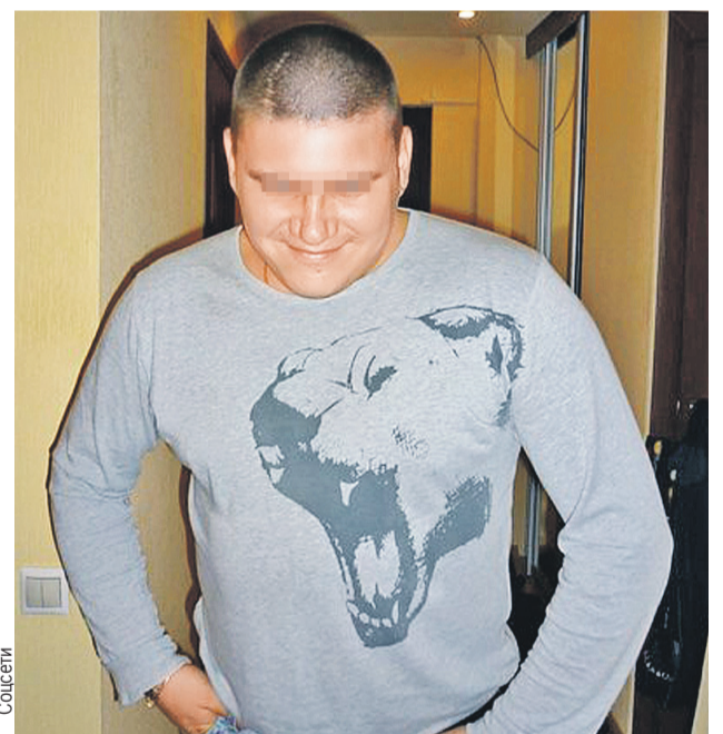
Ушлый таксист, он же шаман.