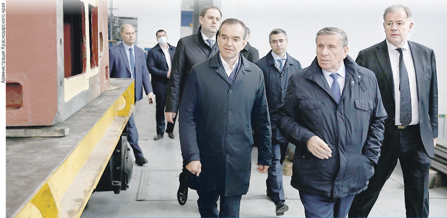
Администрация Краснодарского края