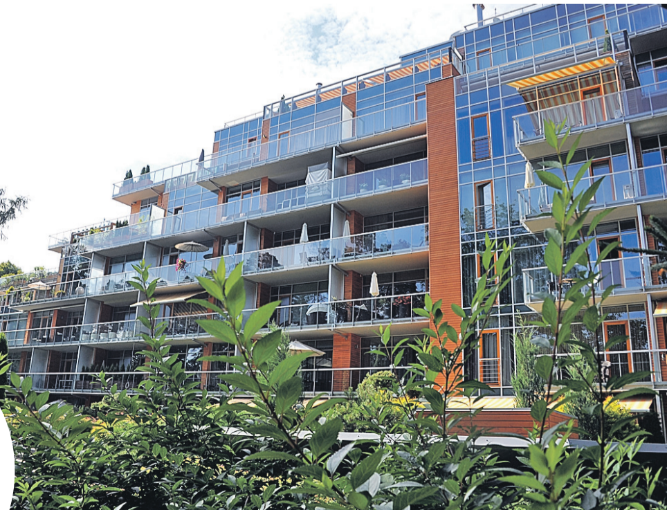
Евгения ГУСЕВА/«КП» - Москва