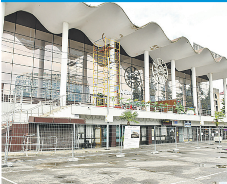
Архитектуру строения сохраняют.