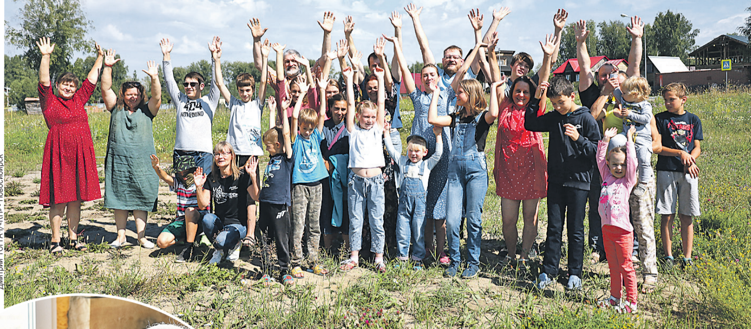
Сейчас в «Семейной сказке» живут более сорока многодетных семей.