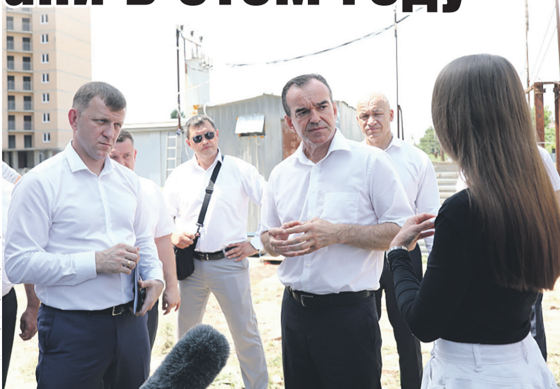
Администрация Краснодарского края

Изначально ЖК «Жемчужина» планировали построить еще в 2016 году. Однако работы заморозили, а под-