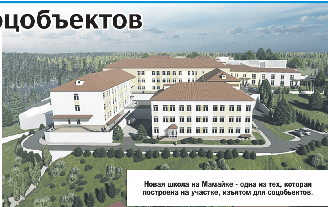
Новая школа на Мамайке - одна из тех, которая построена на участке, изъятом для соцобъектов.

- Имущественный комплекс нашего города важно содержать в надлежащем состоянии. Продолжается мониторинг всех городских объектов, находящихся в муниципальной собственности на предмет своевременного поступления арендных платежей в бюджет города, а также санитарного состояния, благоустройства, проведения ремонтных работ. В главном градостроительном документе города - Генеральном плане, который сейчас разрабатывается, приоритет отдан социально значимому строительству. Все участки, доступные для возведения социальных объектов, необходимо в нем резервировать, - поручил глава города Алексей Копайгородский.