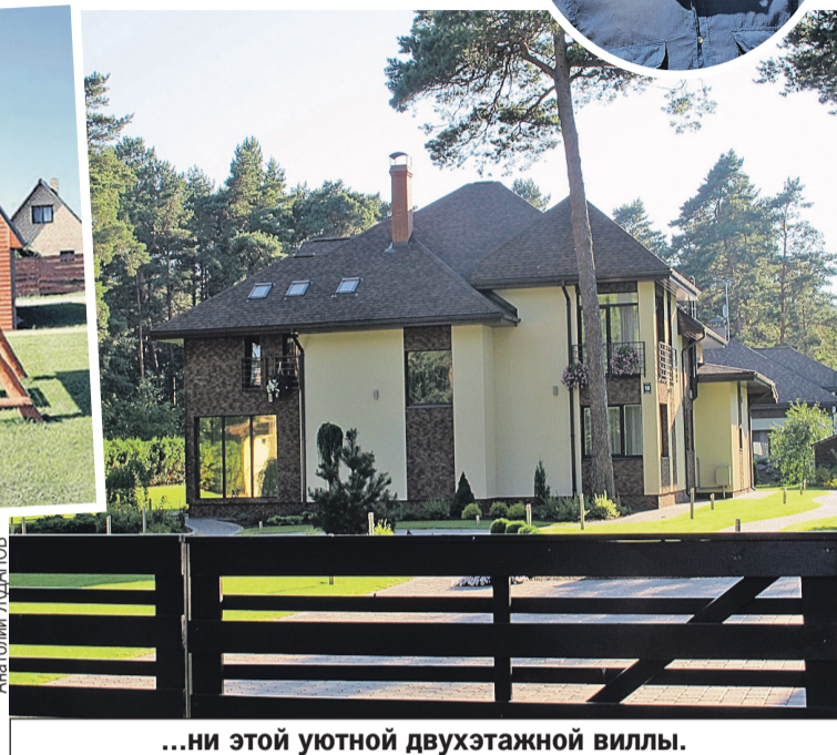
...ни этой уютной двухэтажной виллы.