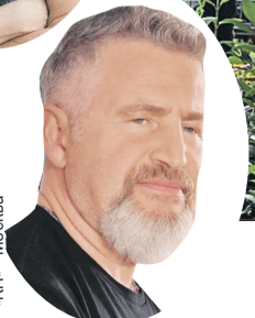
Владимир БЕЛЕНГУРИН/«КП» - Москва