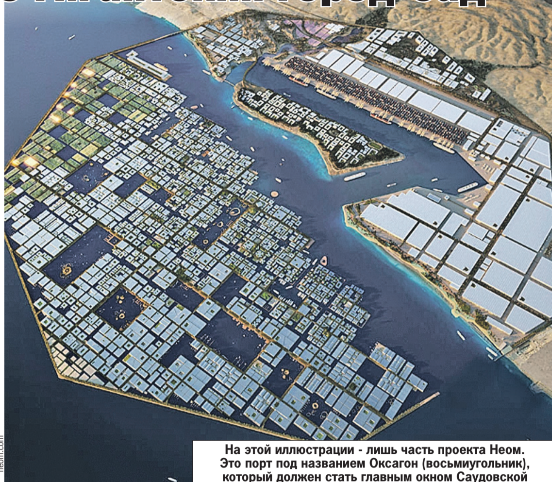
На этой иллюстрации - лишь часть проекта Неом. Это порт под названием Оксагон (восьмиугольник), который должен стать главным окном Саудовской Аравии в международную торговлю.

Ради привлечения иностранцев саудиты готовы поступиться своими религиозными принципами и разрешить в городе употребление алкоголя.