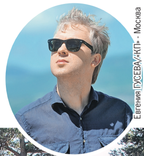
Евгения ГУСЕВА/«КП» - Москва