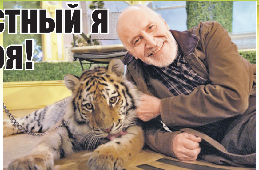
Несмотря на всенародную славу, пенсия у Николая Николаевича Дроздова небольшая, поэтому 85-летний ученый и телеведущий вынужден усердно работать.

Артисты без званий или со званиями, но без московской прописки получают меньше: от 15 до 34 тысяч рублей. Почти все пенсионеры из этой группы имеют постоянную работу или подработку. Тем, у кого их нет, приходится полагаться на близких. Так телеведущая Регина Дубовицкая на ТВ появляется редко, а пенсия у нее чуть больше 15 тысяч рублей. У Николая Дроздова выходит в два раза больше - примерно 33 тысячи с учетом доплаты за большой трудовой стаж. Но профессор и телеведущий помогает дочкам и внукам, поэтому препода-