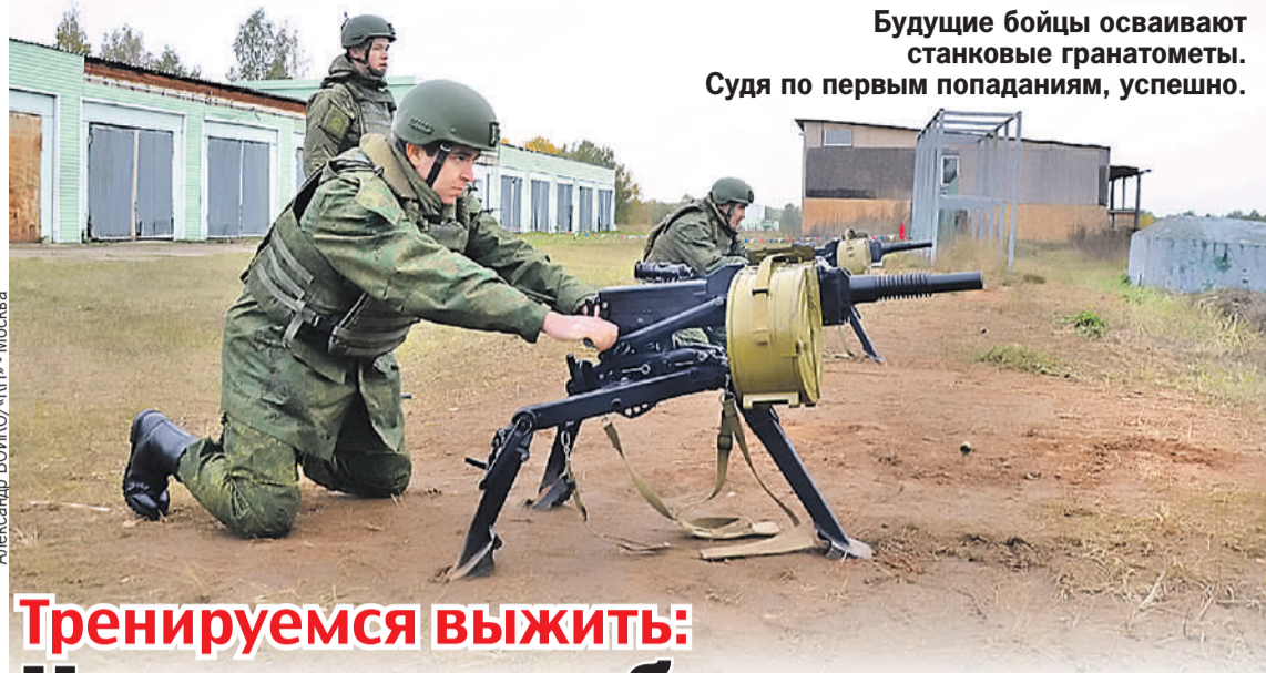
Будущие бойцы осваивают станковые гранатометы. Судя по первым попаданиям, успешно.