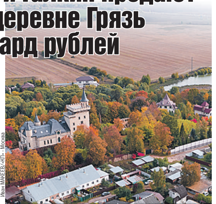
Замок, хоть и выглядит внушительно, расположен достаточно далеко от Москвы в не самом престижном районе.

целей визита было продать замок - якобы певица хочет получить за него миллиард рублей.