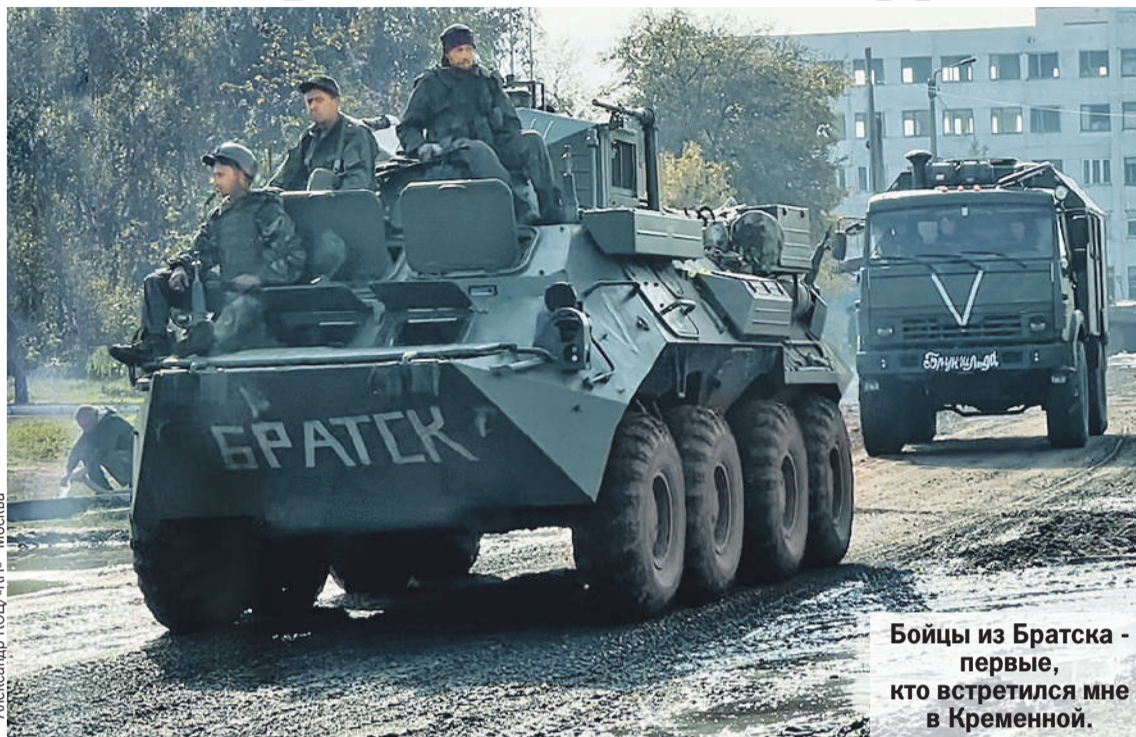
Бойцы из Братска - первые, кто встретился мне в Кременной.

направлении, бросив в бой все, что у него было.