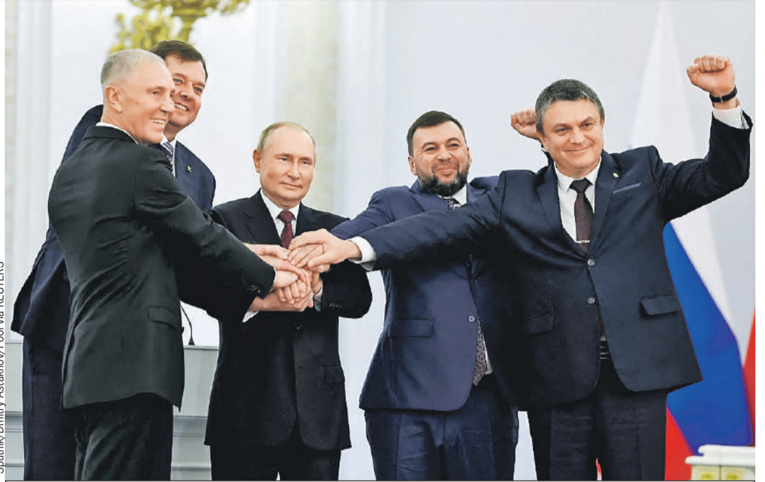
Владимир Путин и главы четырех новых российских регионов (слева направо): Владимир Сальдо (Херсонская область), Евгений Балицкий (Запорожская область), Денис Пушилин (Донецкая Республика) и Леонид Пасечник (Луганская Республика) - после подписания договоров о включении их в состав России.

✓ Запад растоптал принцип нерушимости границ. Он сейчас решает, кто имеет право на самоопределение, а кто этого недостоин. Гегемония имеет характер деспотизма и апартеида: делят мир на вассалов и на тех,