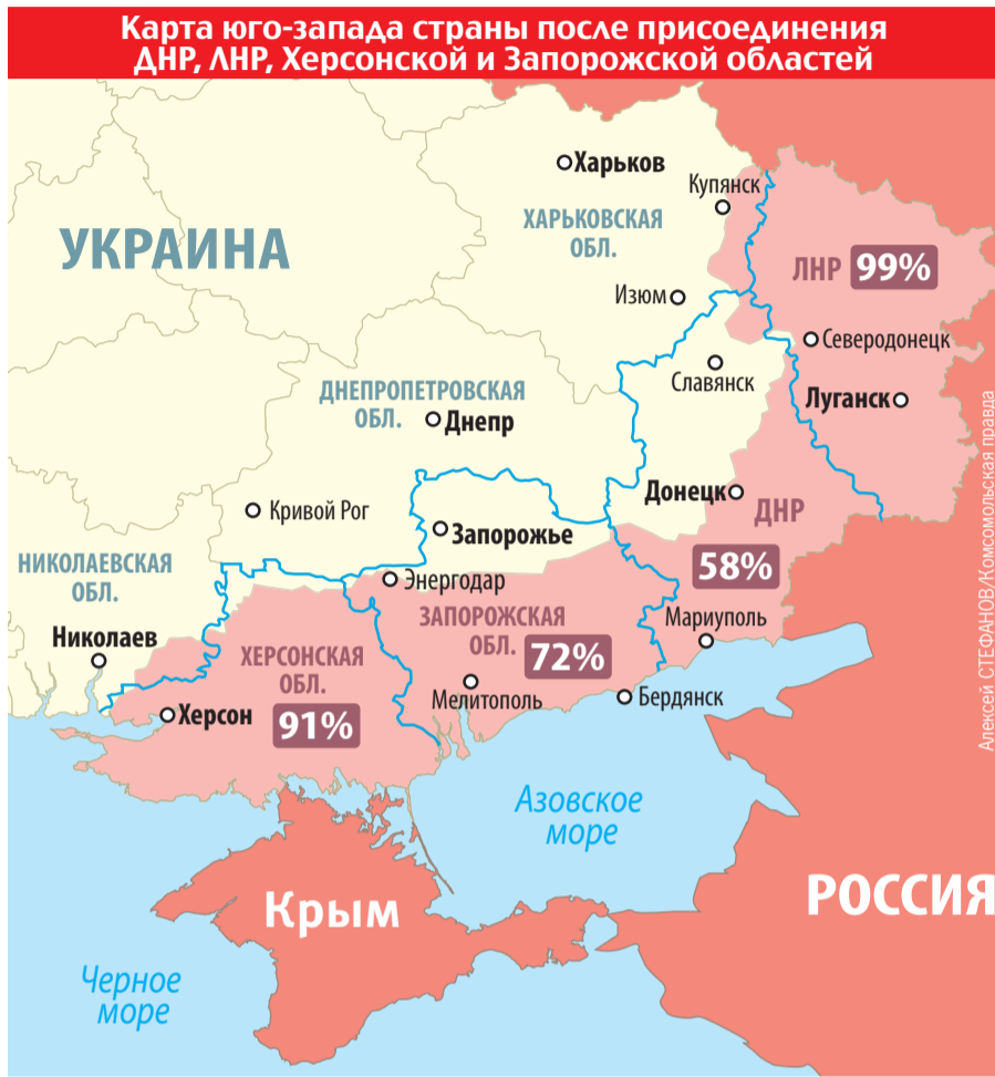
— Административные границы Херсонской, Запорожской, Луганской и Донецкой областей. ■ Освобожденные территории. % Контроль территорий в процентном соотношении.

Plus там есть контейнерный терминал. Везти фуру из Мариуполя в Москву дешевле, чем из того же Новороссийска.