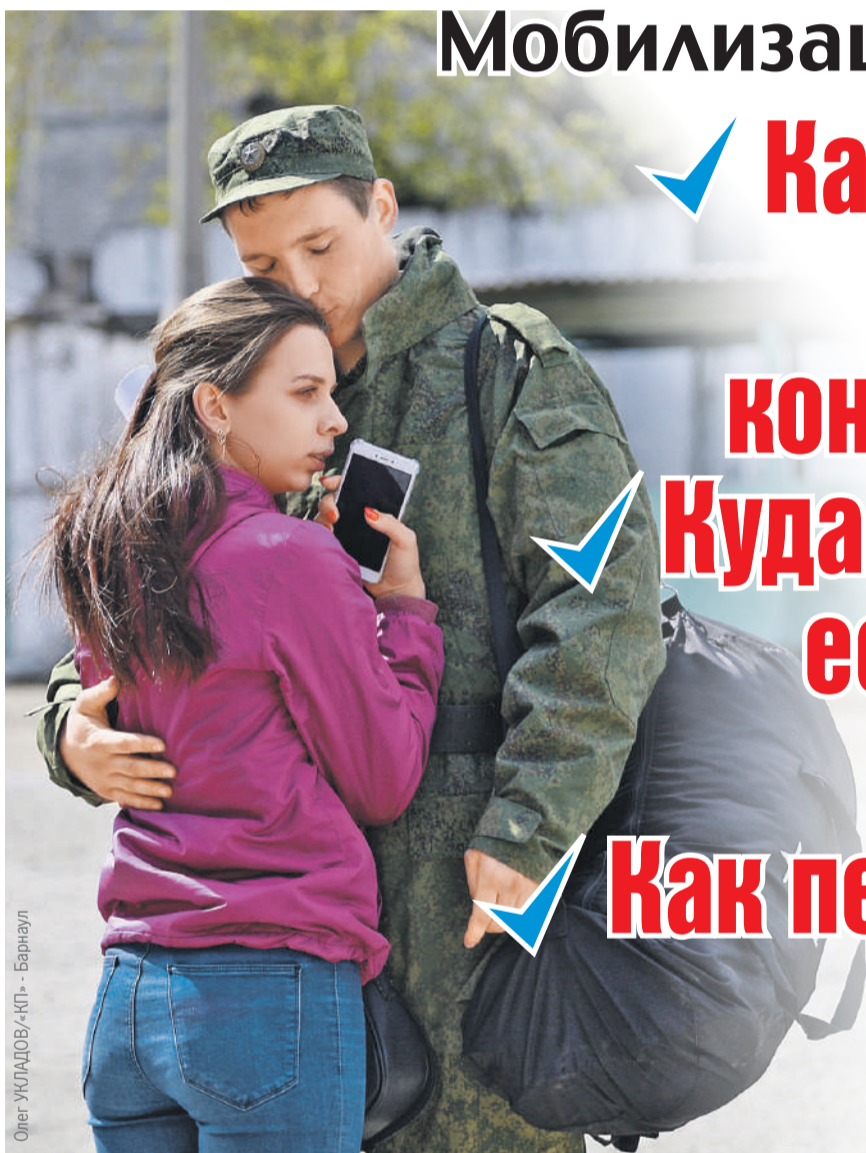
Олег Урлядов/«КП» - Бернаул