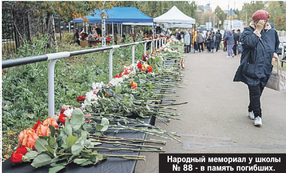
Народный мемориал у школы № 88 - в память погибших.

Кстати, закрытая дверь в декабре 2021-го спасла детей в подмосковном Серпухове. Тогда 18-летний отморозок пришел в свою бывшую школу, чтобы подорвать самодельную бомбу.