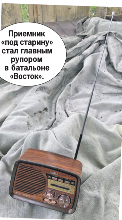
Приемник «под старину» стал главным рупором в батальоне «Восток».

Я побавался этого теста: вдруг радио ничего не пой-