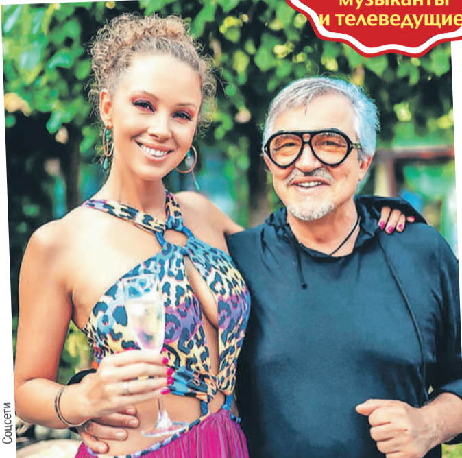
У Дмитрия Диброва молодая жена и неплохая пенсия - что еще нужно успешному 62-летнему мужчине?

Сколько получают от государства возрастные актеры, музыканты и телеведущие