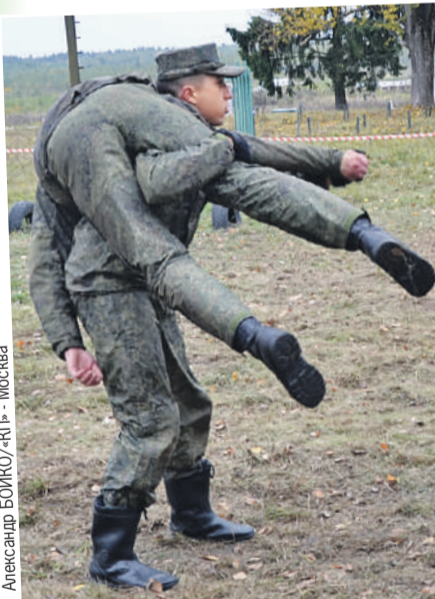
Один из самых важных навыков на линии фронта - выносить раненых товарищей с поля боя.