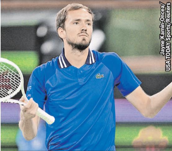
Даниил Медведев: «А меня-то за что в иноагенты, я вам что – Алла Пугачева?»

«В жизни каждый человек имеет право на свое мнение – так же как я имею право быть с ним не согласным. У всех свои причины думать так, а не иначе. Со своей стороны, повторяю: если будет возможность – с удовольствием пое-