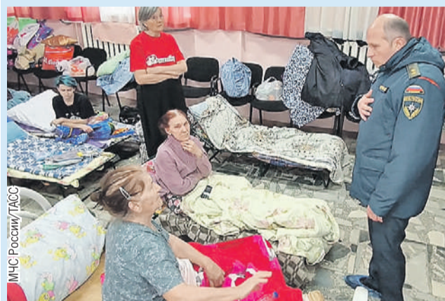
Глава МЧС Александр Куренков навестил людей в пункте временного размещения.

Кроме того, Путин поручил главе МВД не допустить мародерства в районах бедствия. И обеспечить охрану порядка, а также имущества граждан.