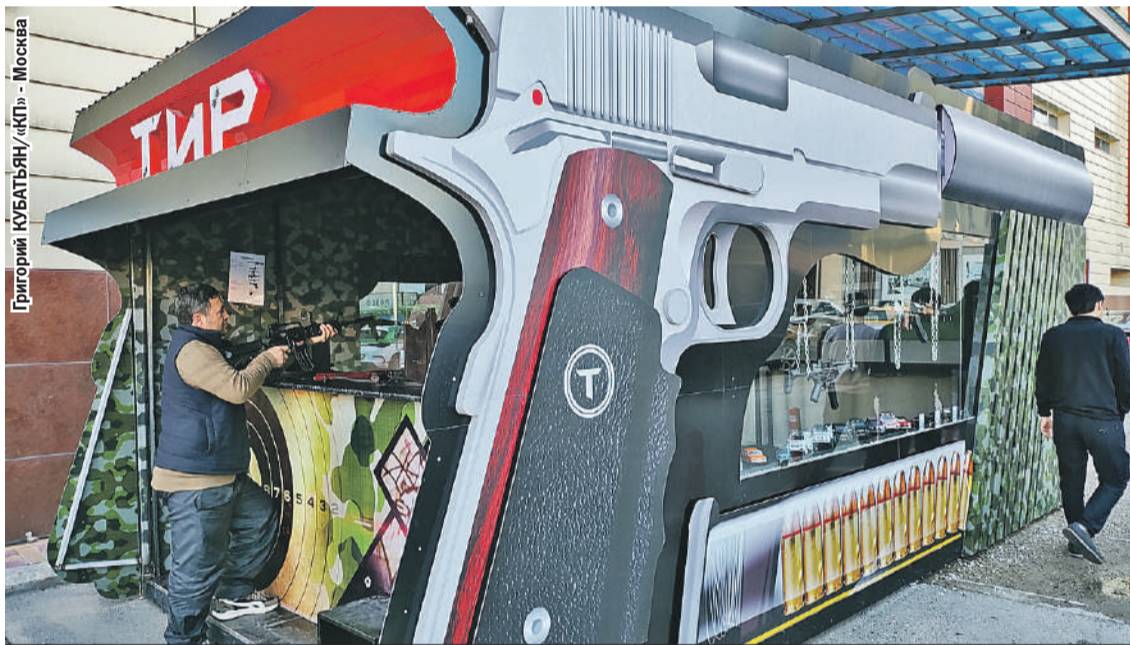
Если в Душанбе вам про кого-то скажут: «Он оружия в руках не держал, стрелять не умеет», это будет полуправдой. Тиров тут полно, и пострелять в них любят многие.

Решение есть. В России нужно реформировать миграционную систему, об этом уже и Путин сказал. А с Таджикистаном восстанавливать прежние экономические и культурные связи. Возвращать в республику русских специалистов, строить заводы. Но быть готовыми