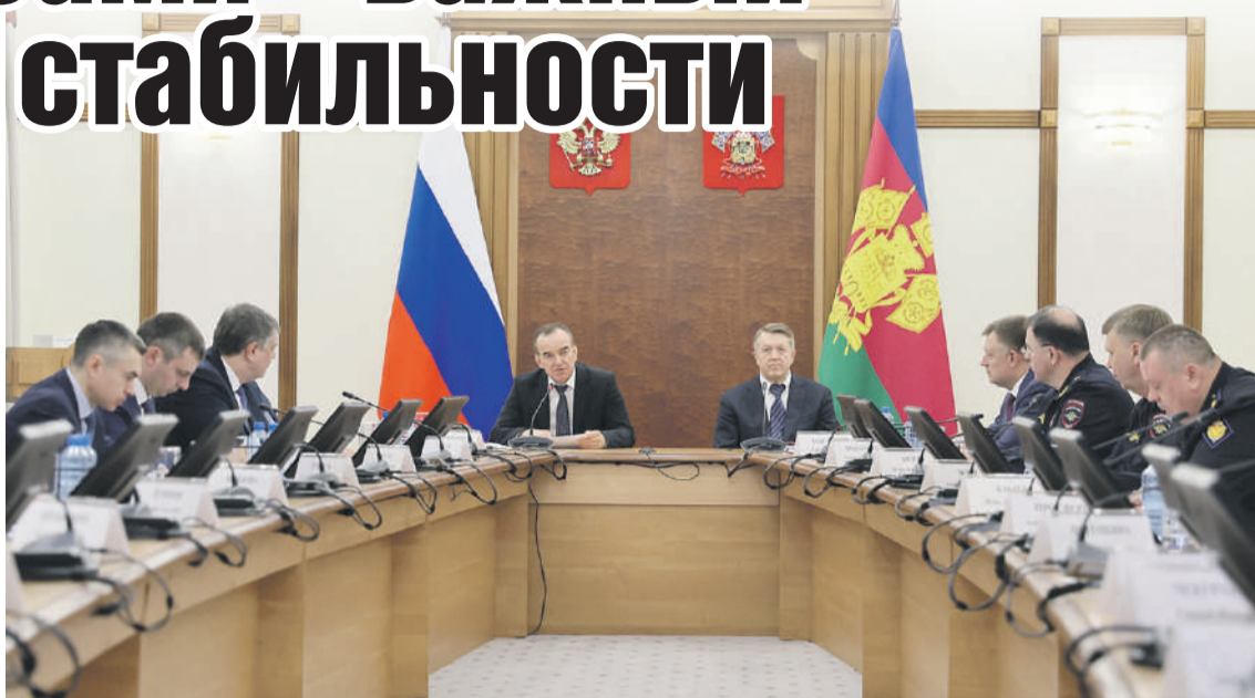
Администрация Краснодарского края