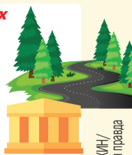
Дмитрий ПОЛУХИН / Комсомольская правда

В национальных парках страны организовать экологический туризм (и чтобы были площадки для отдыха, музеи, визит-центры, экологические тропы, туристские маршруты). Привлекать к профориентационной работе с детьми предприятия, научные и медицинские организации и их музеи.