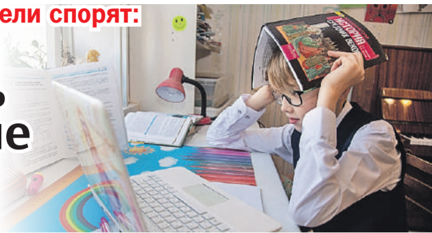
Николай ОБЕРЕМЕНКО/«КР» - Пермь