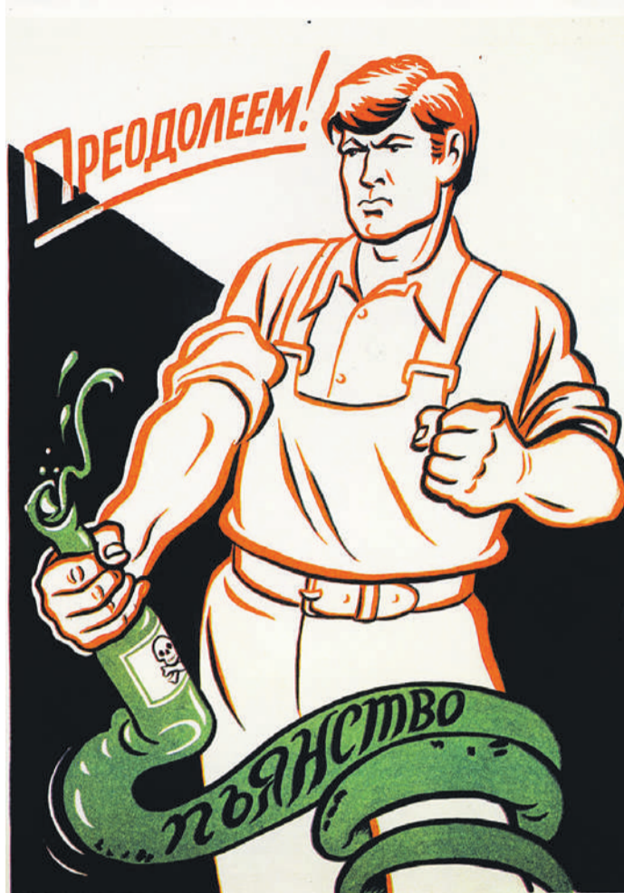
Врачи единодушны: алкоголь - яд. Поэтому если и принимать его, то в маленьких дозах.

Обратите внимание: даны цифры чистого спирта. Для конкретного алкоголя их нужно будет пересчитать в зависимости от крепости напитка.