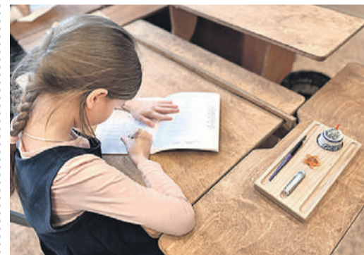
Семейный центр «Ладимир».

В Великом Новгороде создали классы по программе Русской классической школы.