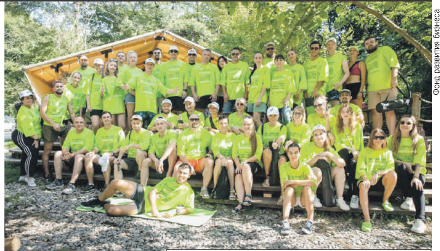
Фонд развития бизнеса

В 2021 году по инициативе губернатора запустили уникальный проект «Школа молодого предпринимателя. Бизнес молодых». В нем уже приняли участие более 10 тыс. человек.