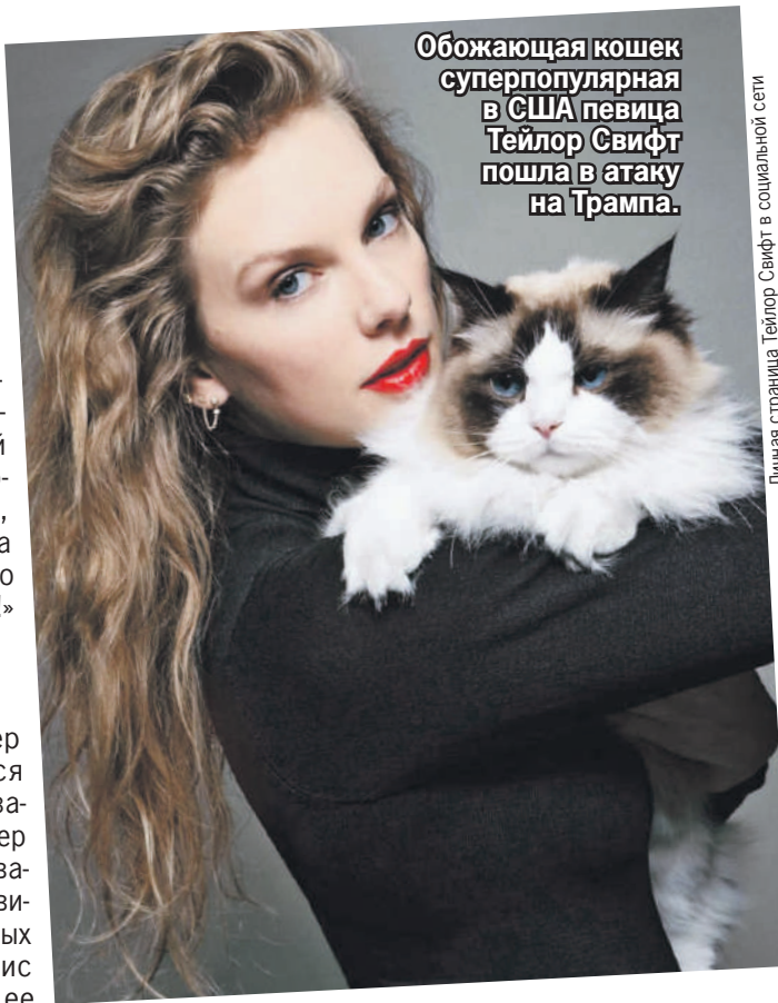
Личная страница Тейлор Свифт в социальной сети

Обожающая кошек суперпопулярная в США певица Тейлор Свифт пошла в атаку на Трампа.