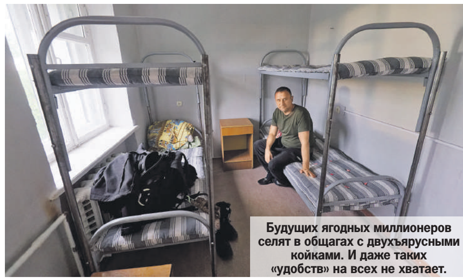
Будущих ягодных миллионеров селят в общежитиях с двухъярусными койками. И даже таких «удобств» на всех не хватает.