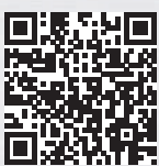
Фото присылайте в «Комсомольскую правду», e-mail: miss@kp.ru

Голосуйте за понравившуюся вам участницу на нашем сайте KP.RU в разделе «Будь стильной с «КП»!