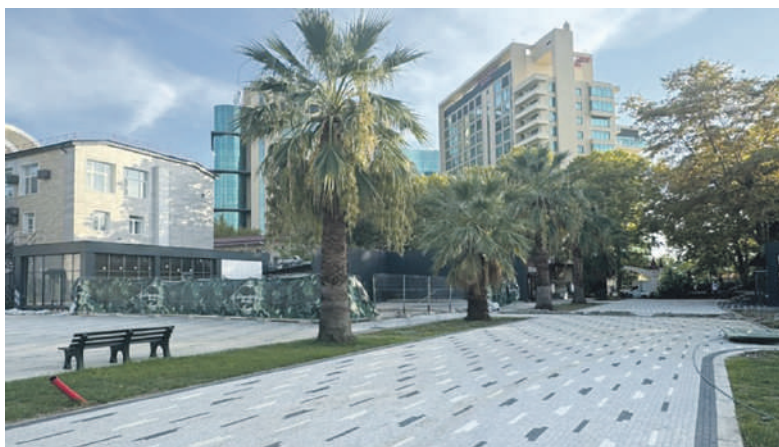
Один из этапов работ - обновление тротуаров.

Работы планируется завершить до конца года.