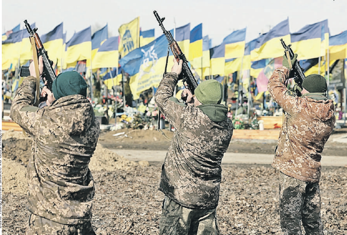
Даже западные журналисты отмечают: кладбища с военными на Украине разрослись так сильно, что это уже бросается в глаза. Только Киев продолжает этого не замечать - у них одна победа за другой. Как будто живут в своем вымышленном мире.

- Как вы считаете потери? - Это программа, которая ищет по ключевым словам. Она мониторит интернет, социальные сети. Местные рады иногда пишут некрологи, заводы... мол, «загинув» (погиб - с укр.) такой-то «захисник» (защитник - с укр.). Да в соцсетях люди выкладывают - это у них как крик души. - Можно сравнить, сейчас потерь у ВСУ больше или меньше? - Столько же или даже больше. На прошлой неделе был рекорд - 1208 или 1206 некрологов за день. Даже при Бахмутской операции в самый пик было 1100 с чем-то. - У вас же есть погрешность? - Конечно, поэтому потери, скорее всего, еще больше. Но на дистанции все всплывает: они выложат 300 - 400 некрологов... но через какое-то время доходит информация о новых смертях в то же самое время в том же месте.