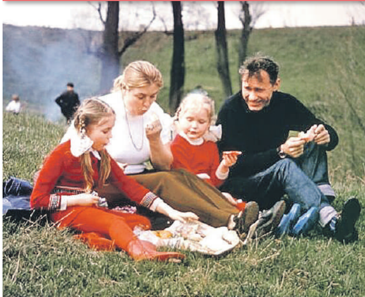
Пикник с женой и дочками. И кто теперь помнит, что такие образцовые фото тогда делали для журналов.

Режиссер и актер Василий Шукшин сам про себя говорил: «Всю жизнь живу со сжатыми кулаками». Отдыхать он вообще не любил. Но иногда приходилось.