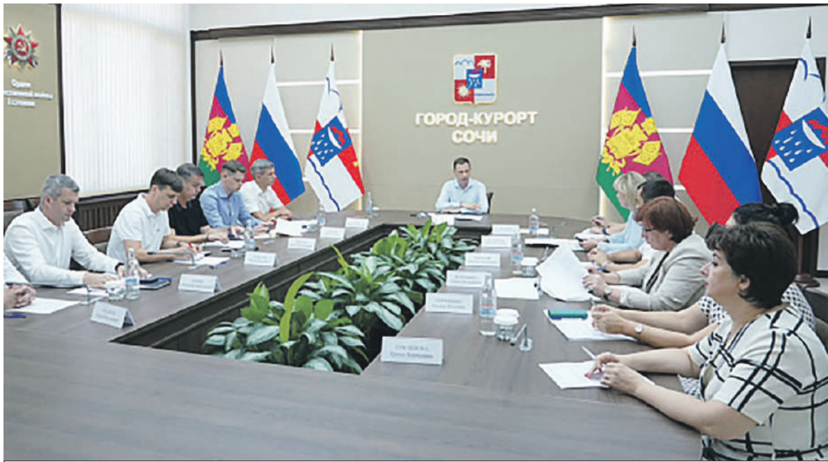
Реализацию проекта обсудили на совещании.