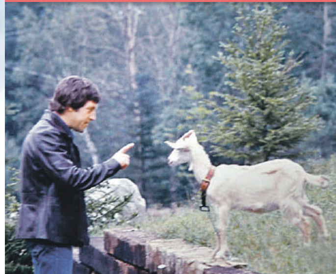
«Жил да был козел, роги длинные» Высоцкий написал за 3 года до этой встречи.

Владимир Высоцкий много где успел побывать. Например, есть уникальные кадры, как в 1976-м он катается на лодке и кормит козлика на природе под Монреалем, куда приехал вместе с Мариной Влади .