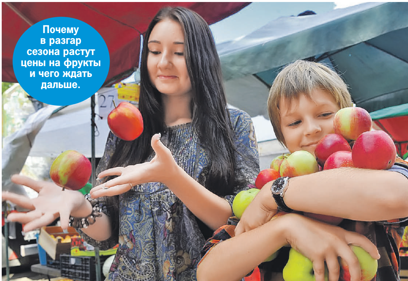
Евгения ГУСЕВА/«КП» - Москва

Почему в разгар сезона растут цены на фрукты и чего ждать дальше.