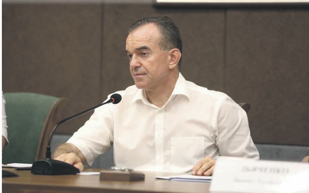
Вениамин Кондратьев отметил, что развитию промпарков и промтехнопарков способствуют разработанные меры поддержки.

В числе таких площадок проекты, по которым недавно мы заключили соглашения с инвесторами. Это промпарк в Армавире, который специализируется на вагоностроении, металлообработке и планирует запустить производство лакокрасочной продукции. И промтехнопарк сельхозмашиностроения в Кропоткине. Здесь развивают технологии и производства аграрной техники, запасных частей и комплектующих для нее. А также для оборудования, которое используют в сахарной,