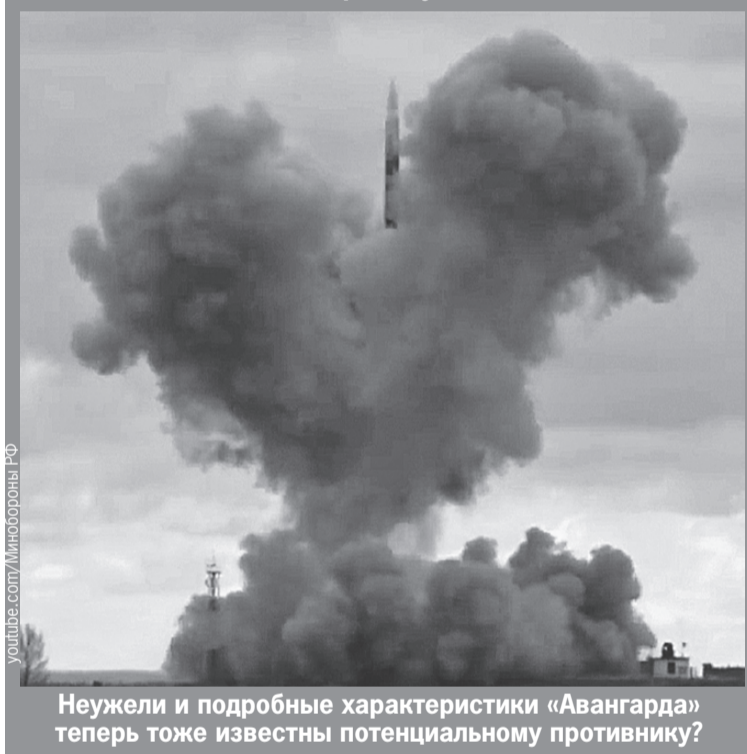
Неужели и подробные характеристики «Авангарда» теперь тоже известны потенциальному противнику?

- У кого из ваших сотрудников были обыски?