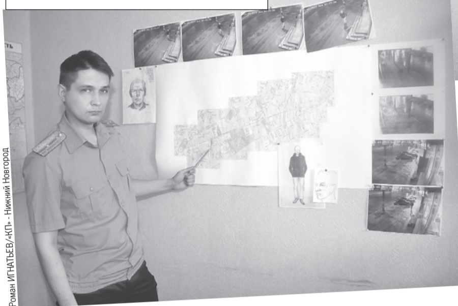
Роман ИГНАТЬЕВ/«КП» - Нижний Новгород

В кабинете следователей висит карта последних передвижений Маши Гликиной.