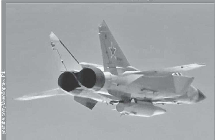
Методов борьбы с «Кинжалом» у американцев не было. Теперь могут появиться?