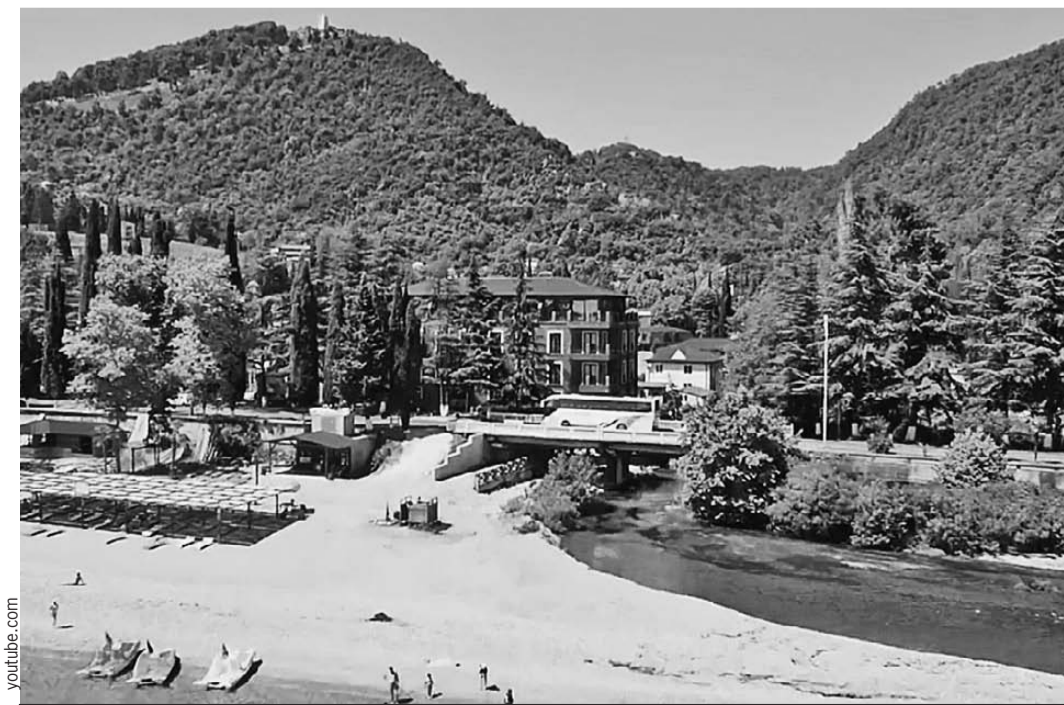
Из этого отеля на самом берегу моря и выкрали беглого коммерсанта.