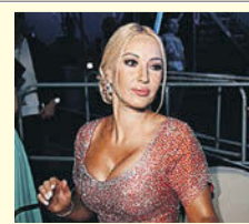
Лера Кудрявцева Экспресс газета

У Леры Кудрявцевой в груди лопнул имплант