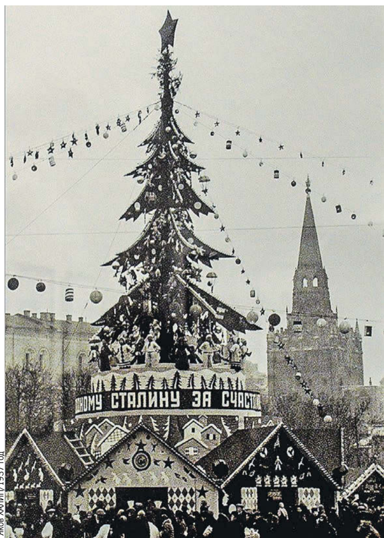
Москва, елка у Троицких ворот. В Кремле - товарищ Сталин, а на новогодней елке среди украшений - здравица в честь великого вождя. 1937 год.

Оказывается, в то время государь заложил не один, а целых три Александровских сада - Верхний, Средний и Нижний - от Угловой Арсенальной до Водовзводной башни: для «красоты и прогулок и праздных забав». Сегодня сад перестали делить на части: теперь он просто один Александровский. Но 200 лет назад народ охотнее всего шел именно к верхней большой рождественской и новогодней елке - у декоративного грота «Руины».