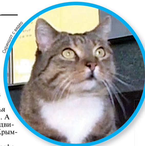
Скриншот с видео

В среду транзитом через Симферополь пройдет пассажирский поезд «Санкт-Петербург - Севастополь», а затем не заставит себя ждать и «Москва - Симферополь».