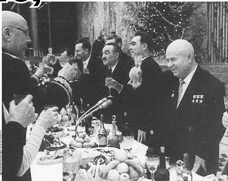
Маршал Советского Союза Семен Тимошенко (на фото - слева) поздравляет первого секретаря ЦК КПСС Никиту Хрущева с Новым годом. Справа от Никиты Сергеевича - его соратники Леонид Брежнев и Анастас Микоян. Москва, Кремль, декабрь 1963 г.

Постышев так и сделал: осудил «левый елочный загиб» и рекомендовал «положить ко-