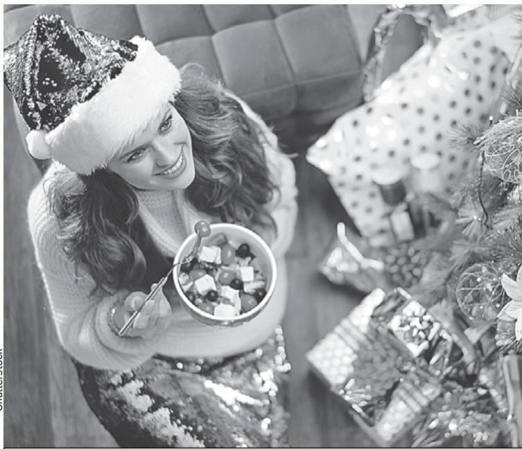
Даже полезной закуски должно быть в меру.

цепт. Картофеля кладите самый минимум, как будто это дорогой деликатес. Во-вторых, вместо покупного майонеза возьмите более легкую заправку (например, греческий йогурт или сметану) или сделайте домашний майонез. Так вы будете знать, что использовали самые свежие и натуральные компо-