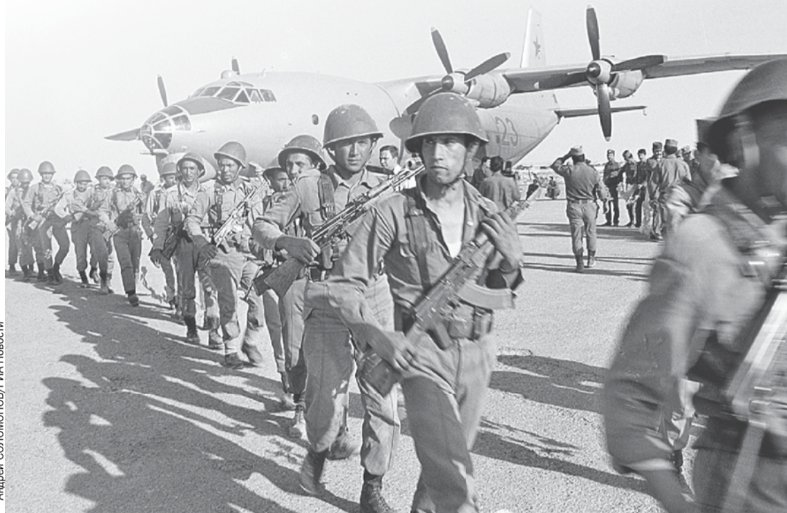
Советский спецназ высаживается в Афганистане. Весна 1988-го.

В самом СССР эта война поначалу держалась в секрете. Газеты и телевидение хранили молчание о ее размахе и потерях, сообщая лишь об исполнении «интернационального долга» в Демократической Республике Афга-