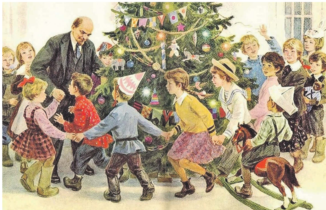
Детский новогодний хоровод с дедушкой Лениным. Поздравительная открытка. 1950-е годы.

ной хороминой на Красной площади, в Тайницком саду у зданий Старых и Новых приказов и у Лобного места, перед Спасскими воротами.