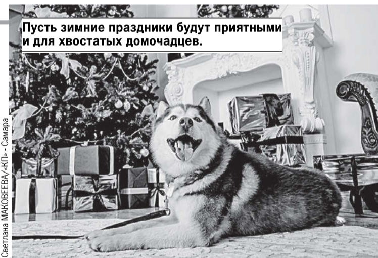
Светлана МАКОВЕЕВА/КП - Самара

Любите своего питомца? Тогда не ставьте дома натуральную елку. Небольшая, искусственная куда безопаснее. Новогоднее дерево может упасть на животное, питомец может начать его грызть, пить воду из емкости для