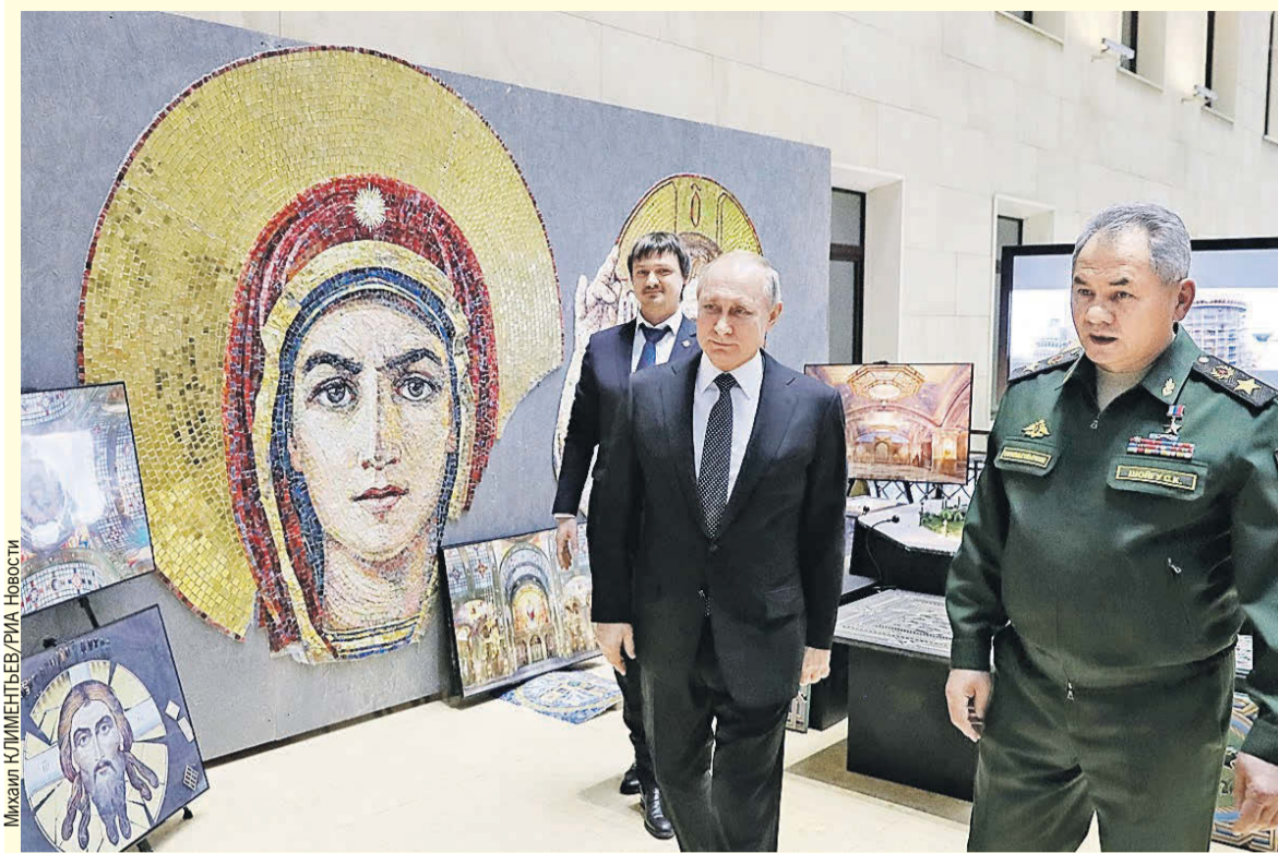
Владимир Путин приехал во вторник на ежегодную коллегию Минобороны. А перед этим Сергей Шойгу провел президента по выставке, на которой были не только новые вооружения, но и образцы внутреннего убранства Главного храма Вооруженных сил, который строится в Подмоскowie к 75-летию Победы.

- Я пью даже не чай, а заваренные, облитые кипятком травы с Алтая.