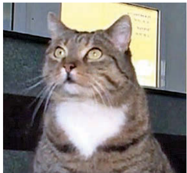
Фото из видео