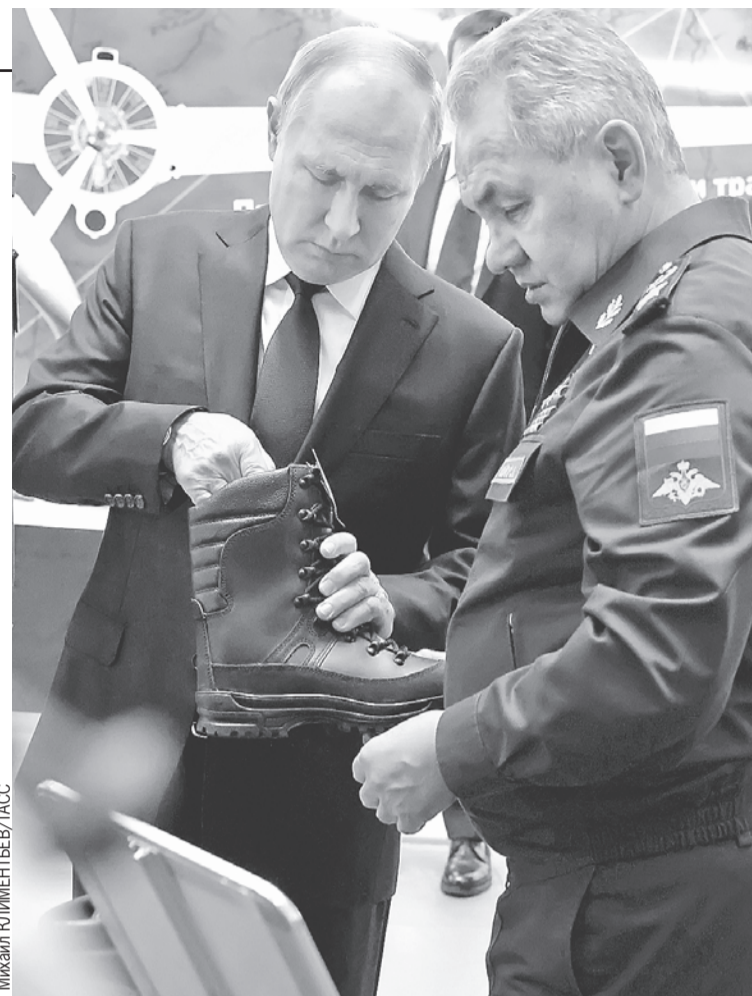
Уже после коллегии Владимир Путин и Сергей Шойгу осмотрели последние разработки для наших бойцов на специальной выставке.

- Проведенная частичная мобилизация выявила опре-