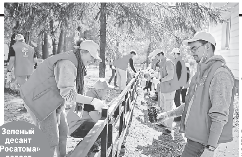
Зеленый десант «Росатома» делает природу чище.

«Росатом» реализует проекты в городах присутствия. В этом году к ним присоединился Энергодар, в котором располагается самая крупная в Европе атомная электростанция - Запорожская АЭС. Жители Энергодара переживают непростые времена, и семья «Росатом» решила их поддержать проведением марафона «Росатом вместе с Энергодаром». Так сотрудники Госкорпорации оказывают поддержку жителям