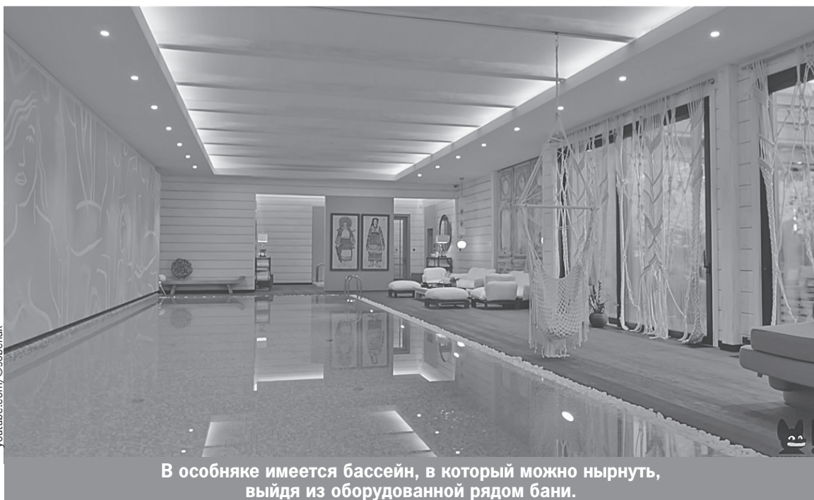
В особняке имеется бассейн, в который можно нырнуть, выйдя из оборудованной рядом бани.

А еще есть просторная баня с выходом к бассейну: «Бассейн всегда был моей мечтой, потому что я человек брезгливый, в общественных бассейнах плавать не могу».