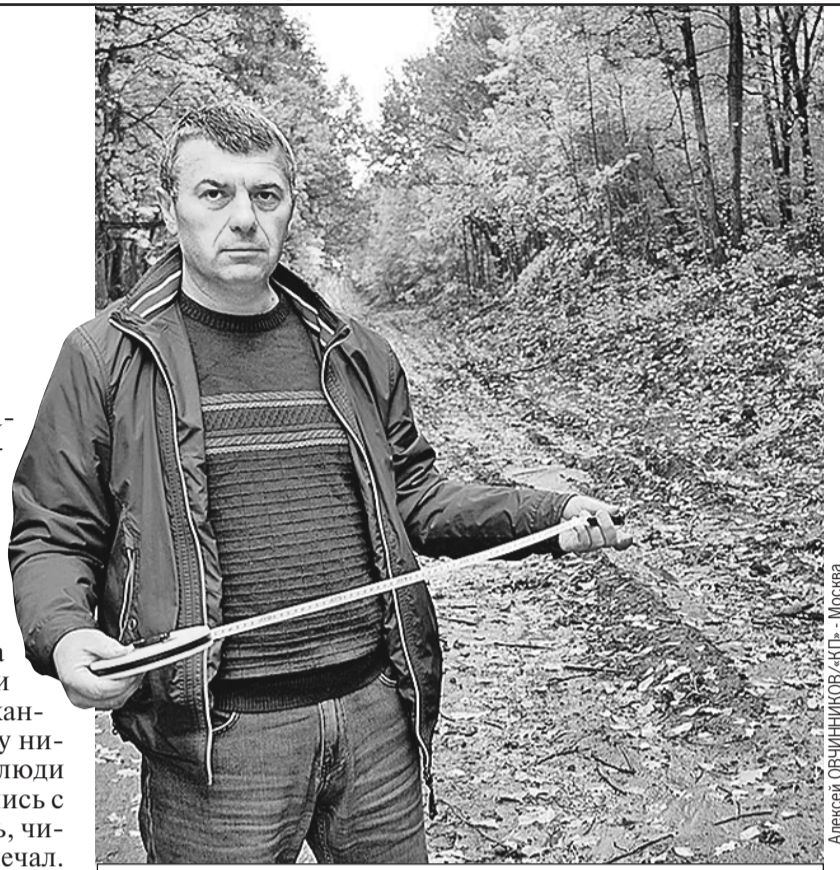
Алексей ОВЧИННИКОВ/«КП» - Москва

Дальше вообще интересно: спустя полгода после возбуждения дела следователи выяснили (даже съездив для этого в Москву) - несколько лет назад произошла какая-то техническая ошибка, ее исправили, и с ноября 2021-го это уже не дорога, а лесной квартал.