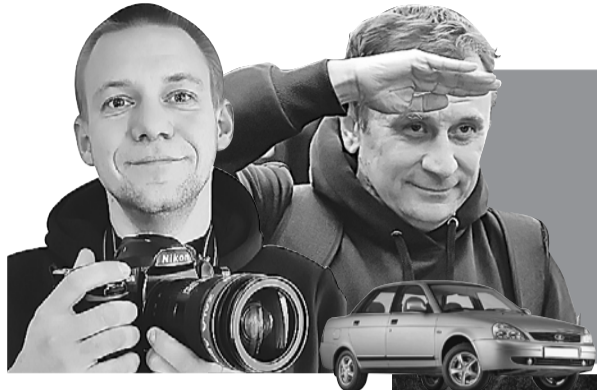
Владимир ВОРСОБИН (текст)

Продолжение. Начало в предыдущих номерах «КП» и на сайте KP.RU.