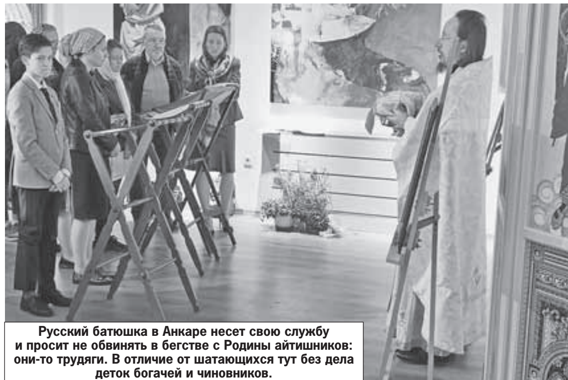
Русский батюшка в Анкаре несет свою службу и просит не обвинять в бегстве с Родины айтишников: они-то трудяги. В отличие от шатающихся тут без дела деток богачей и чиновников.

- Почему все замкнулись на айтишников? - удивлялся после службы отец Геор-