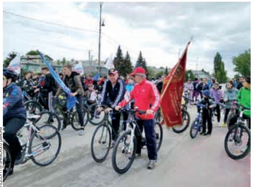
КЦСОН Пугачевского района

Отметим, что к 2024 году технологии долговременного ухода в рамках национального проекта «Демография» будут внедрены во всех 39 районных центрах социального обслуживания населения.