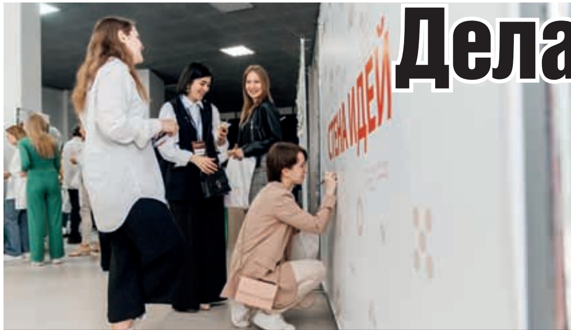
В рамках форума его участники делились своими идеями.