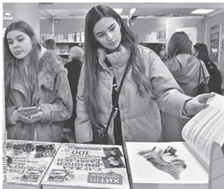
Иван МАКЕЕВ/«КП» - Москва

А до окончания конкурса еще целый месяц! И уже 50 работ вышли во второй тур. Они опубликованы на сайте конкурса и участвуют в народном голосовании, которое определит лидеров для экспертного жюри. А мы задались вопросом: если у нас в стране так много начинающих талантливых авторов, будет ли на них и их тематику читательский спрос? И почему молодежь больше пишет не про любовь, а уходит в антиутопию, фэнтези, темы патриотизма и военных конфликтов? Об этом мы поговорили с нашими экспертами. И оказывается, нет худа без добра - западные санкции отразились на книжном рынке России. Они освободили ниши для молодых и талантливых, за которыми уже началась «охота» российских книгоиздателей.