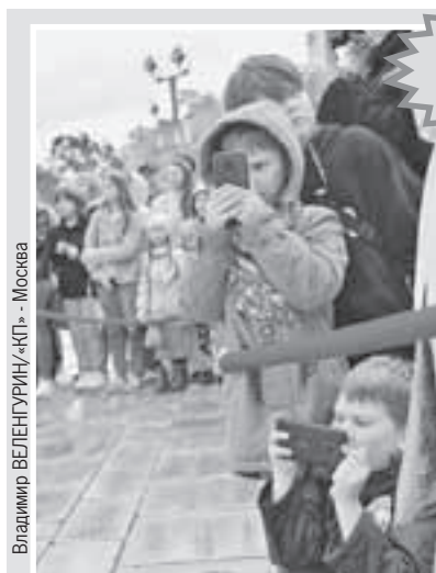
Владимир ВЕЛЕНГУРИН/«КП» - Москва

Москва Санкт-Петербург Екатеринбург Новосибирск Казань Нижний Новгород Волгоград Омск Ростов-на-Дону Самара Челябинск Уфа Воронеж Краснодар Красноярск Пермь