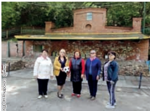
КЦСОН Аткарского района