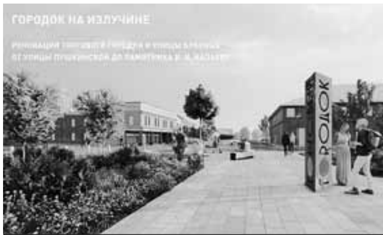
Несколько проектов по благоустройству в Саратовской области уже реализовано.

российского конкурса стали Балашов и Хвалынский, в 2019-м - Ершов, в 2020-м - семь городов: Вольск, Калининск, Балашов, Красноармейск, Маркс, Петровск и Пугачев, - отметил Строков. - На сегодняшний день на шести объектах работы завершены в 2021 году (досрочно), а один объект будет завершен в 2022 году. В 2021 году в конкурсе выиграли пять городов: Аткарский, Ершов,