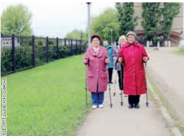
КЦСОН Ершовского района