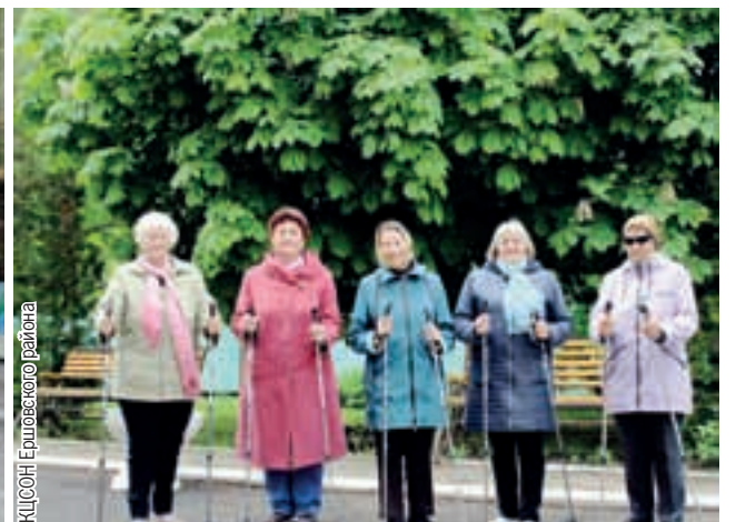
КЦСОН Ершовского района

Пенсионеры не только поддерживают свою физическую активность, но также общаются друг с другом.