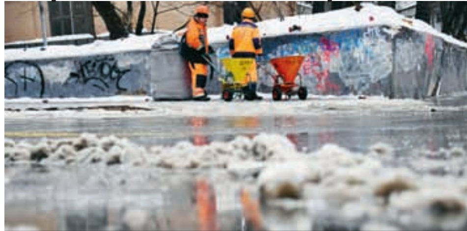
На дороге будет гололед.