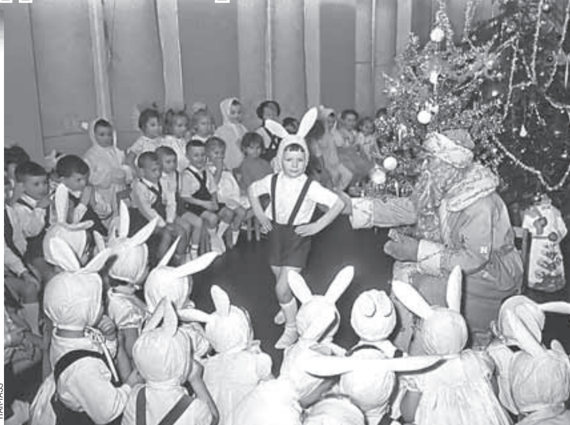
Мальчики-зайчики и девочки-снежинки - неизменная классика детской новогодней моды.

- Я ходил в садик в начале 60-х. Был в семье единственным ребенком, а вокруг меня тогда были родители, бабушки, прабабушка. Конечно, им всегда хотелось сделать для меня лучший праздник, поэтому они мастерили костюмы сами. Когда я в садик ходил, мой костюм позволил мне встать на табуретку и спеть Деду Морозу песню: «Я Петрушка маленький, малень-