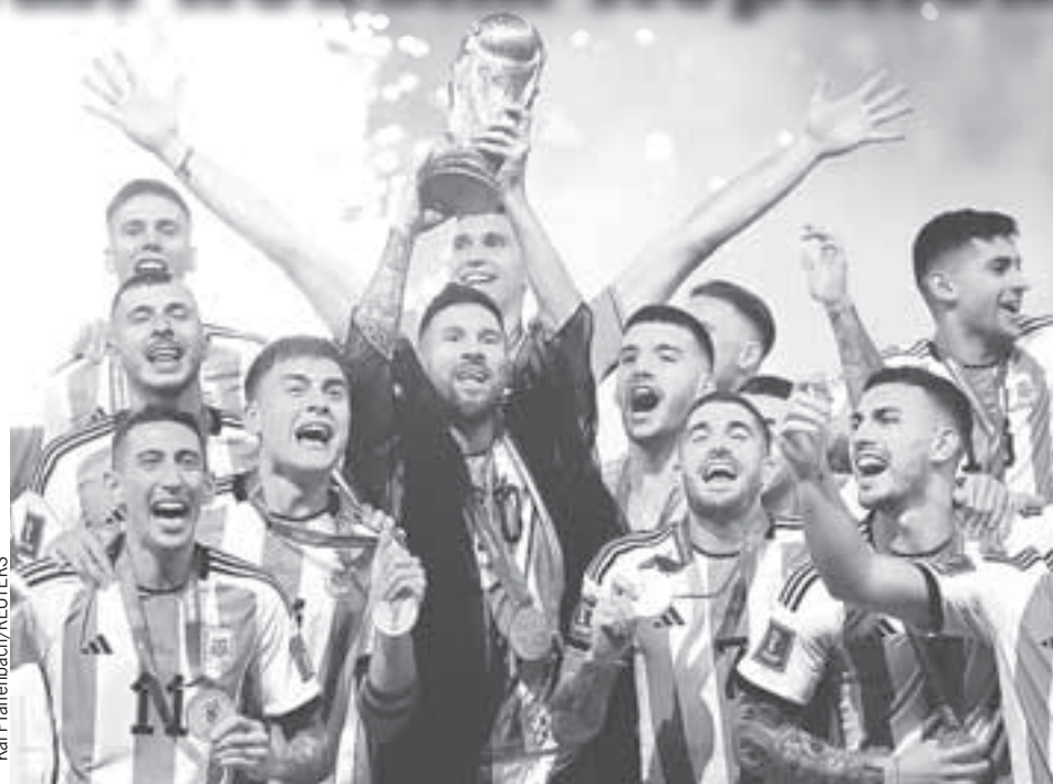
Триумф Месси и его партнеров. Кубок мира - у Аргентины!