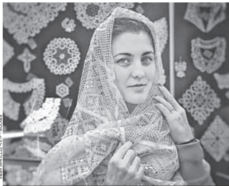
Главный плюс автостопа через всю страну - в каждом городе можно обзавестись сувениром. В Вологде - кружева. Теплые, красивые.