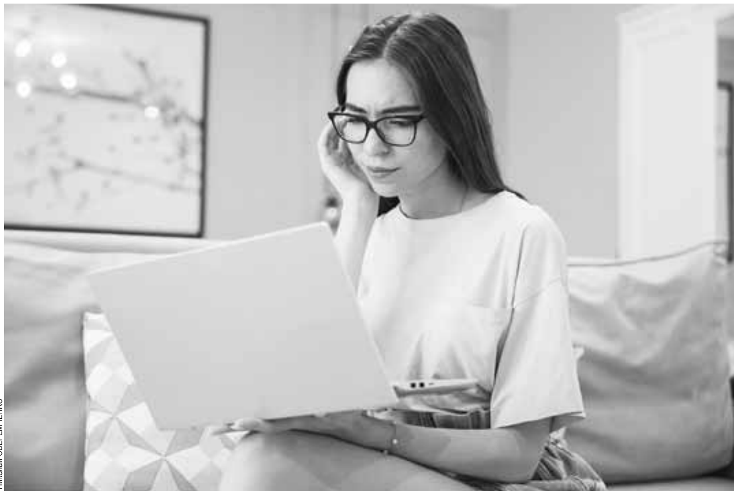
Роскомнадзор требовал от Tor Project удалить запрещенную информацию.

Суд согласился с доводом надзора о том, что браузер-анонимайзер может быть использован для «последующего посещения сайтов, на которых размещены материа-