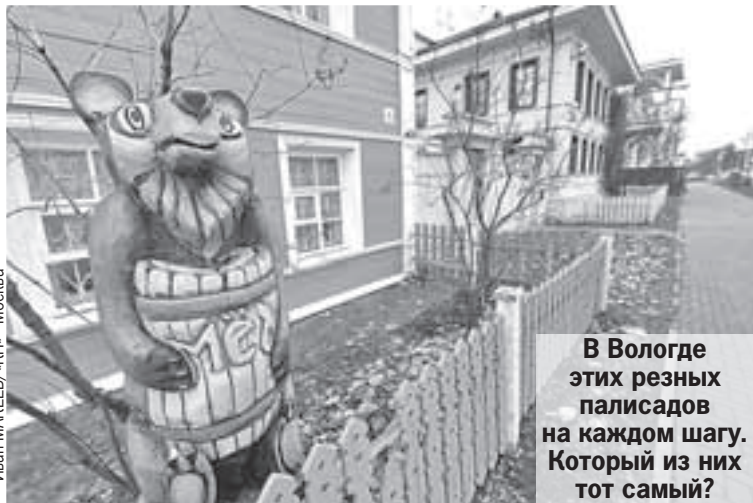
В Вологде этих резных палисадов на каждом шагу. Который из них тот самый?

Захотел, дескать, государь сделать Вологду столицей России, да купцы местные сообразили - невыгодно. Логика известная - придут москвичи, отожмут бизнес. И устроили вологодские царю, как сейчас сказали бы, теракт. В строящемся храме