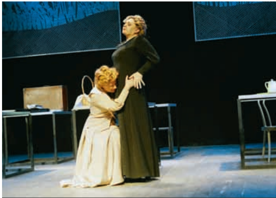
«Чайка». Театр «Версия».

Комедия «Чайка» была написана А.П. Чеховым в 1896 году. Переломная пьеса Чехова-драматурга не вписывалась в канон русского театра, поэтому в первом представлении комедия имела оглушительный неуспех. А.П. Чехов писал: «В театре было тяжелое напряжение недоумения и позора». Однако спустя два года постановку МХТ встретили по-другому, публика «разразилась стоном и аплодисментами». С тех пор режиссеры мирового театра и кино неоднократно обращались