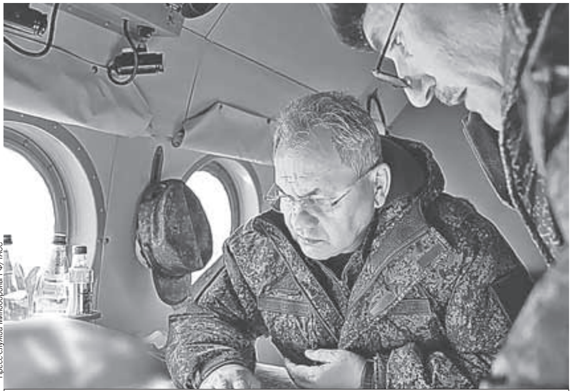
Сергей Шойгу облетел группировку войск в районах проведения СВО, проверив передовые позиции российских подразделений.