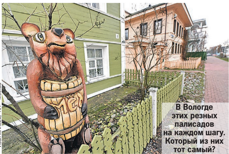
В Вологде этих резных палисадов на каждом шагу. Который из них тот самый?

Захотел, дескать, государь сделать Вологду столицей России, да купцы местные сообразили - невыгодно. Логика известная - придут москвичи, отожмут бизнес. И устроили вологодские царю, как сейчас сказали бы, теракт. В строящемся храме