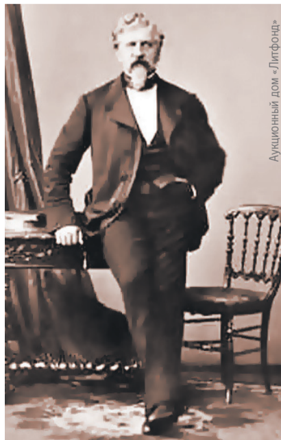
Аукционный дом «Литфонд»

Вряд ли имя Жоржа Дантеса вызывает у россиян приятные ассоциации, но нельзя не признать, что французский офицер сыграл огромную роль в истории нашей культуры. В 1837 году Дантес убил на дуэли Александра Пушкина , которому было всего 37 лет. Так Дантес, хороший или плохой, стал частью нашей истории, и неудивительно, что его фото по итогам состоявшегося в Москве аукциона «Литфонда» было оценено в 340 тысяч рублей (стартовая цена - 90 тысяч рублей). Снимок, на котором Дантесу 53 года, сделал Андре Дисдери , фотографировавший в том числе и Наполеона Бонапарта .