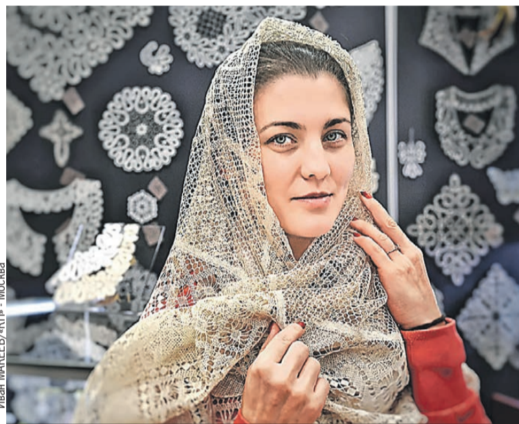
Главный плюс автостопа через всю страну - в каждом городе можно обзавестись сувениром. В Вологде - кружева. Теплые, красивые.