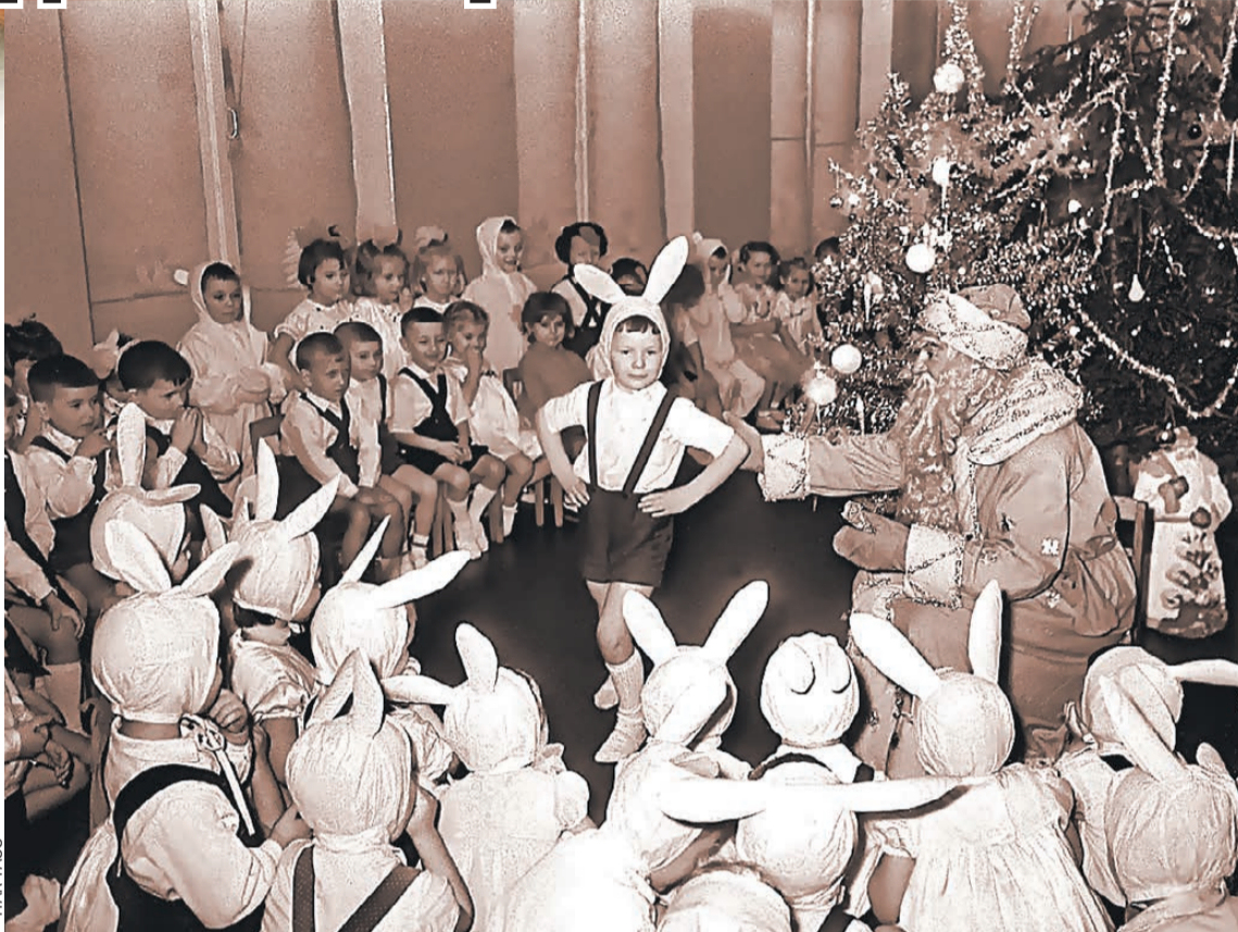
Мальчики-зайчики и девочки-снежинки - неизменная классика детской новогодней моды.

- Я ходил в садик в начале 60-х. Был в семье единственным ребенком, а вокруг меня тогда были родители, бабушки, прабабушка. Конечно, им всегда хотелось сделать для меня лучший праздник, поэтому они мастерили костюмы сами. Когда я в садик ходил, мой костюм позволил мне встать на табуретку и спеть Деду Морозу песню: «Я Петрушка маленький, малень-