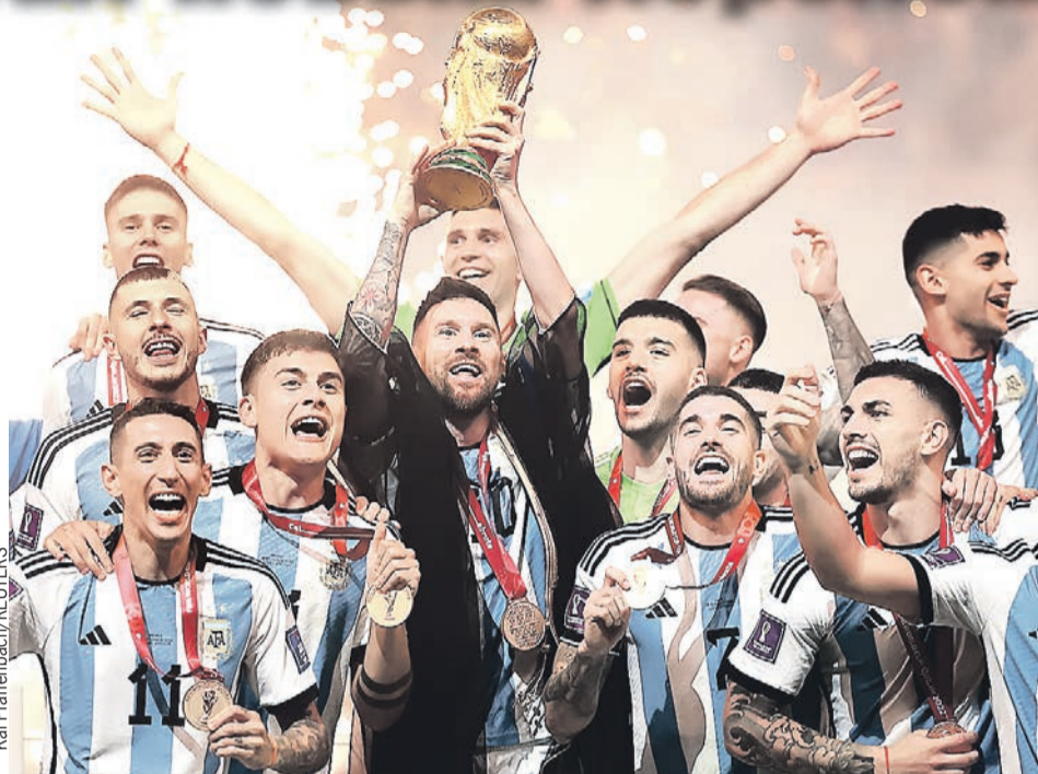
Триумф Месси и его партнеров. Кубок мира - у Аргентины!

Почти всегда он был лучшим. Он забивал самые важные голы и раздавал гениальные передачи. Он рычал на голландцев и утешал проигравшего хорвата Модрича. К финалу Лионель подошел с феноменальным результатом - 5 голов, 3 голевых паса, самое большое количество передач под удар, самое большое количество ударов. Именно так и надо сражаться за свою мечту.