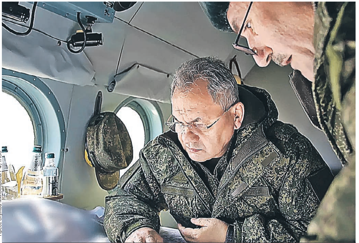
Сергей Шойгу облетел группировку войск в районах проведения СВО, проверив передовые позиции российских подразделений.