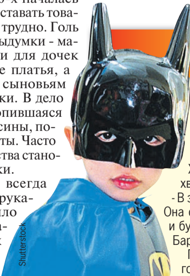
В наши дни мастерить костюмы нужды нет - их полно в магазинах.

Перечислять категории новых костюмов к 2020-м годам стало трудно, праздничные одежды охватили русские и зарубежные мультки, русский фольклор и сказки. Впрочем, без старых добрых снежинок и зайчиков праздники не обходятся до сих пор.