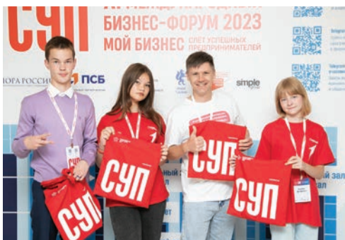
Слет успешных предпринимателей