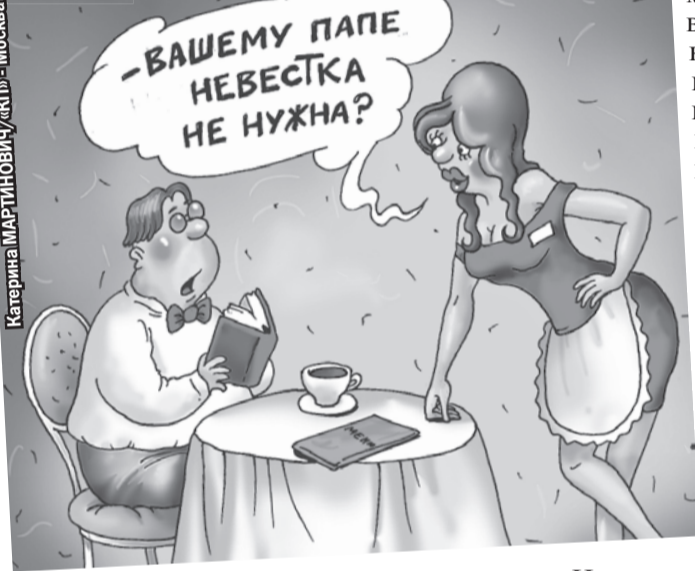
Катерина МАРТИНОВИЧ/«КП» - Москва

4 На работе временно за тишь, зависаю в соцсетях. Стучится в друзья какой-