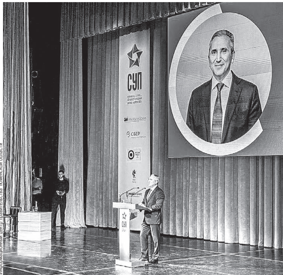
Информационный центр правительства Тюменской области

На протяжении последних лет область - лидер в стране по созданию инвестиционного климата, развитию промышленности, поддержке предпринимательства. По мнению Александра Моора, качественный и количественный рост Тюменской области невозможен без сильного предпринимательства, без людей, которые создают рабочие места, разви-