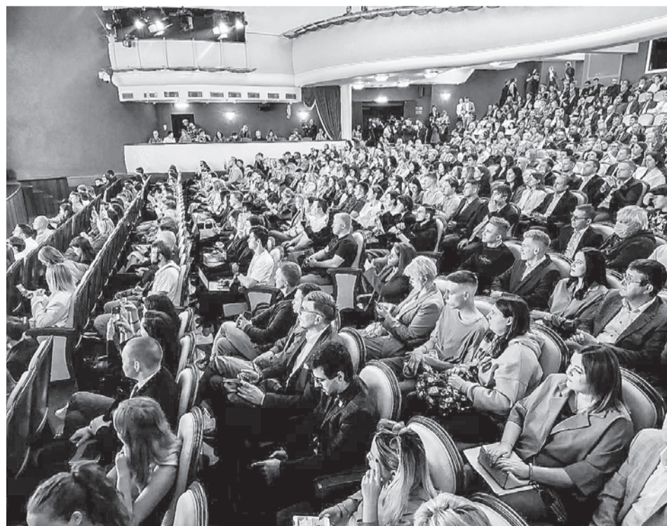
Информационный центр правительства Тюменской области

Предпринимателям готовы предоставить и инвестиционные займы. Ставки по ним не менялись последние три года.