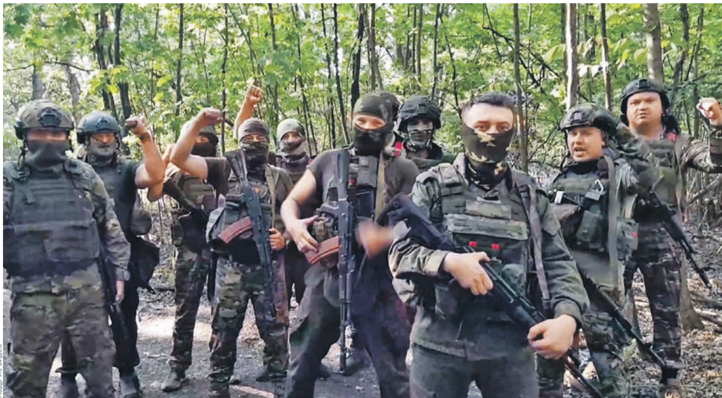
Кадр из видео