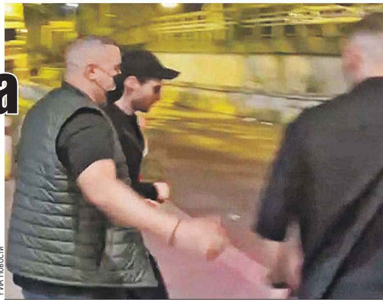
Выйдя из-под ареста, Павел Дуров (на фото он в черной кепке) на вопросы журналистов отвечать отказался и быстро прошел в поджидавшую его машину.

Руководство мессенджера, написало Politico, якобы «отказалось сотрудничать» с