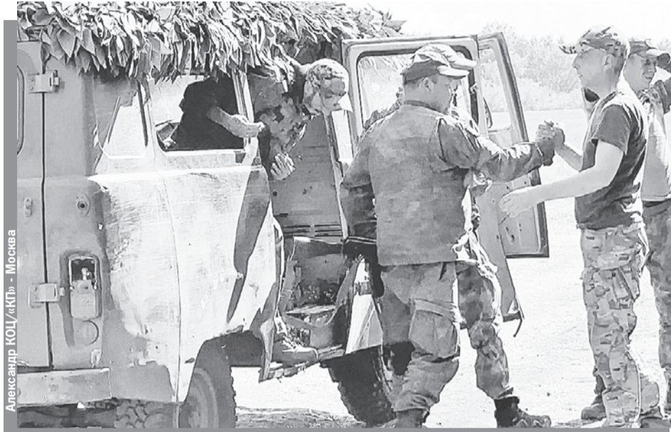
Прорвавшихся из ада окружения бойцов встречают боевые товарищи.