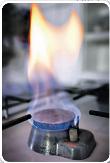
На сегодняшний день Россия, крупнейший в мире импортер голубого топлива, газифицирована всего лишь на 65%.