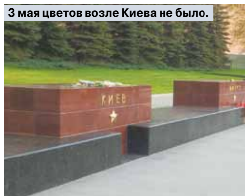
3 мая цветов возле Киева не было.