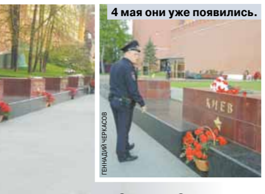
4 мая они уже появились.