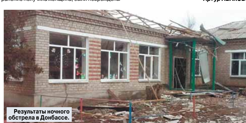
Результаты ночного обстрела в Донбассе.

200 боеприпасов, которыми были прицельно обстреляны два крупных населенных пункта. Больше всего пострадали 3 поселка в самопровозглашенных республиках: Стаханов, Первомайск и Горловка. В первых двух были разрушены 38 домов, почти 7,5 тысячи человек остались без света. Там же погибла пенсионерка и были ранены 4 человека, один из них в тяжелом состоянии находится в реанимации. В Горловке ранение получила женщина, были повреждены