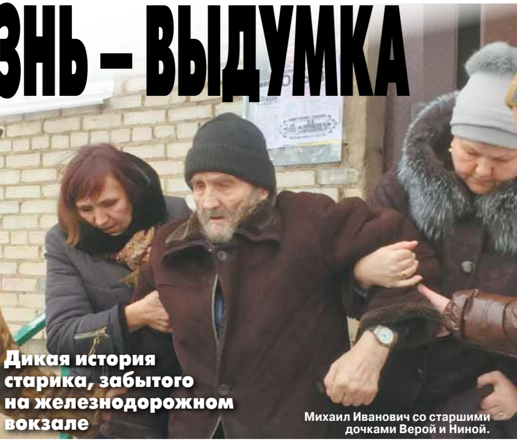
Дикая история старика, забытого на железнодорожном вокзале