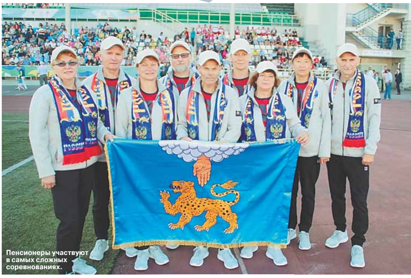
Пенсионеры участвуют в самых сложных соревнованиях.