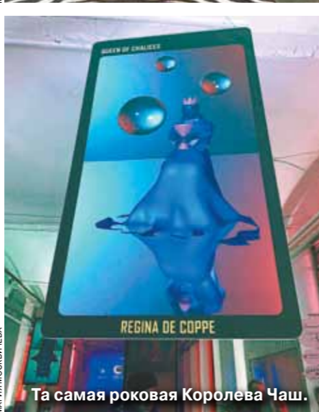
Та самая роковая Королева Чаш.

Второе место досталось арт-группе «Помидор» за проект «Путаная навигация», в качестве приза — консультация с психологом.