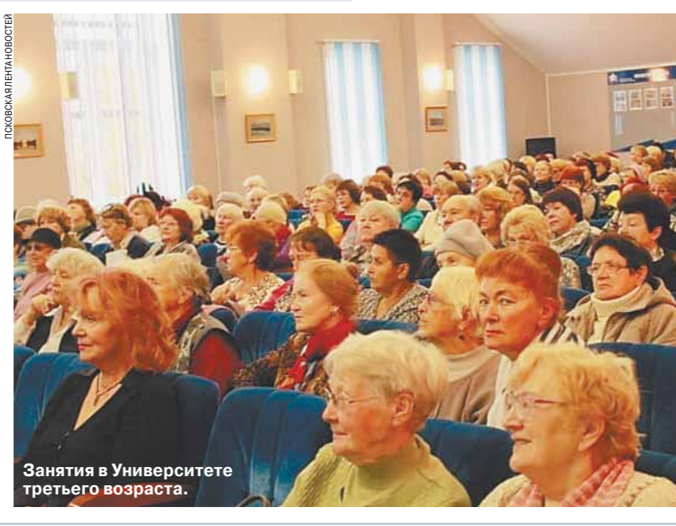
Занятия в Университете третьего возраста.

Занимаются псковские слушатели университета на самых разных площадках — сейчас очень ждут, когда завершится ремонт в областной библиотеке на улице Профсоюзной. Впрочем, помогают им и другие библиотеки города — центральная, «Родник».