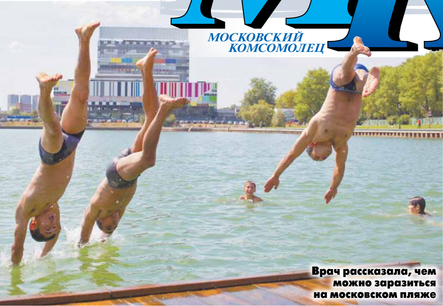
Врач рассказала, чем можно заразиться на московском пляже