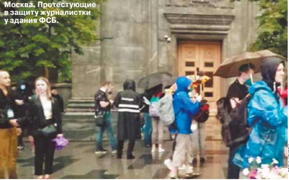
Москва. Протестующие в защиту журналистки у здания ФСБ.