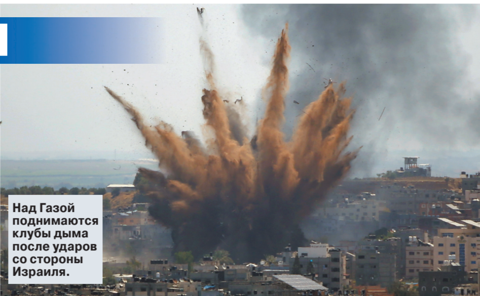
Над Газой поднимаются клубы дыма после ударов со стороны Израиля.

В настоящее время очень большие полицейские силы патрулируют в Лоде, Хайфе и Акко. Правоохранители не допустят