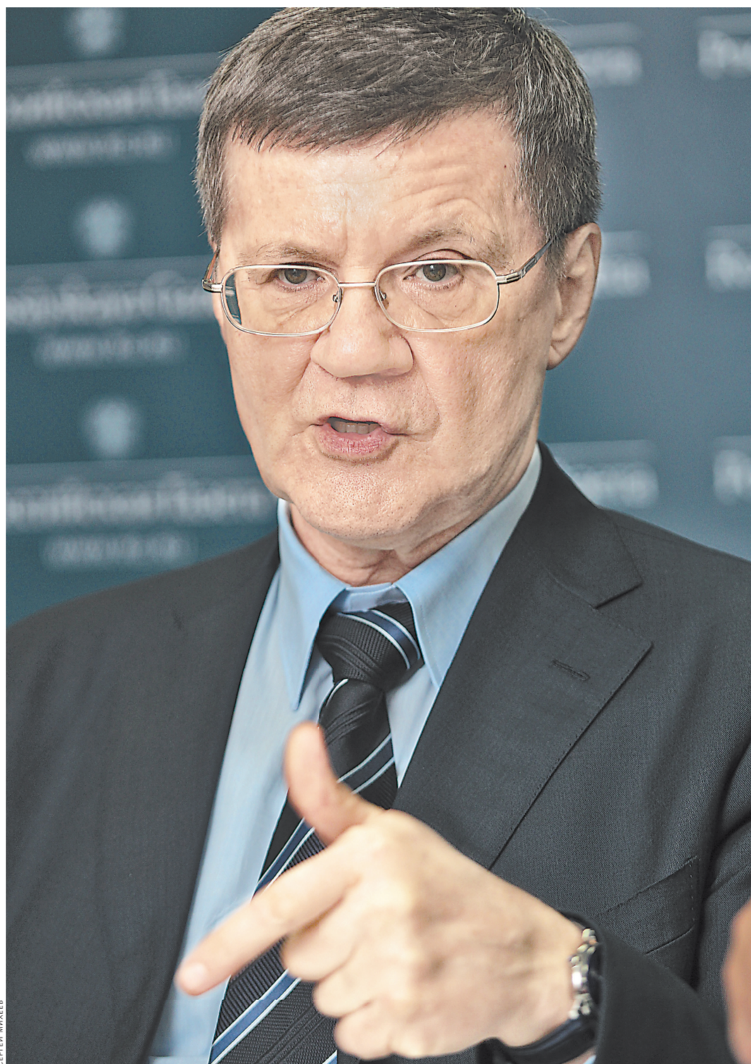
Юрий Чайка: Уверен, что по некоторым составам преступления снижение меры наказания ничем не оправдано.

Как крадут из нашей квартиры? ЮРИЙ ЧАЙКА: В качестве примера приведу вам один вопиющий факт. В Краснодарском крае ряд энергетических компаний в расчет тарифов включили расходы на проведение праздничных мероприятий, представительские расходы и размещение рекламы. Если бы не вмешательство прокуратуры, то потребителям электроэнергии в совокупности пришлось бы заплатить «лишних» 28 миллионов рублей! Я принял решение обобщить имеющиеся проблемы на совещаниях во всех федеральных округах, лично выезжал в Северо-Западный, Уральский и Приволжский федеральные округа.