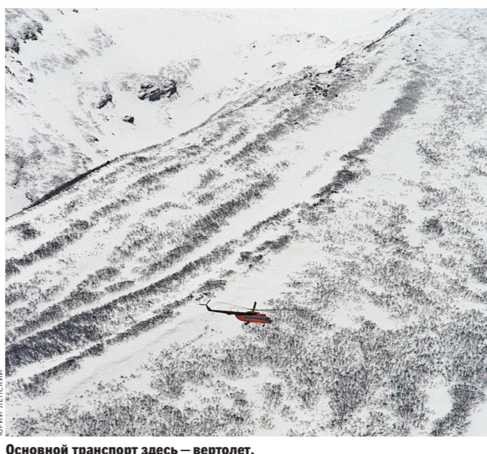
Основной транспорт здесь — вертолет.