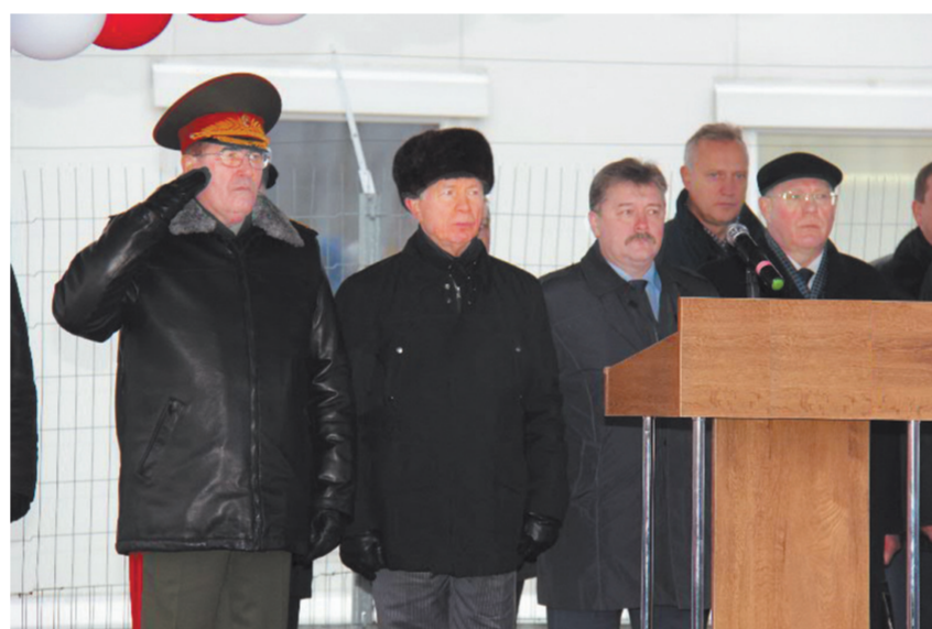
Митинг в честь начала пуско-наладочных работ комплекса по уничтожению боеприпасов сложной конструкции.

Их запасы не превышают двух десятых процента от общих, однако время для их уничтожения, как оценивают специалисты, потребует значительное. Начальником Федерального управления генерал-полковником Валерием Капашин поставлена задача — безусловное обеспечение безопасности. Сконструированные камеры расщепления и подрыва имеют десятикратный запас прочности, одновременно на линии будет находиться только 1 боеприпас. Поточная линия максимально автоматизирована и роботизирована. Другая страна, обладающая химическими боеприпасами сложной конструкции, имея финансовые, промышленные, технологические и иные ресурсы, заявила, что подойдет к созданию подобной линии не ранее чем через несколько лет.