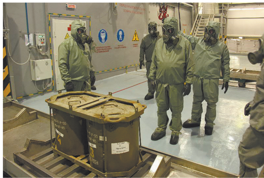
Боеприпас сложной конструкции подан на линию расщепления.