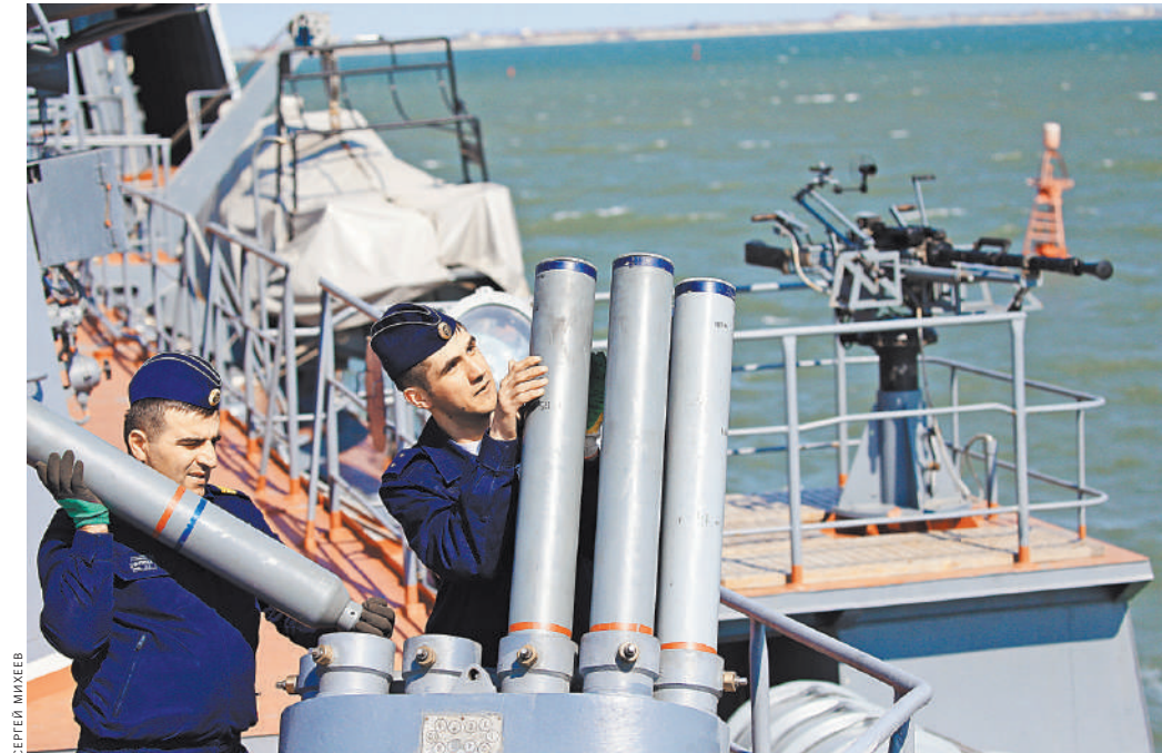
Вот эти снаряды (весом от 20 до 25 кг) после выстрела из пусковой установки образуют облако из радиоэлектронных и оптико-электронных ложных целей, которые и уведут в сторону от своего корабля ракеты противника.

крышки контейнера «Калибра». Именно той первой ракеты, которую «Углич» выпустил по базе исламских радикалов на территории Сирии.