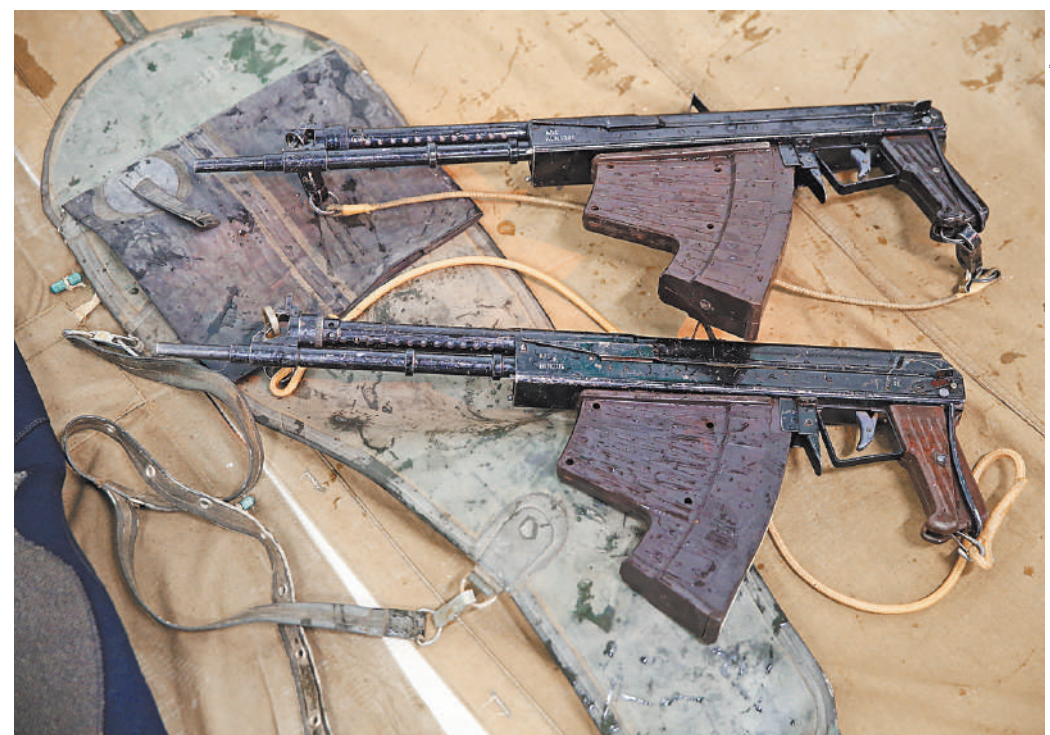
5,66-мм автомат АПС. Под водой его игольчатые пули смертельны на дистанции 30 м. На суше — до 100 м.