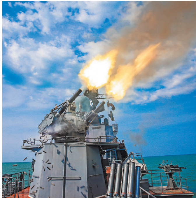
Комплекс «Палаш» работает по воздушным целям. Темп стрельбы — 10 000 выстрелов в минуту — позволяет распылить пополам вражеский корвет.

О том, насколько опасная работа у боевых пловцов, нам удалось увидеть в деле. Командование флотилии предоставило возможность выйти в море. Фотокорреспондент — на сторожевике «Дагестан», автор этих строк — на малом ракетном корабле «Углич». Корабли сбивали воздушные цели, расстреливали из пулеметов плавающие мины. В каюте командира «Углича» обратил внимание на композицию: фото стартующей ракеты «Калибр» и фрагмент какого-то материала. Что это? Оказалось, реликвия: композитная плитка