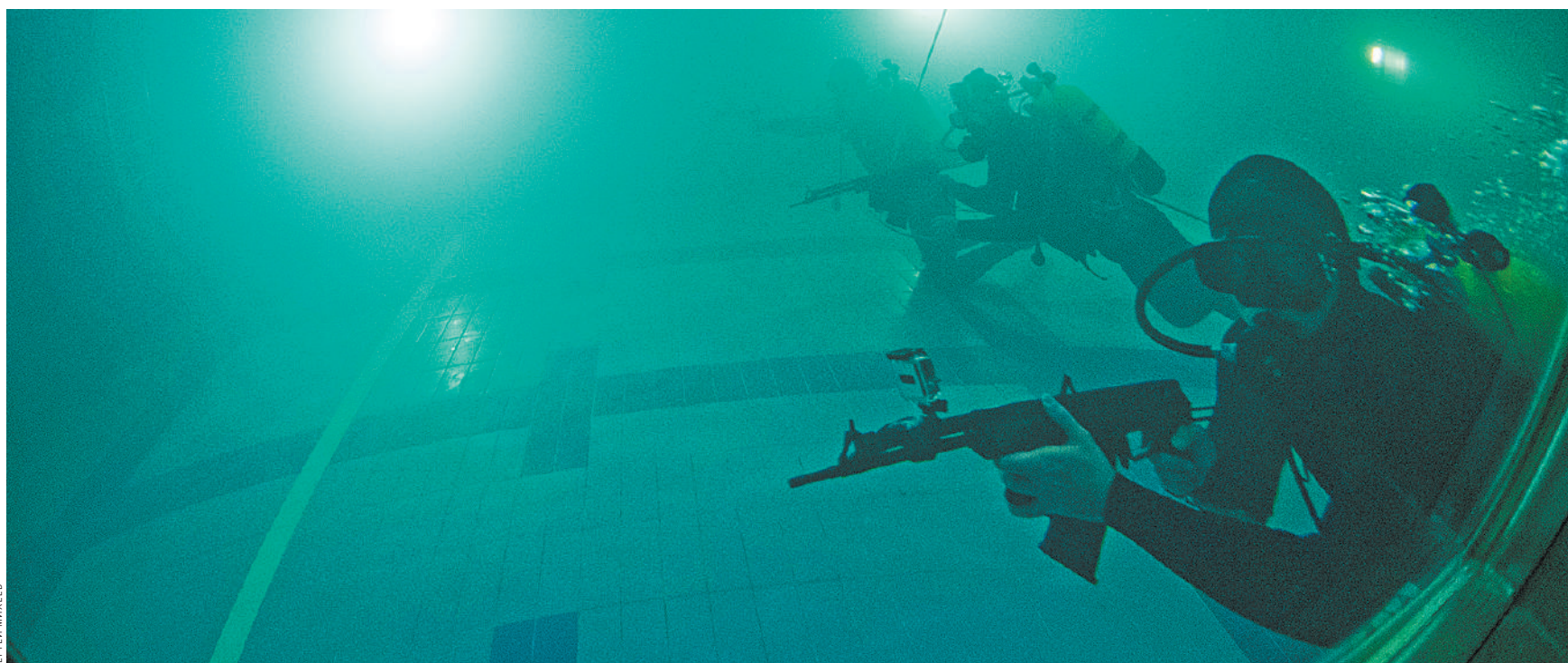
Каспийск: боевой пловец 137-го отряда спецназначения в подводном тире. Мировые разведки просим не волноваться: на автомате не новый прицел, а журналистская экшн-камера GoPro.