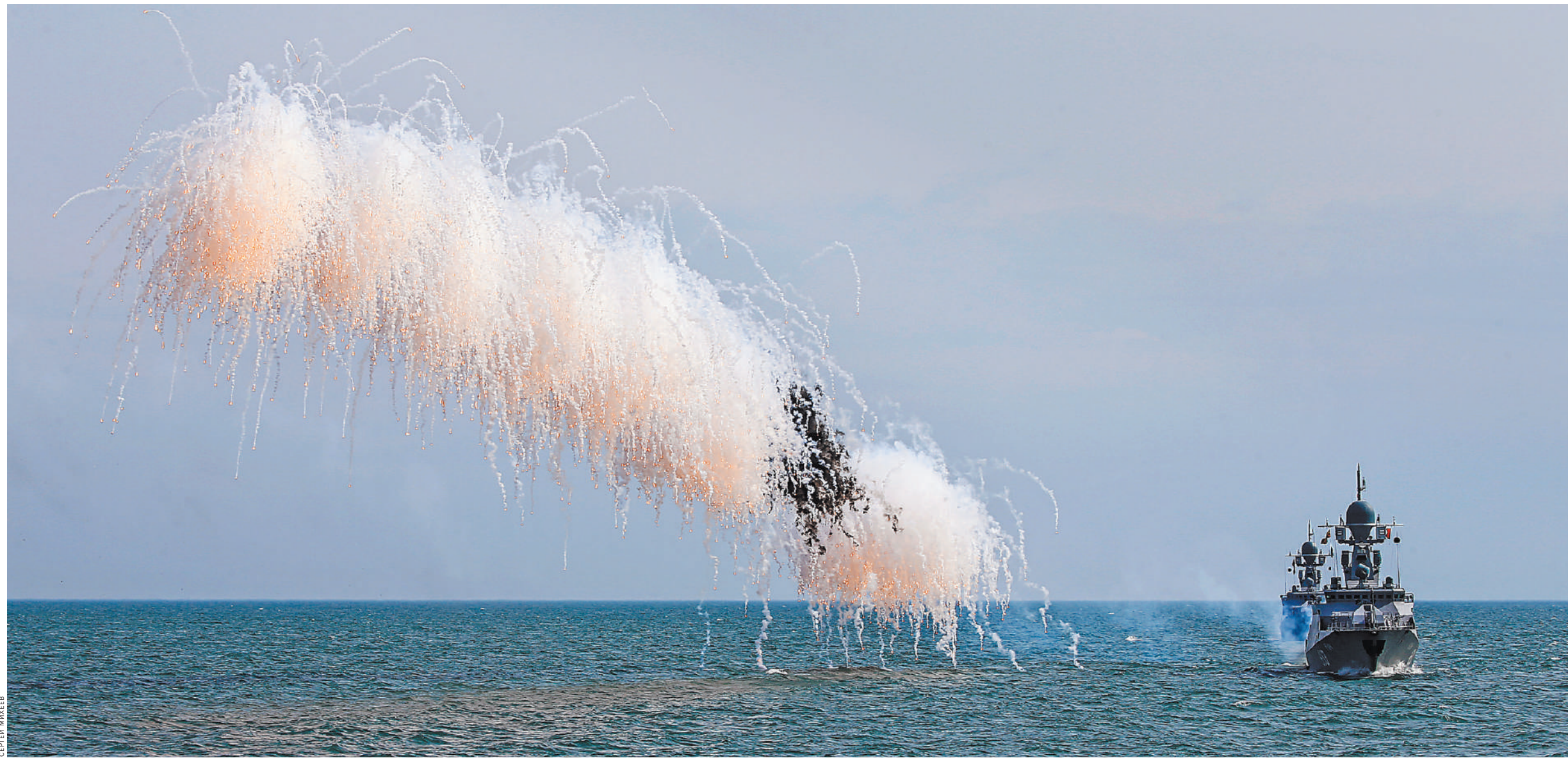
Похожее на фейерверк разноцветное облако — тепловые и радиолокационные ловушки, которые «сводят с ума» системы наведения вражеских ракет. Радары противника тоже на несколько минут ослеплены. Корабли Каспийской флотилии отражают нападение с воздуха.

Политические реалии и новые российские технологии все изменили. Реалии — это угроза