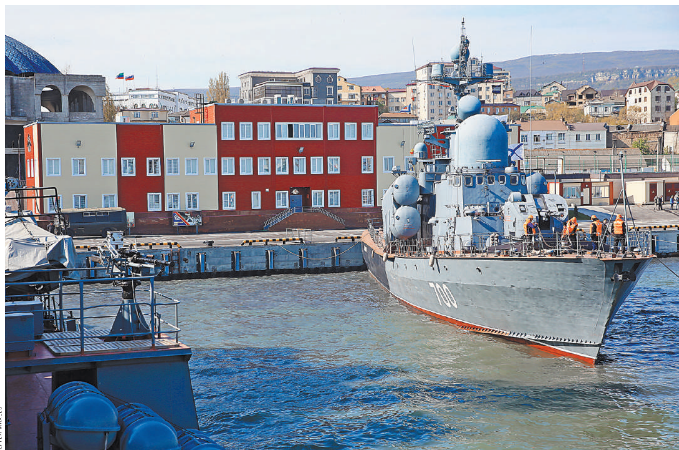
Махачкала: новое служебное здание на основе быстровозводимых конструкций стоит на отвоетанном у моря железобетонном «береге».

Что называется: эта служба и опасна, и трудна. Поэтому пловец должен эффективно и быстро выполнить поставленную задачу. И исчезнуть. И пусть вражеские гранаты поднимают грунт со дна там, где наши ух и след простыл. ●