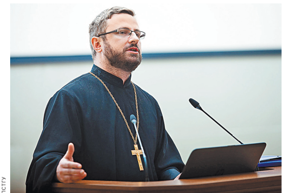
«РГ» публикует размышления известного теолога Дарко Джого о расколе в мировом православии.