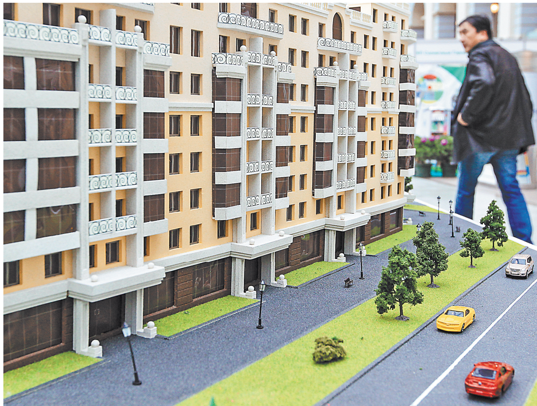
Новый закон сделает значительно более безопасной покупку квартиры на рынке вторичного жилья.

Наталья Козлова Сегодня «Российская газета» публикует закон, который обеспечит сделкам на рынке жилья большую безопасность. Жилищный рынок в последние годы развивается стремительно. Данные Росреестра это подтверждают — в прошлом году граждане зарегистрировали 3 619 441 право собственности на недвижимость. А только за девять месяцев нынешнего года — 2 552 096. В этих цифрах — и те собственники, кто стал жертвой обмана. Речь о людях, кто честно