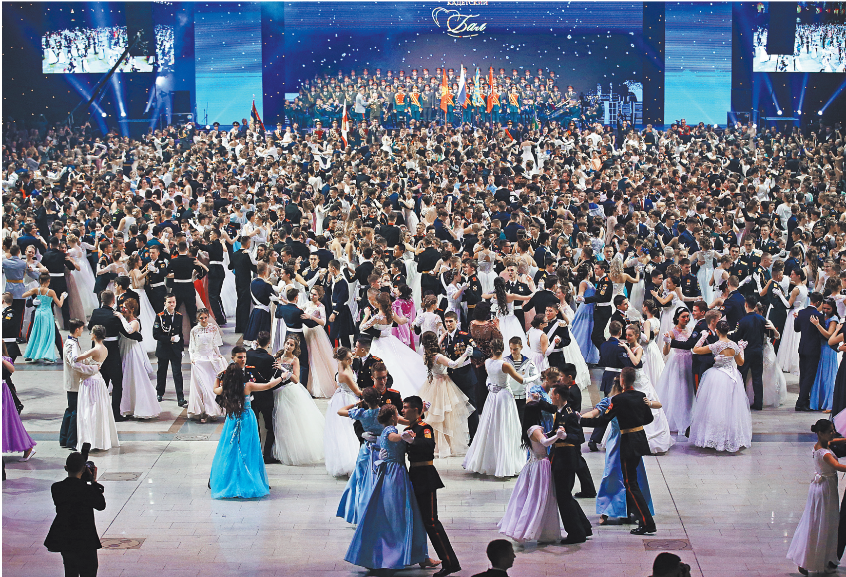
В балу в Гостином дворе участвовали полторы тысячи юных танцоров из России, Беларуси, Казахстана, Кыргызстана, Южной Осетии, Донецкой и Луганской народных республик.

Фоторепортаж смотрите на сайте rg.ru/sujet/1560