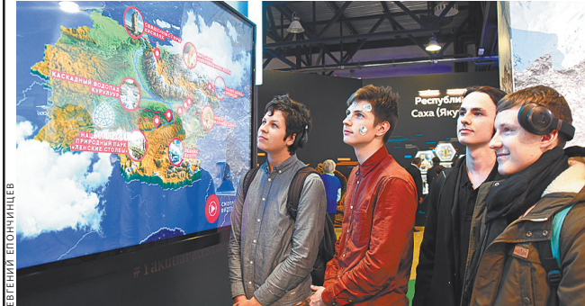
Интерактивная презентация Республики Саха (Якутия) привлекала много юных москвичей.

Еще одно, четырехстороннее соглашение, подписано руководителями республики, министерства по развитию Дальнего Востока и Арктики, Газпромбанка и АО «Колмар Групп», посвящено реализации крупного проекта по строительству жилого квартала на 2000 квартир в якутском городе Нерюнги. Будущие владельцы этого жилья, построенного компаниями «Колмар», смогут воспользоваться «дальневосточной ипотекой» под два процента годовых. ●