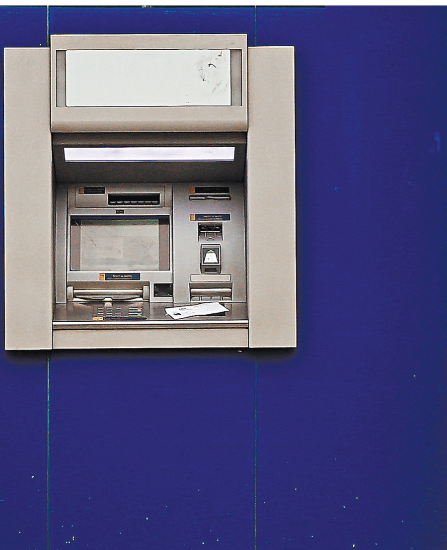
Банки часто пытаются получить повышенное вознаграждение за электронные транзакции, которые не влекут никакой нагрузки. Это явление премьер-министр Дмитрий Медведев называл региональной дискриминацией и требовал его устранить. Проведенный ФАС, минфином и Банком России анализ рынка онлайн-переводов граждан показал, что доля Сбербанка на нем — около 94%.

Теперь требования смягчаются. При переводе небольших сумм достаточно ФИО, а также серии и номера паспорта. Авторы поправок — группа депутатов — пришли к выводу, что такие операции имеют низкий риск легализации или отмывания преступных доходов и финансирования терроризма.