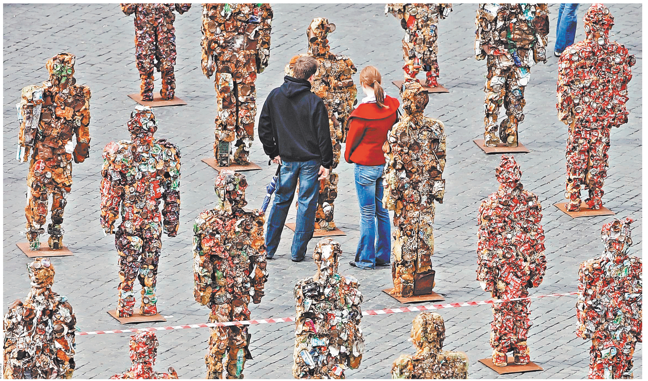
Собрать мусор и вывезти — полдела. Его еще надо эффективно переработать. С пользой и с прибылью.

1 Требуется субсидии А если, например, пенсионерка осталась одна в двухкомнатной квартире? Дети уехали, муж умер. И платить приходится с большой площади. Это справедливо?