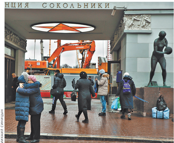
Сокольники совсем скоро получат еще одну станцию метро — парк станет ближе к центру.