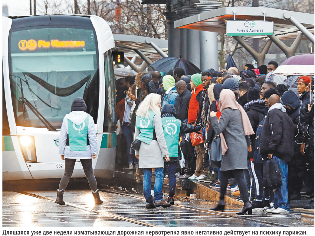
Длятся уже две недели изматывающая дорожная нервотрепка явно негативно действует на психику парижан.

— Больше фото смотрите на сайте rg.ru/sujet/3185