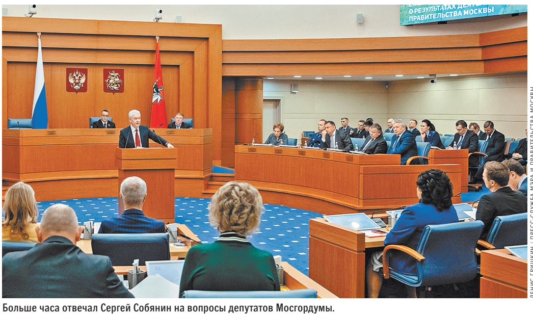
Больше часа отвечал Сергей Собянин на вопросы депутатов Мосгордумы.

Не принял мэр и упрека в том, что под предлогом капремонтов закрываются поликлиники, роддома, больницы, что в результате ухудшает доступность медицинской помощи. «Можно было ничего не делать, и пусть бы москвичи и дальше лежали на этих койках в среднем по 14–18 дней. Но мы закупили новое оборудование, которое позволяет проводить все необходимые для лечения процедуры за 3–4 дня. Построили 1 миллион современных медицинских площадей. Ведь люди выбирают, когда нужно, хорошие клиники, а не те, что ближе». О том, что оптимизация здравоохранения идет в правильном направлении, по мнению Собянина, лучше всего свидетельствует увеличение продолжительности жизни москвичей, которая выросла за во-