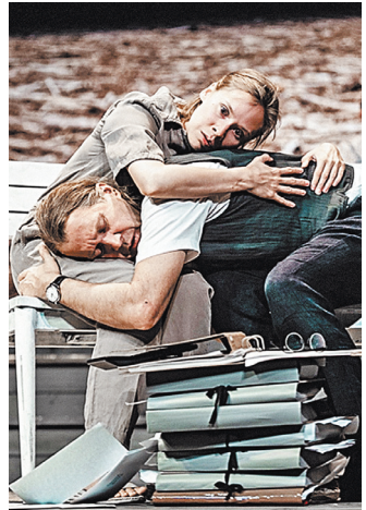
Театр Наций привезет на фестиваль спектакль «Дядя Ваня» с Евгением Мироновым в главной роли.

Руководитель Государственного Театра Наций Евгений Миронов: «Наш фестиваль внесет свою лепту, чтобы Владивосток был не только экономической столицей этой части России, но и культурной. И мне очень интересно, какой будет реакция зрителей, которые