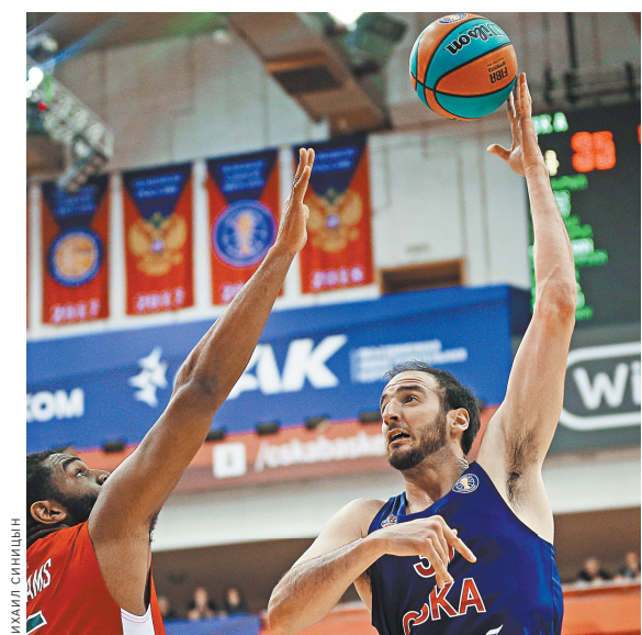
Коста Куфос провел 11 сезонов в НБА перед переходом в ЦСКА.