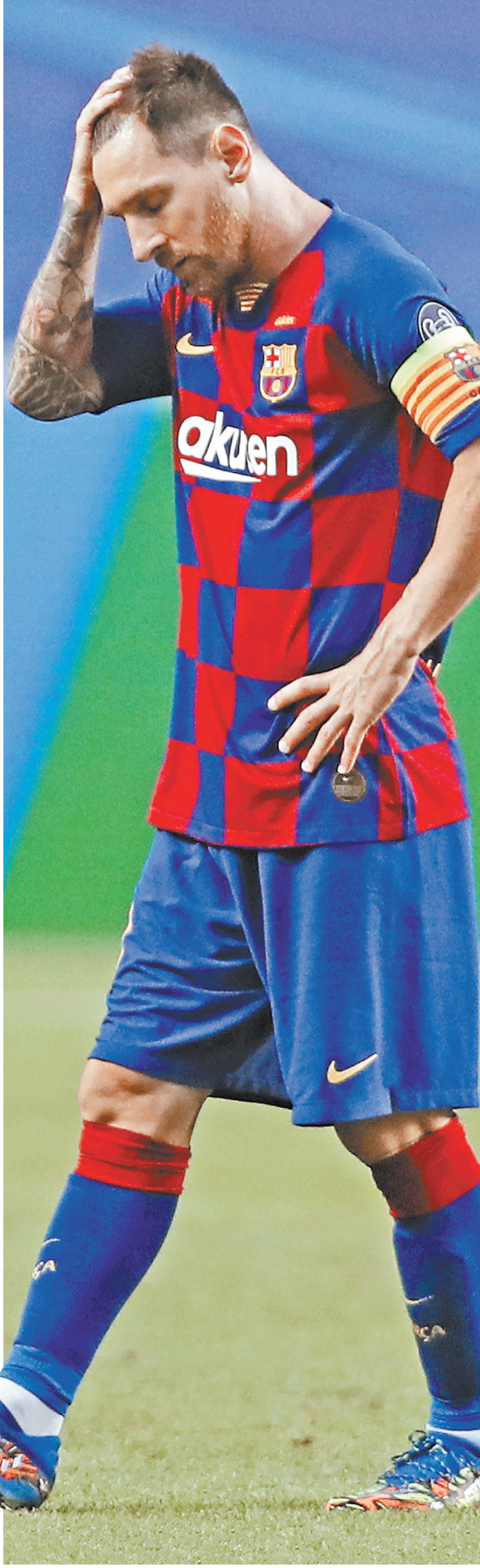
Месси с 2003 года выступает за «Барселону». Но, похоже, великая эпоха подходит к концу.

Бартомеу и его совет директоров должны немедленно подать в отставку. Они подрывают репутацию клуба. Месси с 2003 года выступает за «Барселону». Но, похоже, великая эпоха подходит к концу.