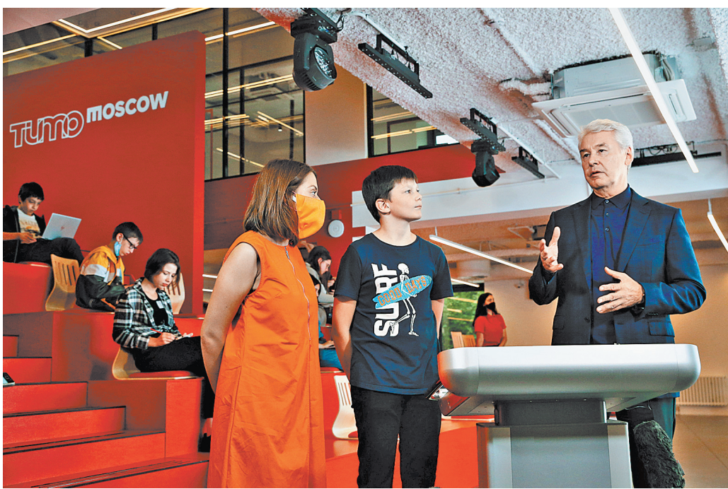
Сергей Собянин на открытии центра отметил, что в столице миллион детей посещают кружки, секции и технопарки.

— Фоторепортаж на сайте rg.ru/sujet/1560