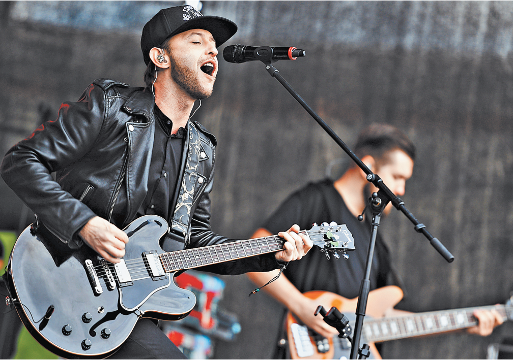
Концерт-тур получился эмоциональным, увлекательным, даже поэтичным.

Среди премьер выделялись открывающий альбом хит «Вздоходик» с привычными для группы напористыми мелодиками о себе, жизни и поре слишком навязчивого по сей день коронавируса, в кото-