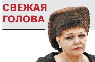
Валентина Петренко, общественный и политический деятель