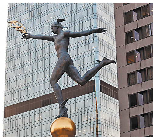
В Центре международной торговли можно получить любую услугу для работы и отдыха не выходя на улицу.

Из зала форума можно вести онлайн-диалоги с любым городом мира. Общение идет как на реальных конгрессах