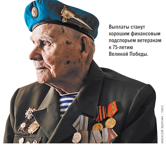
Выплаты станут хорошим финансовым подспорьем ветеранам к 75-летию Великой Победы.

Всего выплата ко Дню Победы будет начислена 1,148 млн человек, из них по 75 тысяч рублей получат более полумиллиона человек. ●