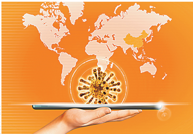
Коронавирус оказался опасен даже в интернете.

Число доменов, связанных с коронавирусом, за минувшую неделю выросло по всему миру на 6 тысяч, а с начала января — более чем на 16 тысяч, сообщает РИА Новости. По данным экспертов, вероятность того, что они представляют киберугрозу, на 50% выше, чем у других доменов.