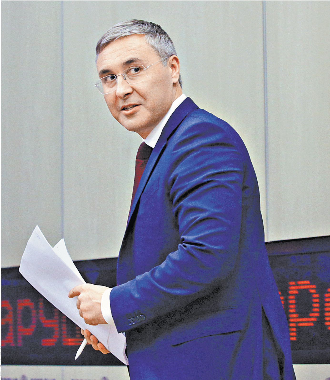
Министр Валерий Фальков: Минобрнауки сейчас в пилотном режиме отработывает новый сервис «Поступи в вуз онлайн».

Важно, что с самого начала перехода на дистанционное обучение работает «горячая линия» Минобрнауки — эксперты консультируют по любым вопросам. Так, на сегодня принято уже более 500 обращений,