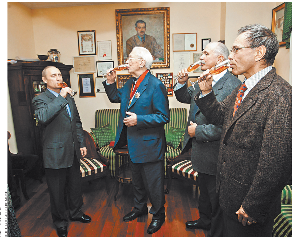
Фотокорреспонденты «Российской газеты» сопровождают Владимира Путина на протяжении 20 лет. На снимках — три момента двух десятилетий (слева направо). 3 июля 2009 года. Владимир Путин за столом с аграриями во время посещения сельхозпредприятия на Кубани. 26 декабря 2008 года. Владимир Путин еще в статусе премьера посетил новогоднюю ярмарку в Петербурге и вместе с юным горожанином отчеканил старинную монету. 12 марта 2003 года. Владимир Путин приехал домой к Сергею Михалкову по случаю его юбилея, на встрече также были сыновья автора гимна СССР Никита Михалков и Андрон Кончаловский.