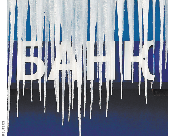
Сейчас закон гарантирует право на временную заморозку выплат по ипотеке для заемщиков в тяжелой ситуации.

Сейчас законом гарантировано право на кредитные каникулы ипотечных заемщиков, попавших в сложную жизненную ситуацию. Ранее также ЦБ рекомендовал банкам оперативно рассматривать заявления на реструктуризацию потребкредитов от заемщиков, заразившихся коронавирусом. ●