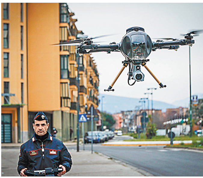
В Италии полиция отслеживает нарушителей карантина с помощью дронов.