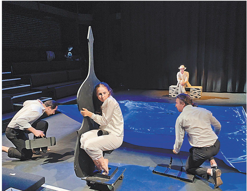
С этого спектакля «Человек в футляре» началась история театра «Хамелеон».

— А вчера мы тонули лучше, чем в том первом спектакле, который вы смотрели.