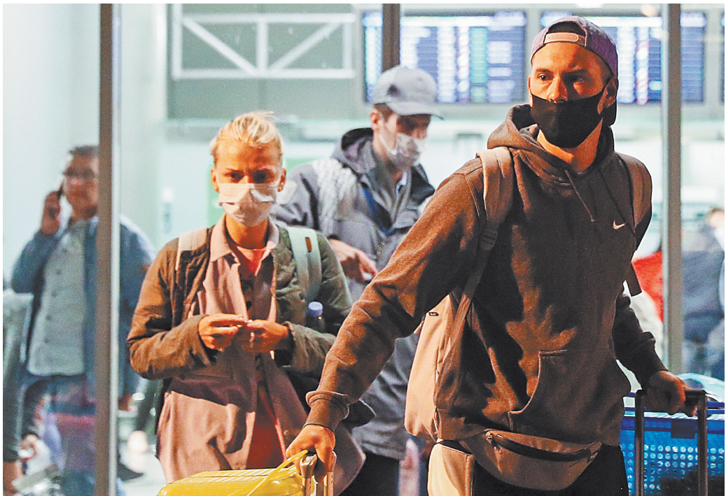
По приезде в Россию путешественников ждет медицинский контроль и карантин.

Ограничения на авиасообщение введены почти по всему миру. Россия на фоне пандемии нового коронавируса с 23 марта также ввела ограничения на авиасообщение с большинством стран. В частности, со странами Евросоюза, США, Великобританией, Швейцарией, Норвегией, ОАЭ, Турцией, Таиландом, Японией. В порядке исключения возможны charterные рейсы для вывоза россиян, а также регулярные рейсы в столицы. Например, в список исключений вошли Минск и Баку, Ереван, Берлин, Париж и Рим, Мадрид, а также Нью-Йорк и Бангкок. Полный список опубликован на сайте Росави-