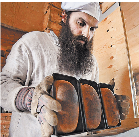
В перспективе снижение взносов может стать стимулом для повышения зарплат сотрудникам.