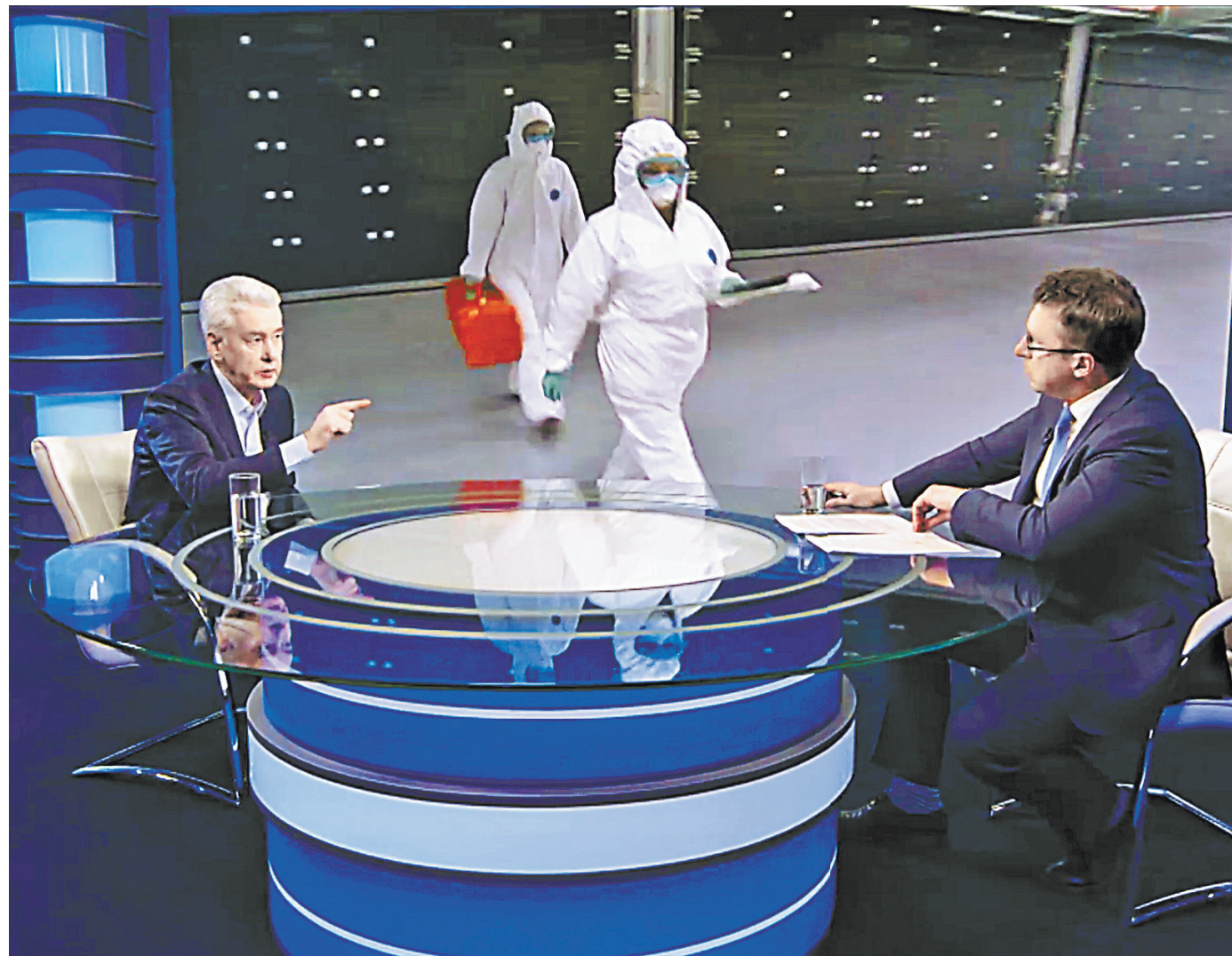
Собянин: Я надеюсь на помощь москвичей, на помощь руководителей предприятий и организаций.