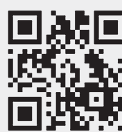
Последние новости о коронавирусе — на сайте «РГ».

За весь период в России вывелись от коронавирусной инфекции 29 граждан. Два пожилых пациента, 88 и 73 лет, с положительным диагнозом на коронавирус, скончались. У них была пневмония и сопутствующие патологии.