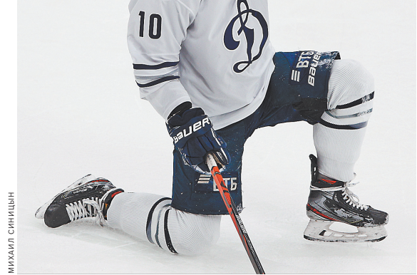
Шестой матч серии «Динамо» — «Спартак» в рамках первого раунда плей-офф стал последним в этом сезоне КХЛ.

Третьяк подчеркнул, что готов возобновить переговоры с КХЛ о продолжении сезона, если ситуация улучшится.