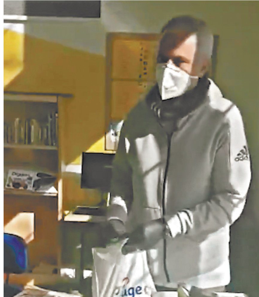
Роналду и Моуринью стараются помочь людям в это непростое время.

«Если что-то хотите донести до родителей, не действуйте через меня: мол, передайте им то-то и то-то. Нет, сами подойдите и по-русски или по-английски скажите. Они тут же уточнят у меня нюансы и обязательно сделают все, как вы сказали».