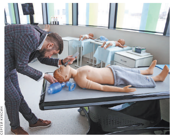
Этот робот — точная копия пациента. Так же, как и живые люди, он «умеет» болеть по-настоящему.