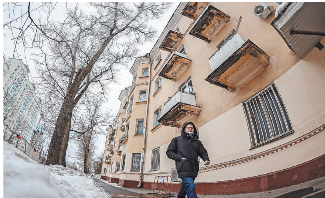
Старые дома, которые гармонично вписались в архитектурный облик районов, не будут сносить.

Система Face Pay появится до конца года на всех станциях метро. Об этом говорится в материале департамента транспорта к заседанию президиума правительства Москвы.