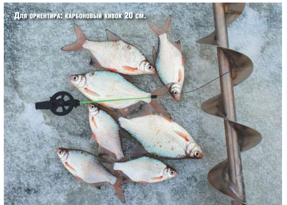
Для ориентира: карбоновый кивок 20 см.