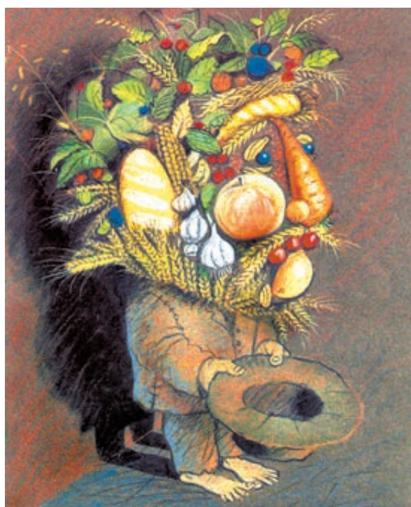
ИЛЛЮСТРАЦИЯ АЛЕКСАНДРА СЕРГЕЕВА / CARTOONBANK.RU

– Считаю, это правильное решение, – настаивает министр. – Этот фонд направлен на стабилизацию рынка, на поддержание на нем устойчивой и стабильной цены. Кстати, «закрома Родины» у нас не такие уж и объемные, вмещают всего 2,5 млн тонн. А Канада, к примеру, хранит