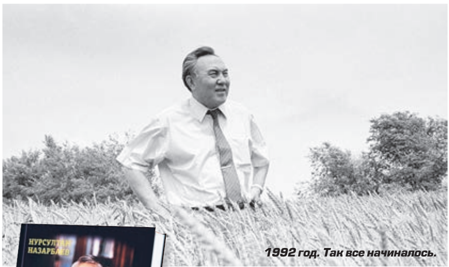
1992 год. Так все начиналось.

Впрочем, и сегодня казахстанский президент может подписать под каждым своим словом – они стали еще весомее и значительнее, потому что прошли проверку временем. Но тут стоит вспомнить именно те годы, когда слова были сказаны: во многих уголках бывшего Советского Союза бушевали кровопролитные конфликты, страдали миллионы людей. А в Казахстане уже полгода действовала Ассамблея народов Казахстана, куда вошли представители всех живущих в стране 140 народов и национальностей.