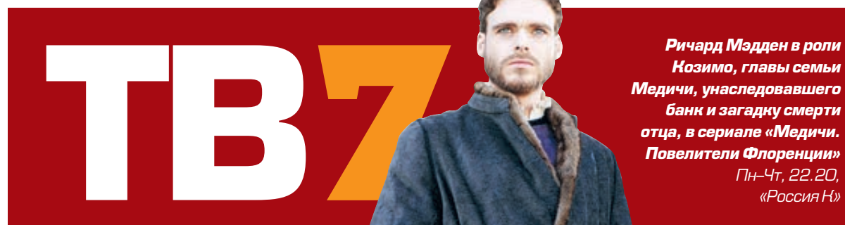
Ричард Мэдден в роли Козимо, главы семьи Медичи, унаследовавшего банк и загадку смерти отца, в сериале «Медичи. Повелители Флоренции» Пн-Чт, 22.20, «Россия К»